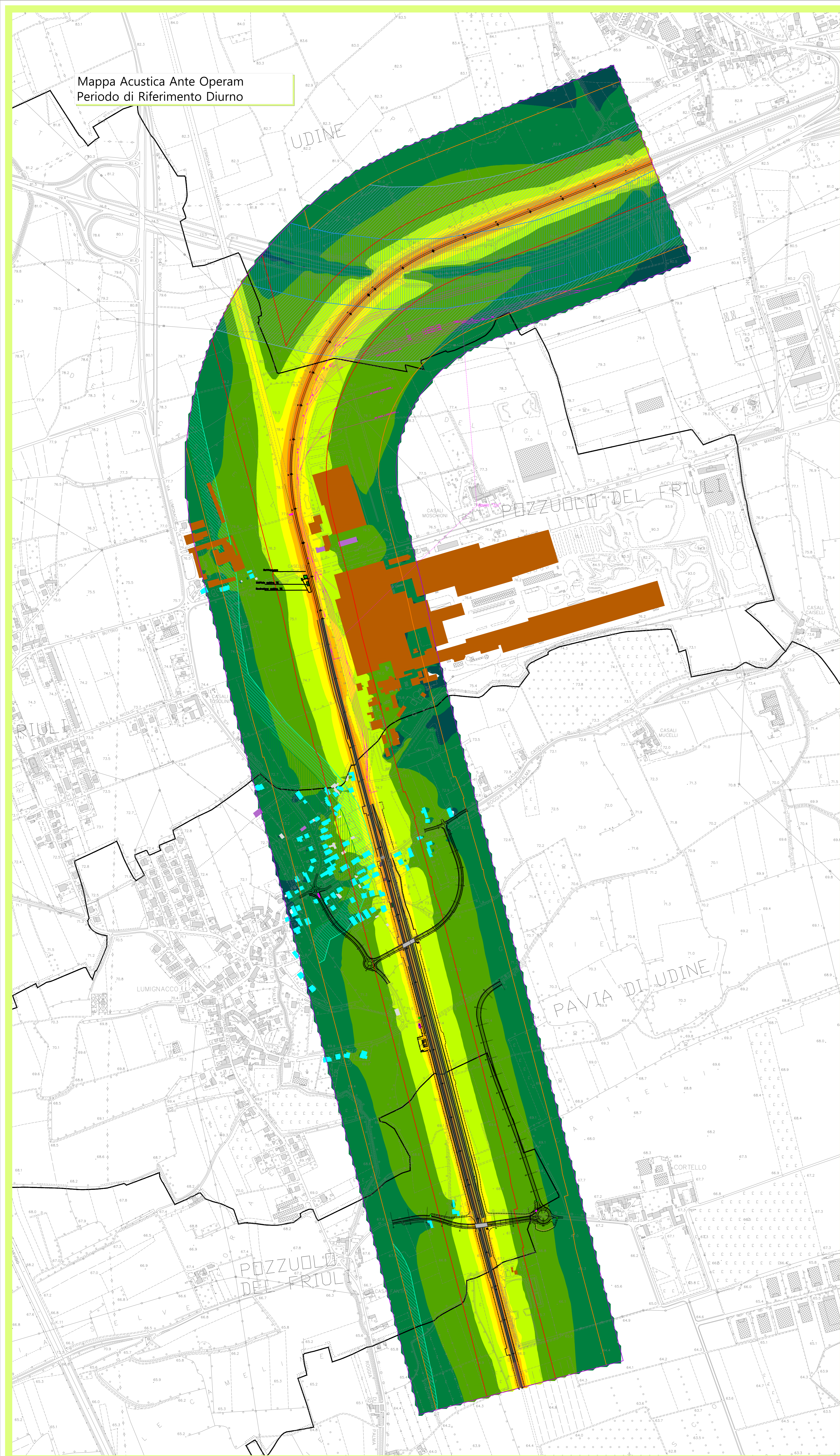
Mappa Acustica Ante Operam Periodo di Riferimento Diurno