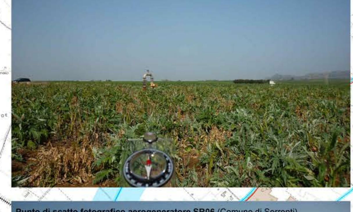
Punto di scatto fotografico aerogeneratore SR06 (Comune di Serrenti) Direzione ovest