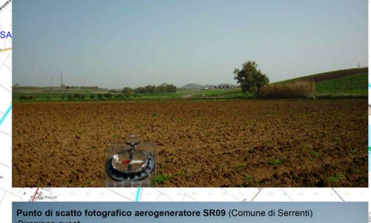
Punto di scatto fotografico aerogeneratore SR09 (Comune di Serrenti) Direzione ovest