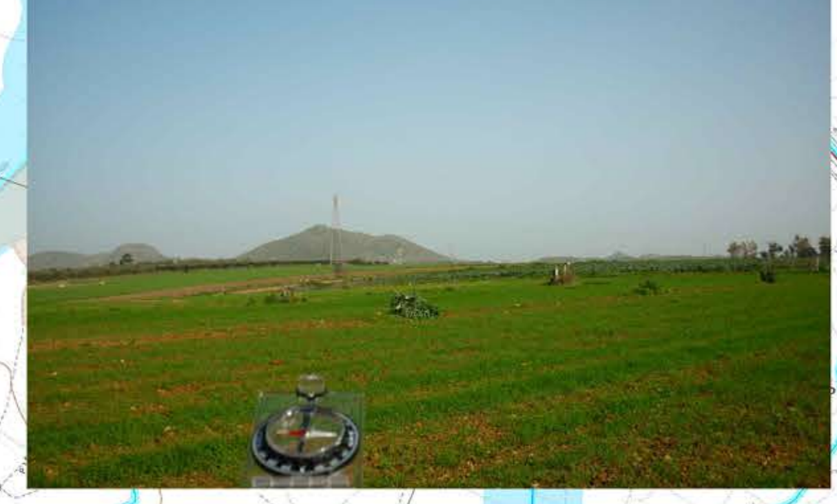
Punto di scatto fotografico aerogeneratore SM04 (Comune di Samassi) Direzione est