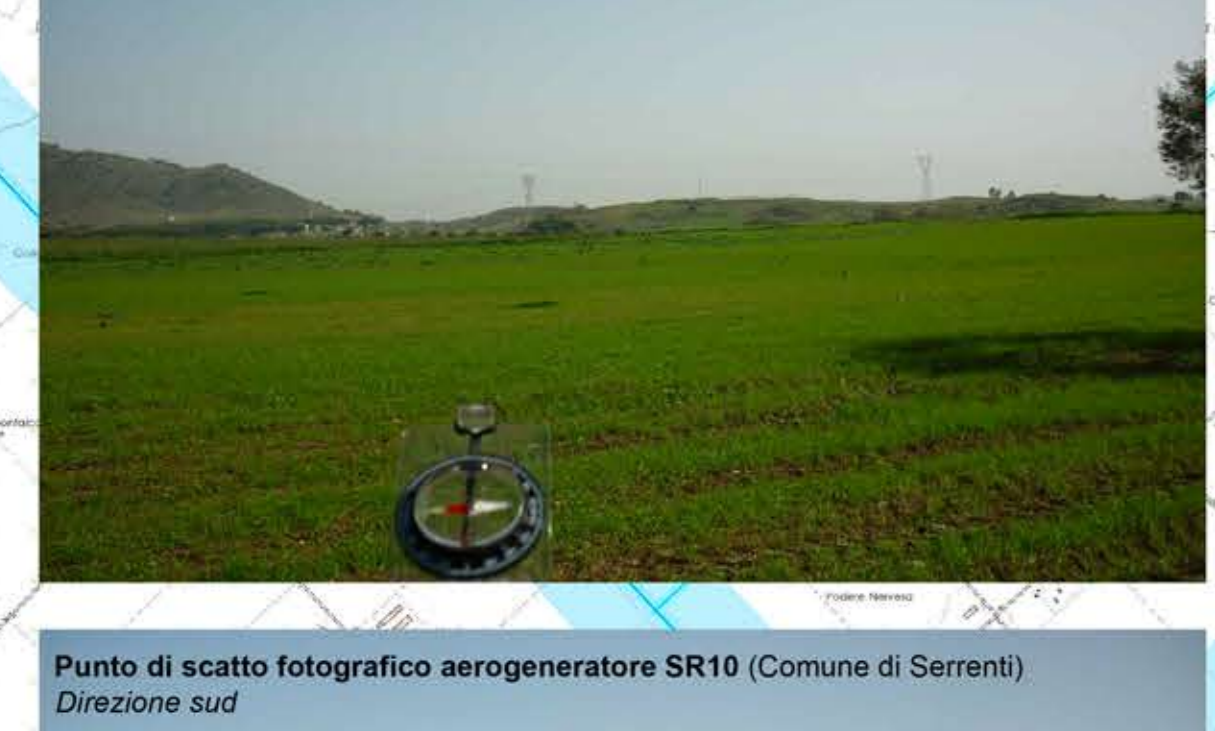
Punto di scatto fotografico aerogeneratore SR10 (Comune di Serrenti) Direzione sud