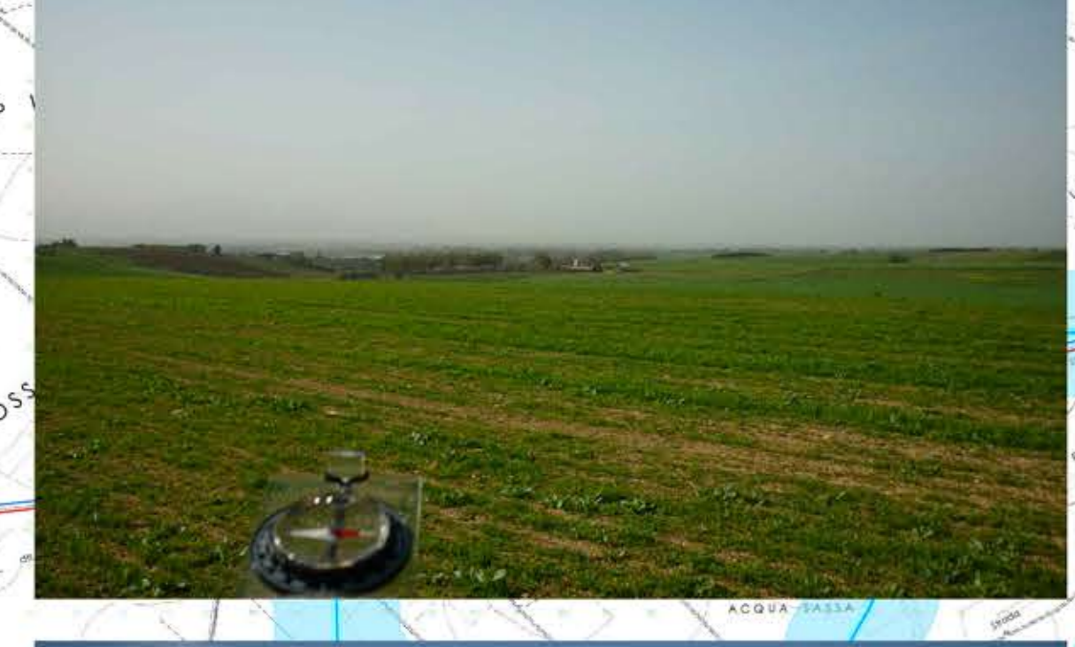
Punto di scatto fotografico aerogeneratore SM05 (Comune di Samassi) Direzione sud