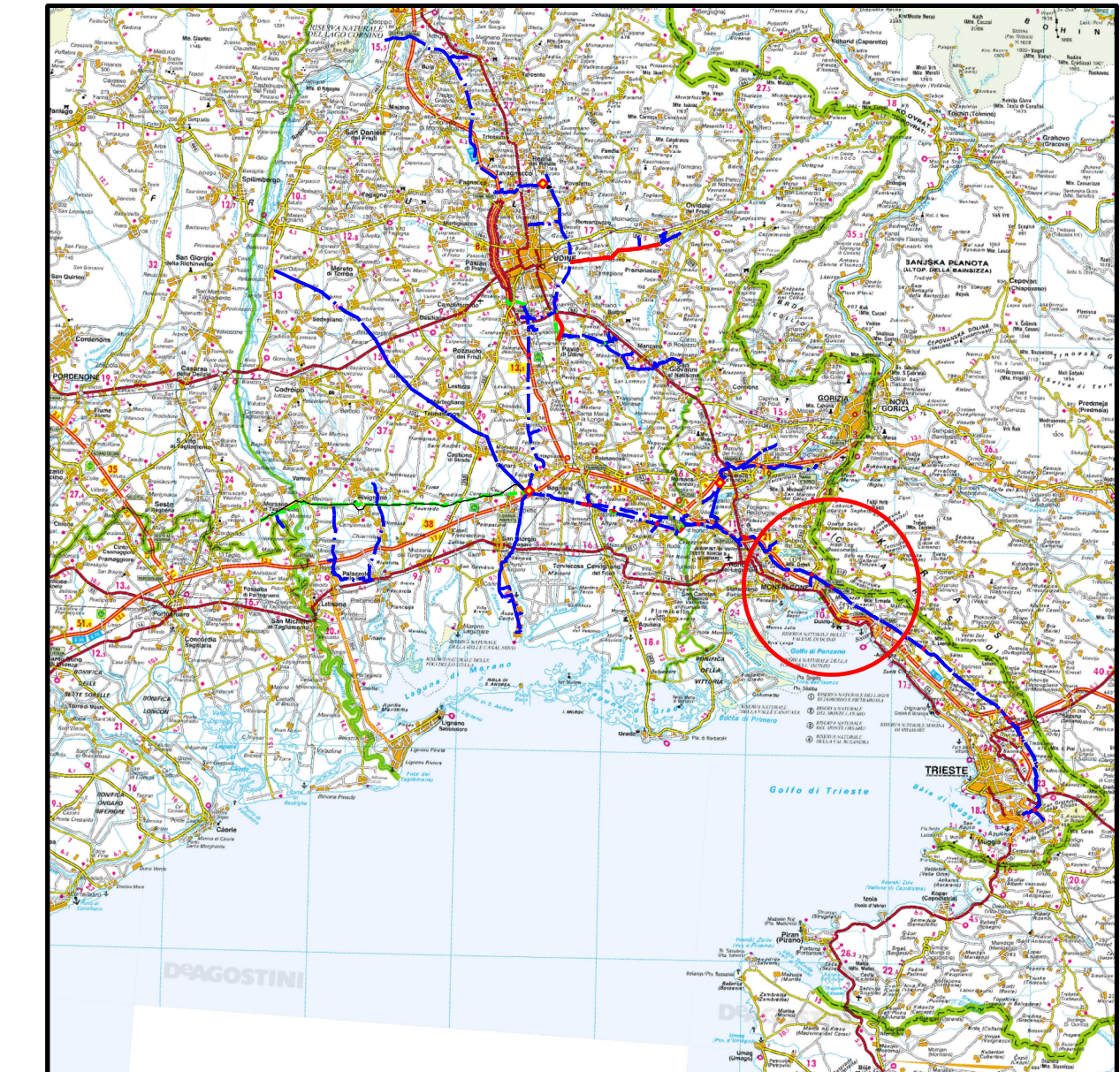
COROGRAFIA SCALA 1:600.000