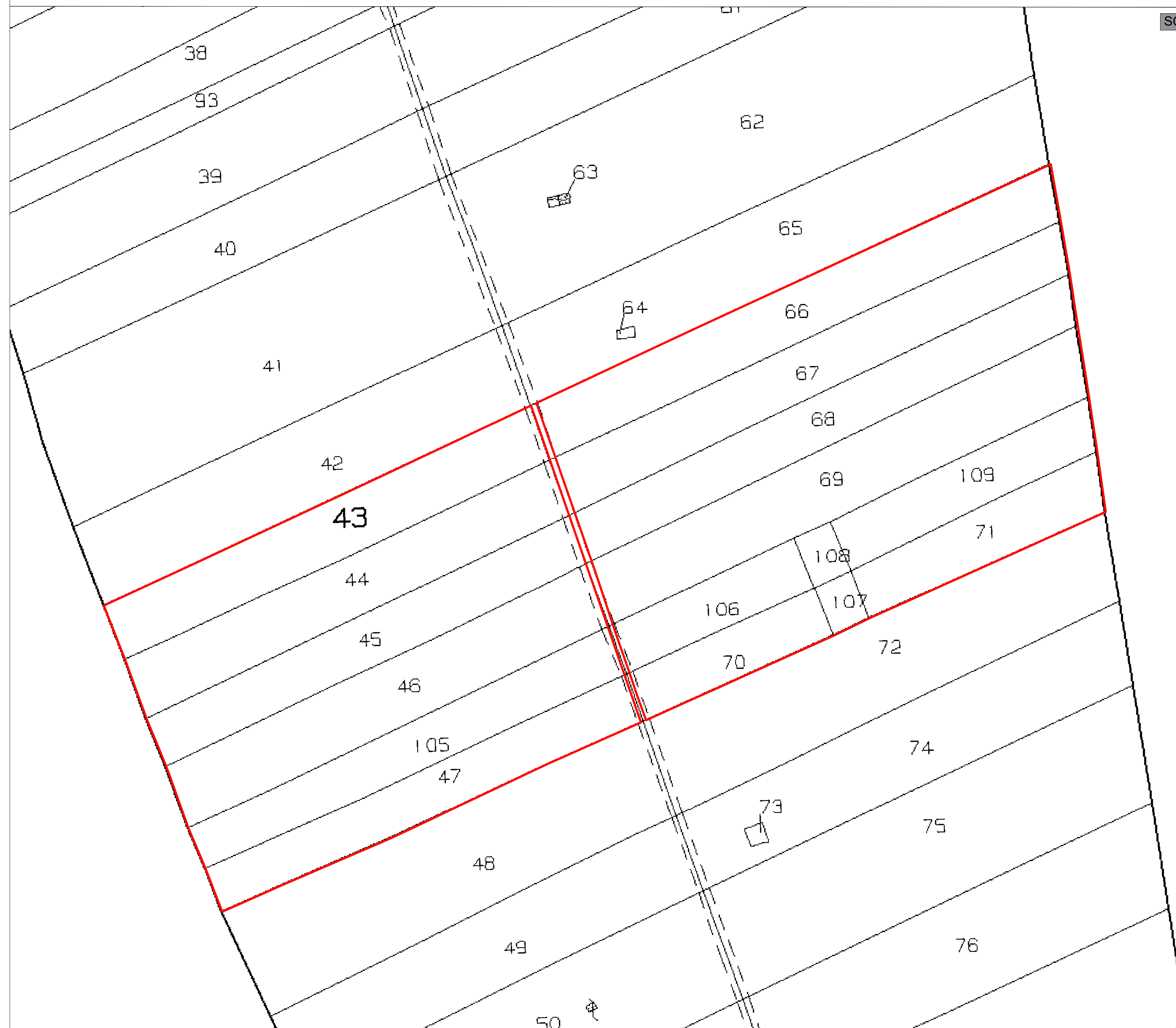
Planimetria Catastale area LP_4 (Fg. 122 Comune di Brindisi) - Stato di Progetto