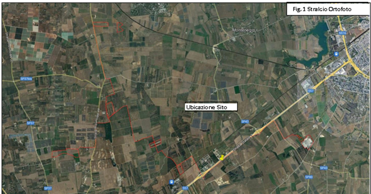
Fig. 1-inquadramento area parco fotovoltaico su ortofoto