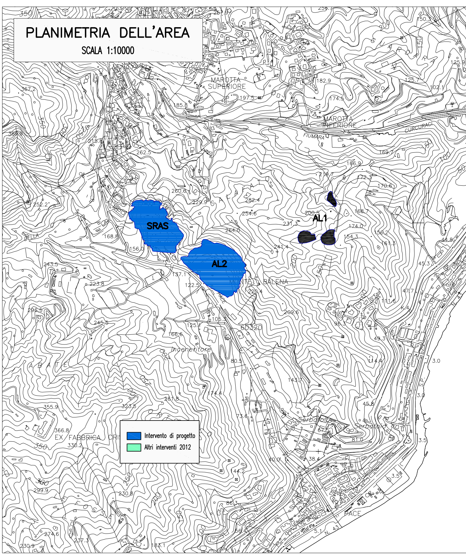
PLANIMETRIA DELLO STATO FINALE DEL PROGETTO DI ABBANCAMENTO SCALA 1:1000