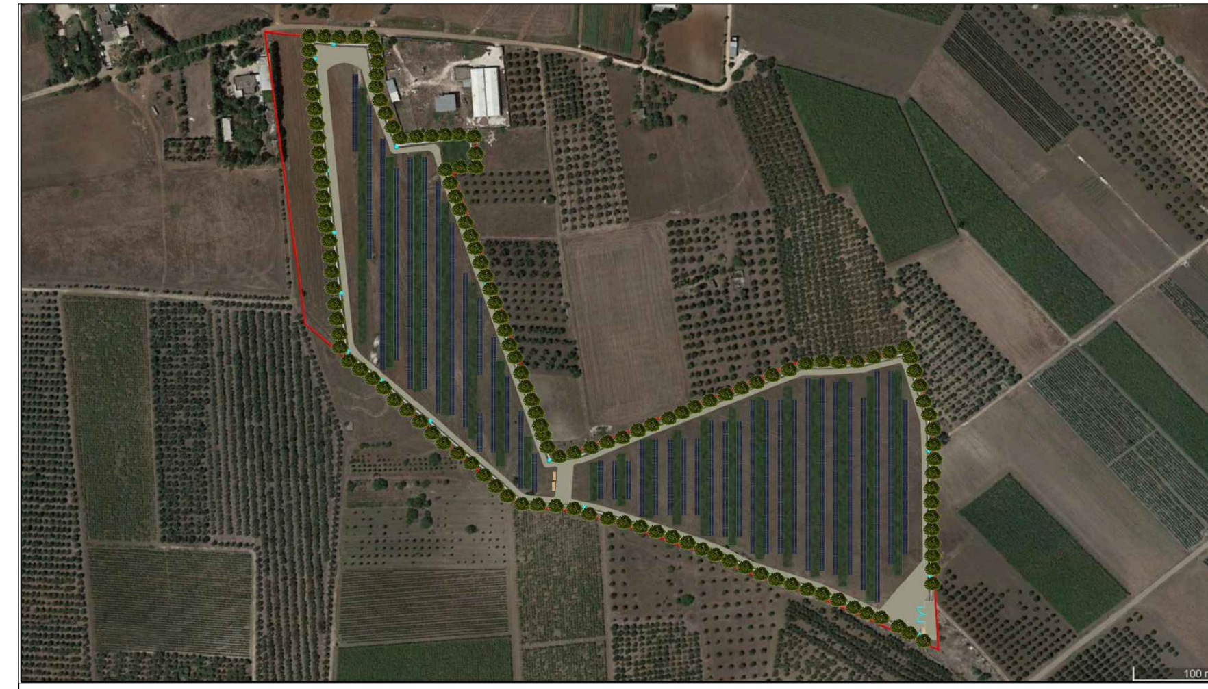
VISTA SUPERIORE - Mitigazione Presente