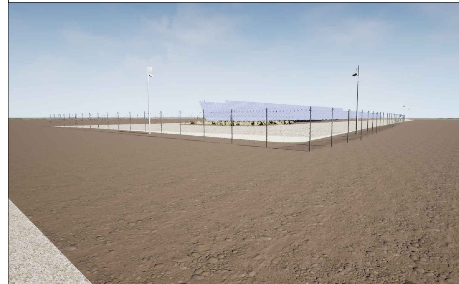
Vista 1 Post Operam - Mitigazione Assente