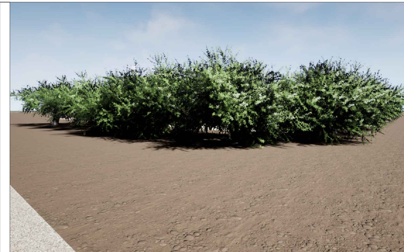
Vista 1 Post Operam - Mitigazione Presente