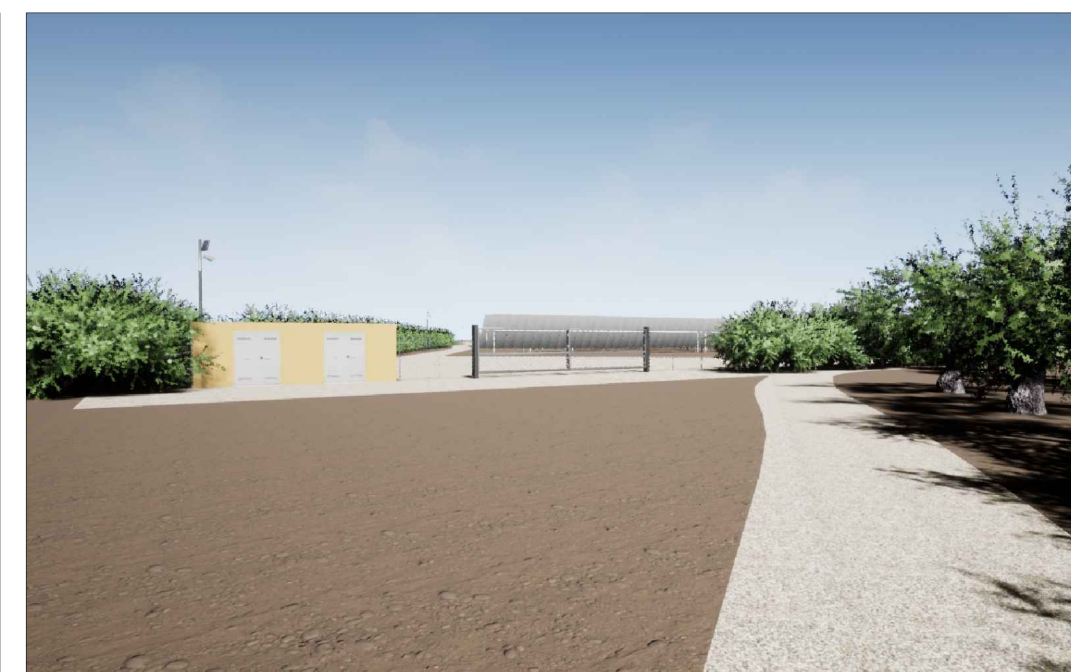
Vista 2 Post Operam - Mitigazione Presente