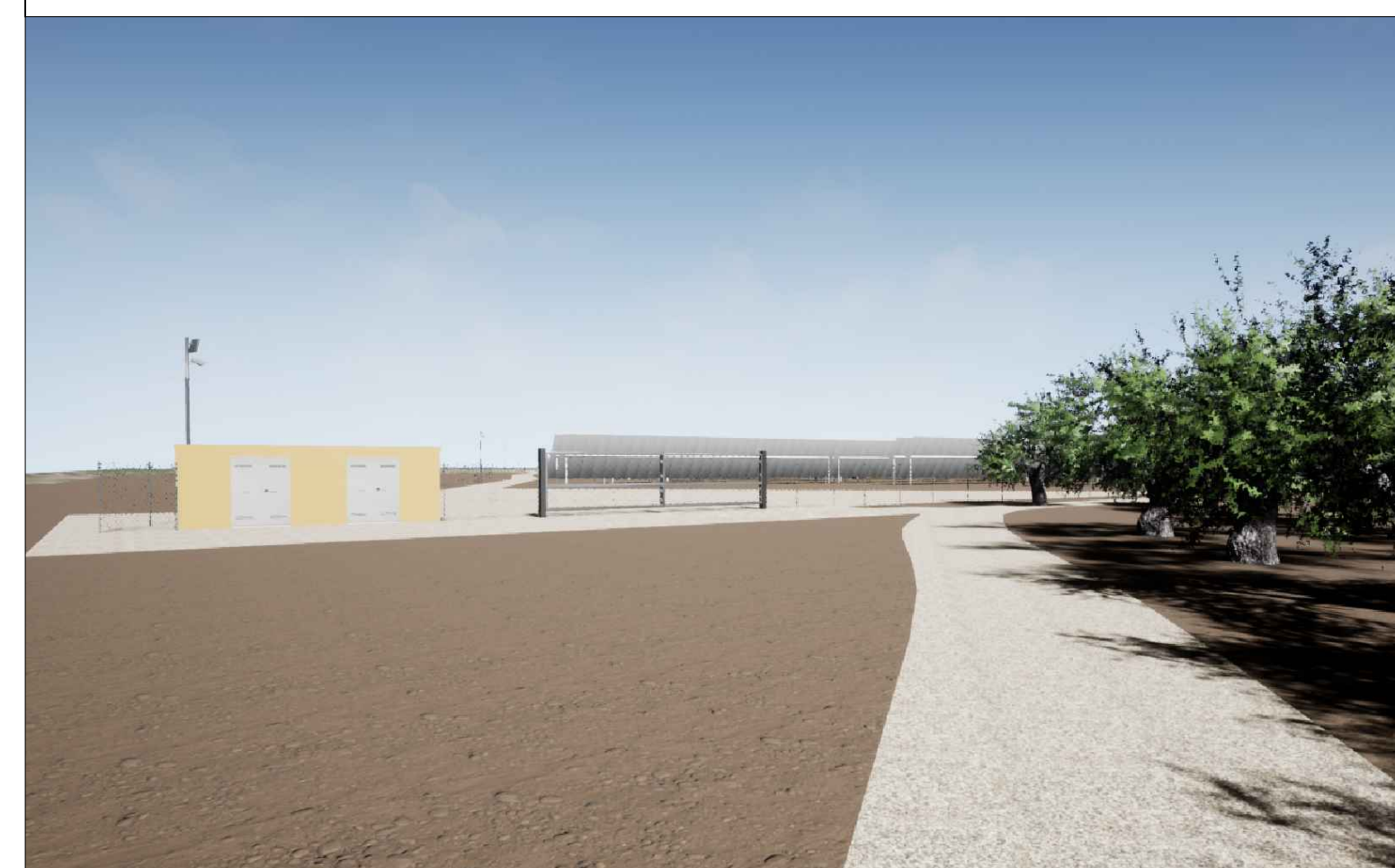
Vista 2 Post Operam - Mitigazione Assente