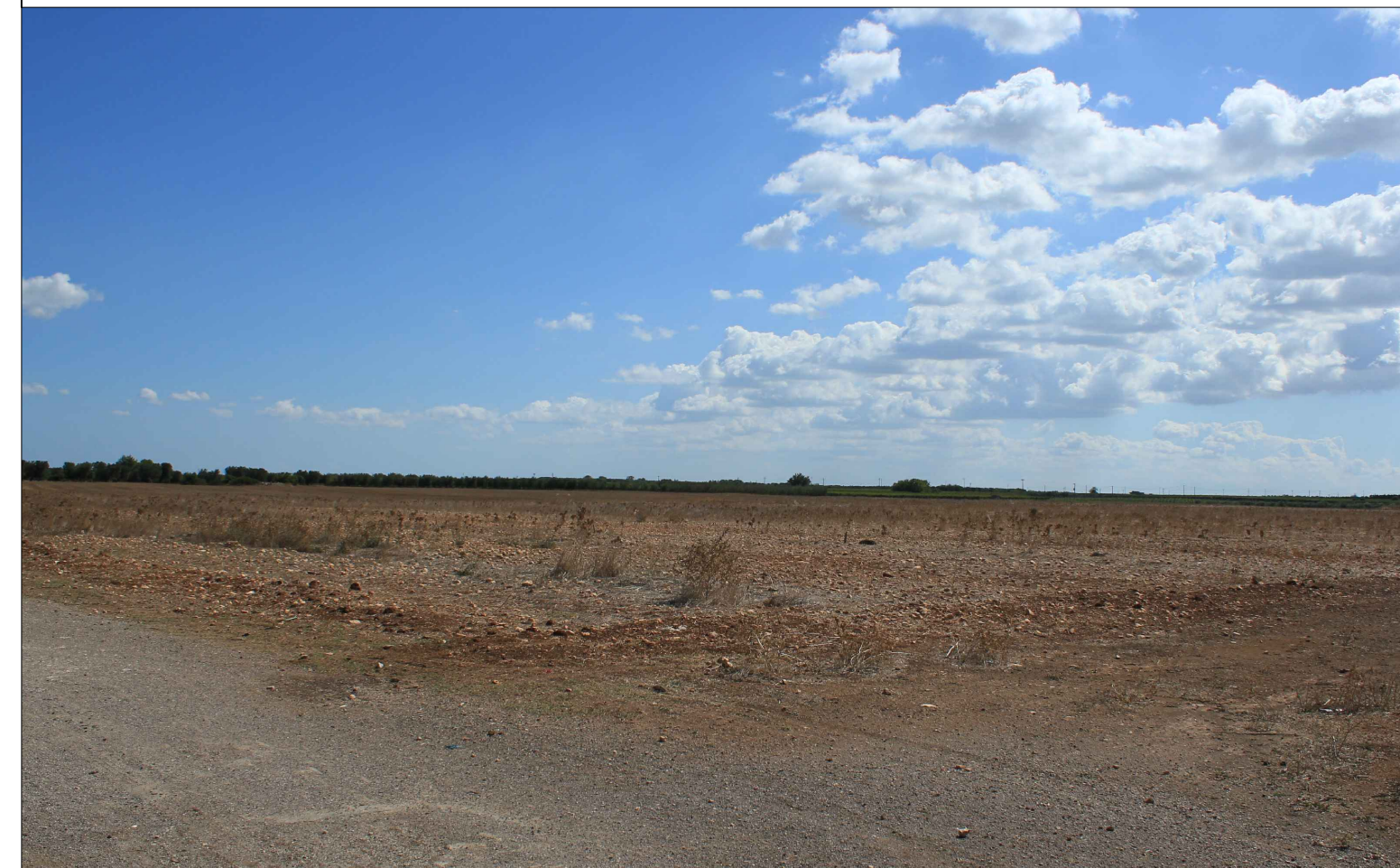
Vista 1 Ante Operam