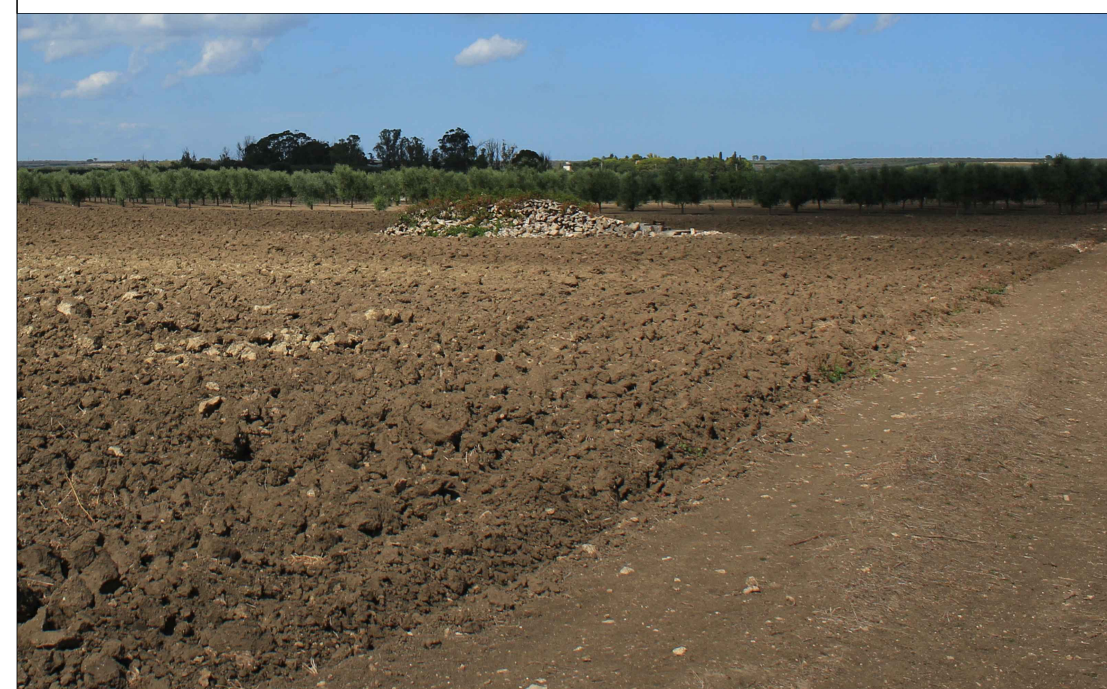
Vista 2 Ante Operam