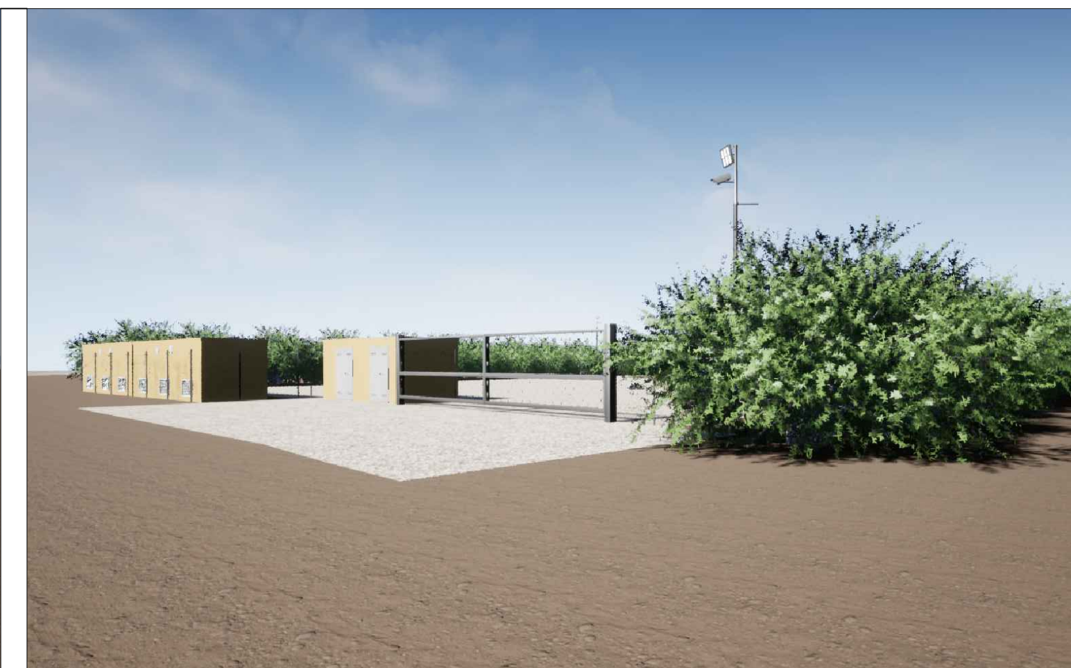
Vista 1 Post Operam - Mitigazione Presente