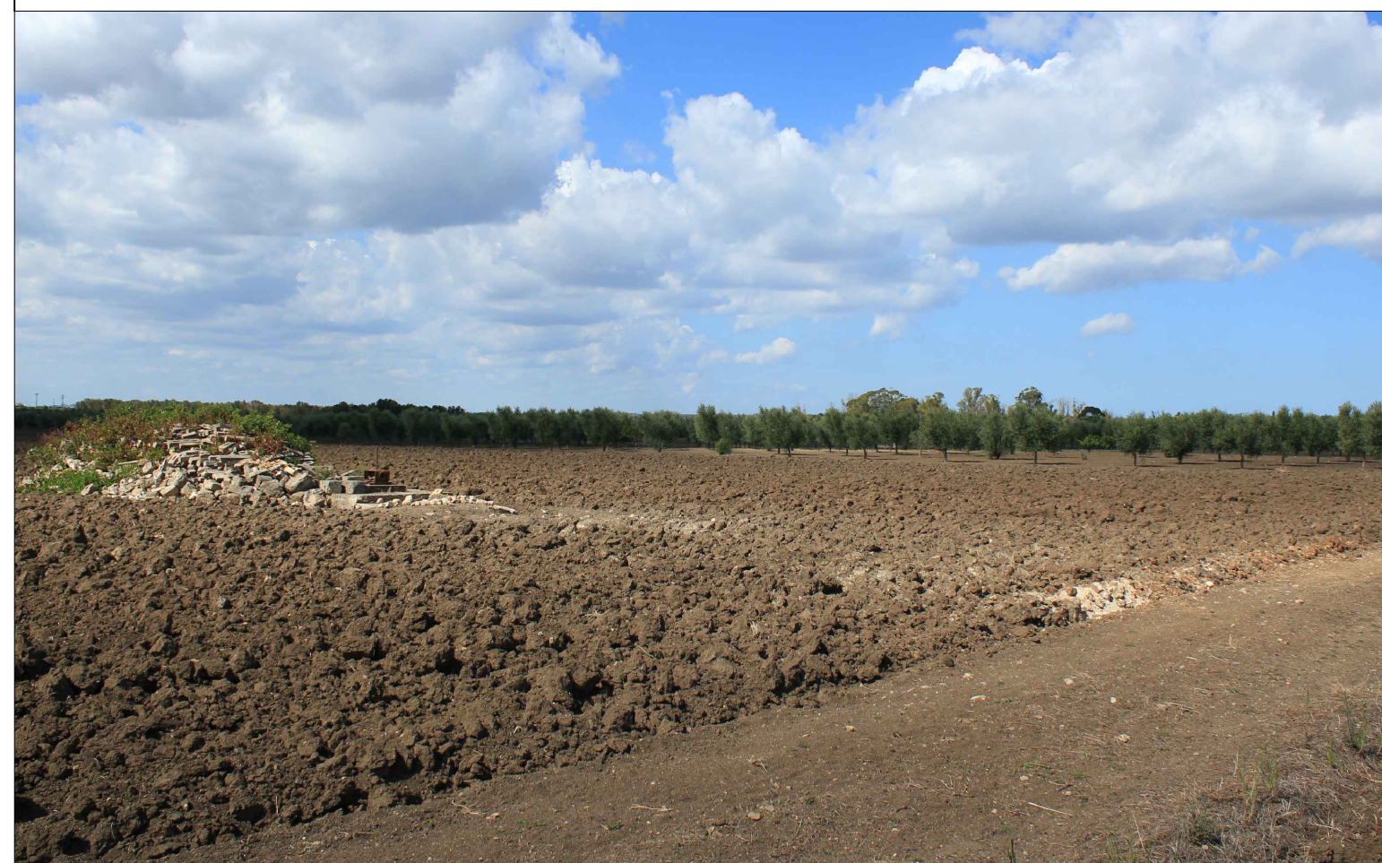
Vista 1 Ante Operam