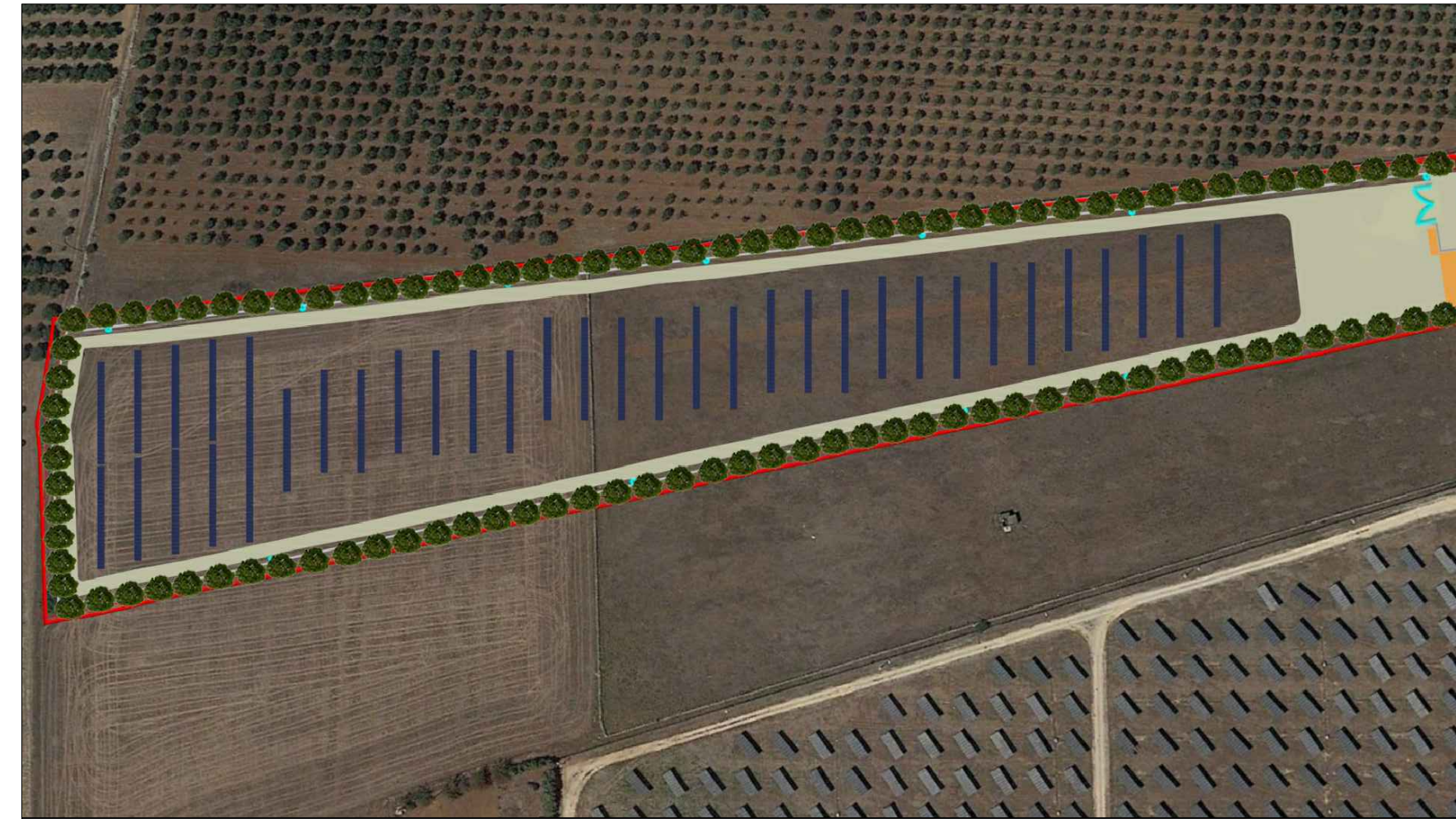
VISTA SUPERIORE - Mitigazione Presente