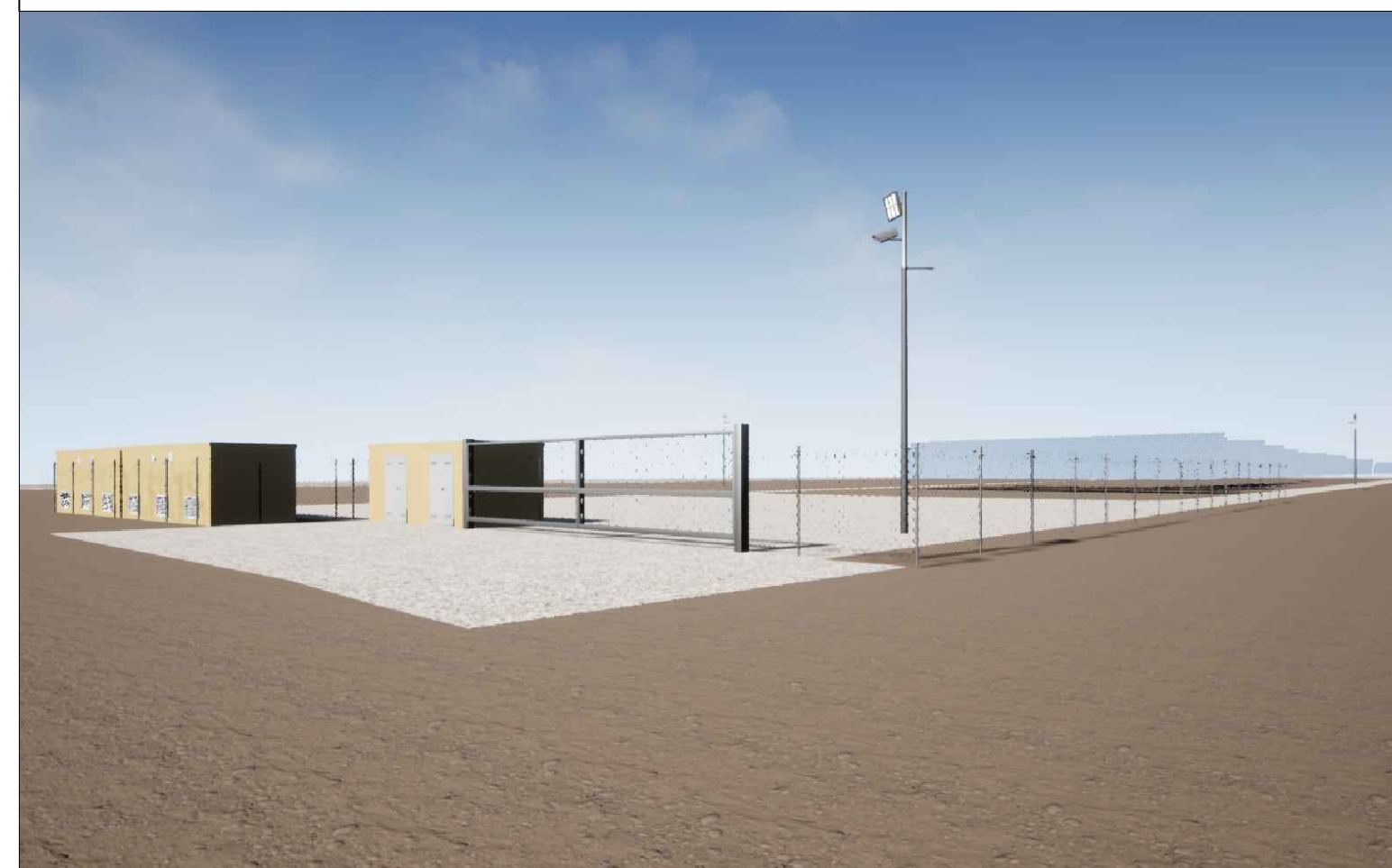
Vista 1 Post Operam - Mitigazione Assente