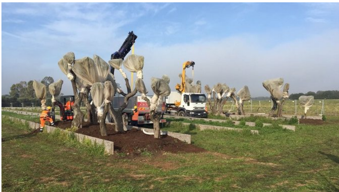
Ulivi espantati dal cantiere TAP e collocati nel sito di conservazione temporanea di Melendugno (LE)