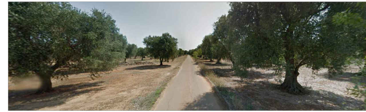
Punto di presa dalla via di accesso principale. Inquadratura 5