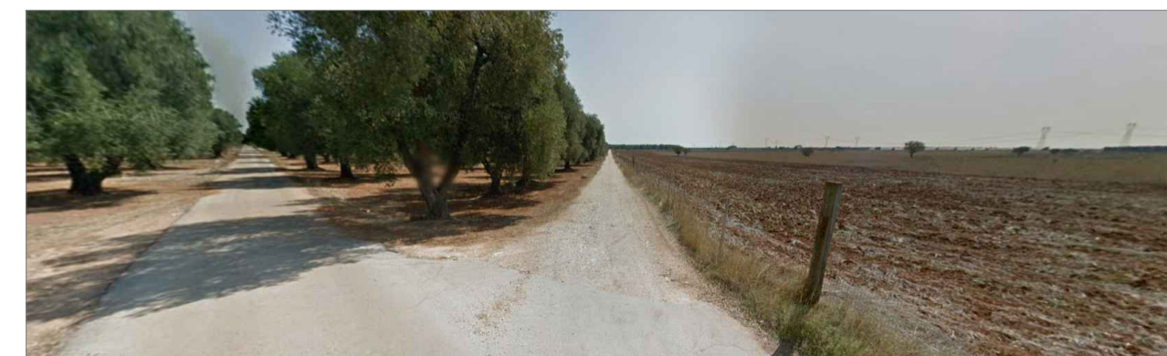
Punto di presa dalla via di accesso principale. Inquadratura 7