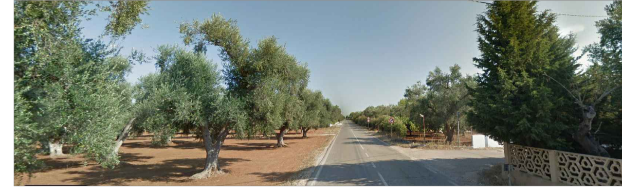
Punto di presa dalla via di accesso principale. Inquadratura 2