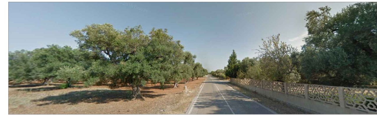
Punto di presa dalla via di accesso principale. Inquadratura 1