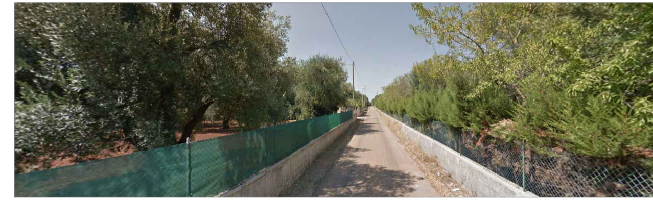
Punto di presa dalla via di accesso principale. Inquadratura 3