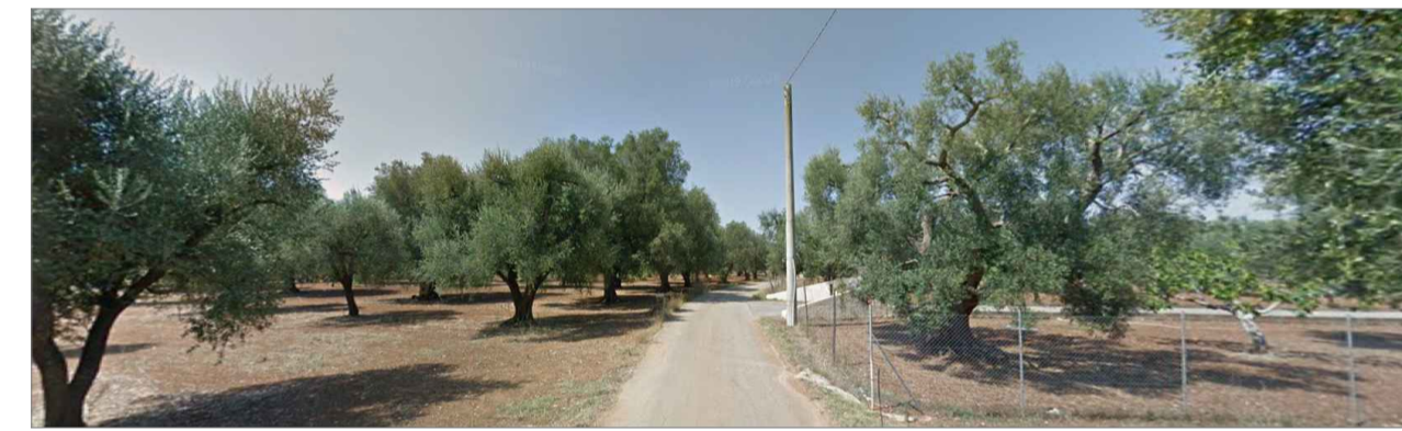
Punto di presa dalla via di accesso principale. Inquadratura 4