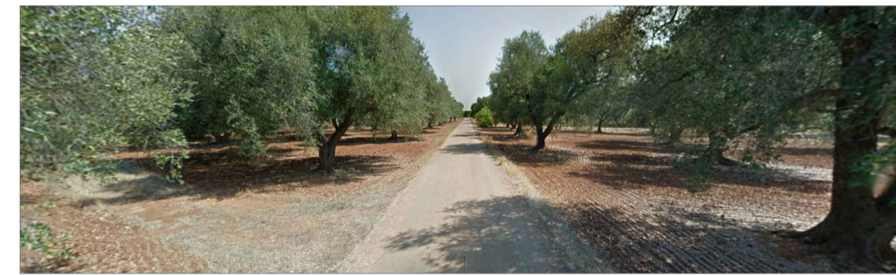
Punto di presa dalla via di accesso principale. Inquadratura 6