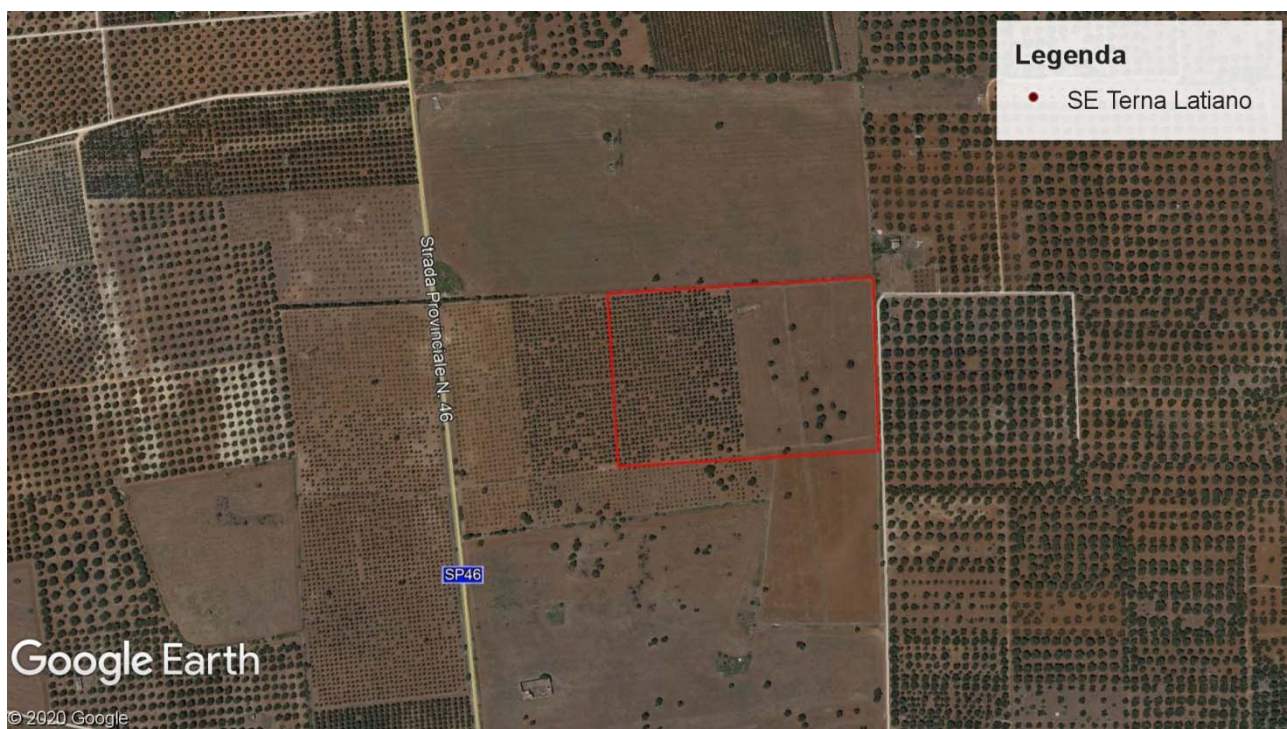
Inquadramento generale su Ortofoto