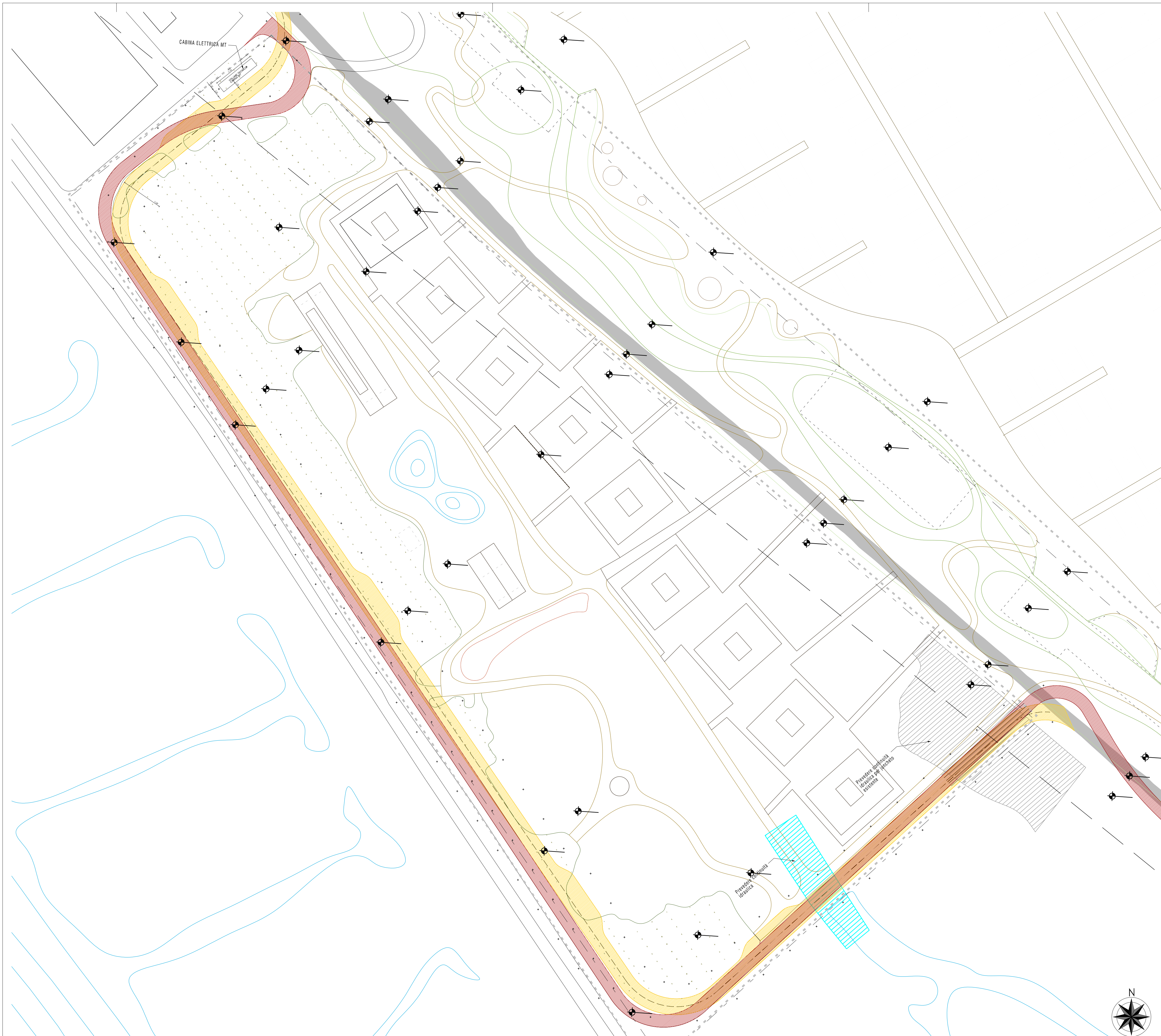
Planimetria del tracciato della strada - comparativa - SCALA 1:500