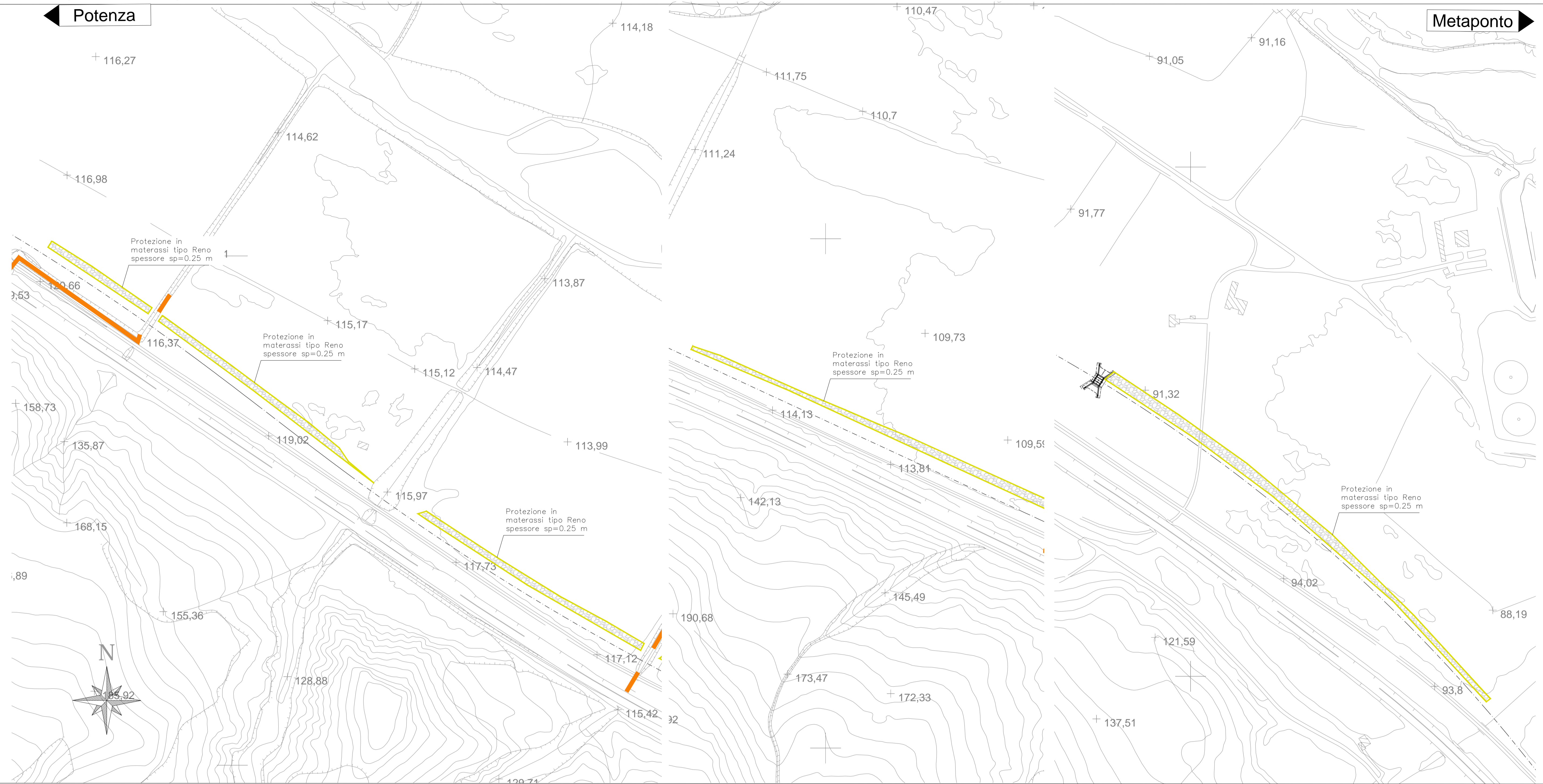
Particolare posa materassi tipo reno