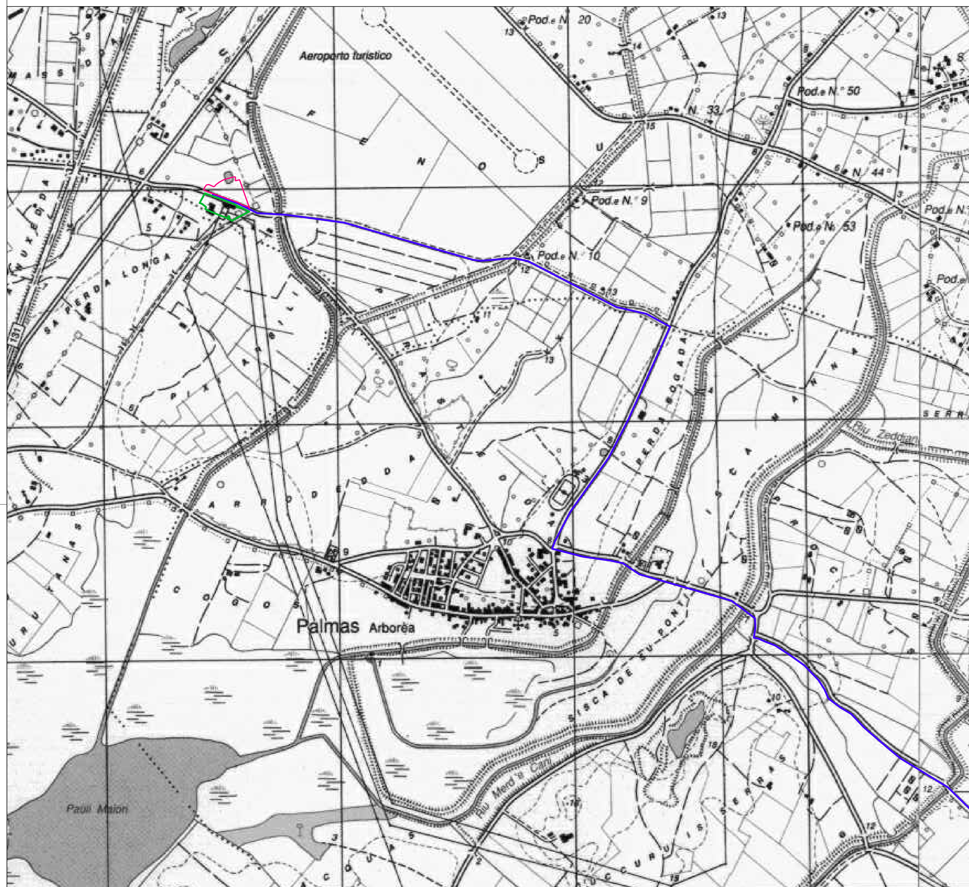
IGM FOGLIO N° 528 SEZ. II ORISTANO SUD 1.25000