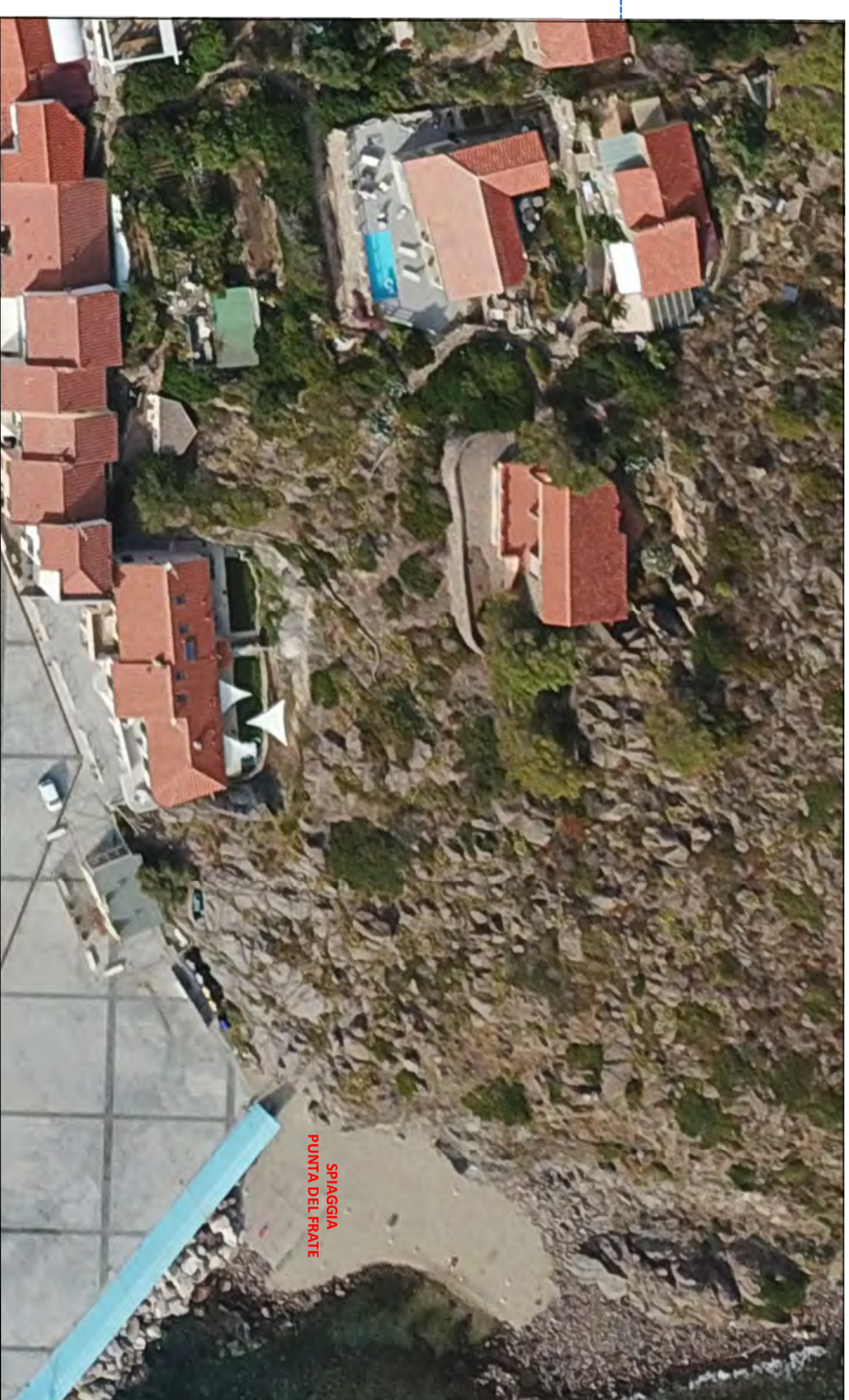
VISTA AEREA SPIAGGIA PUNTA DEL FRATE