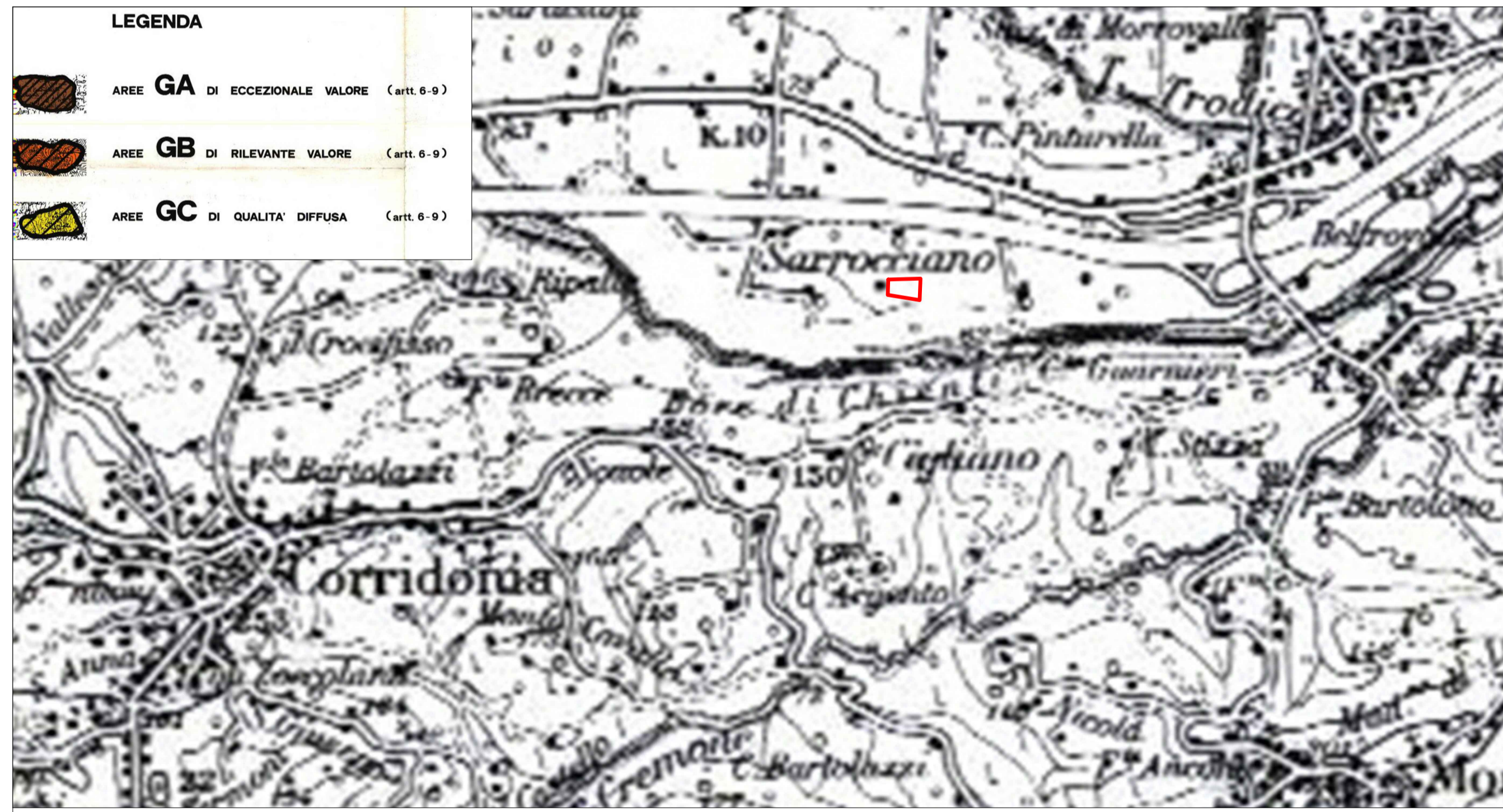
Tav.3) P.P.A.R. vigente, Regione Marche - Sottosistema geologico e geomorfologico: Sottosistemi tematici relativi al valore paesaggistico delle aree