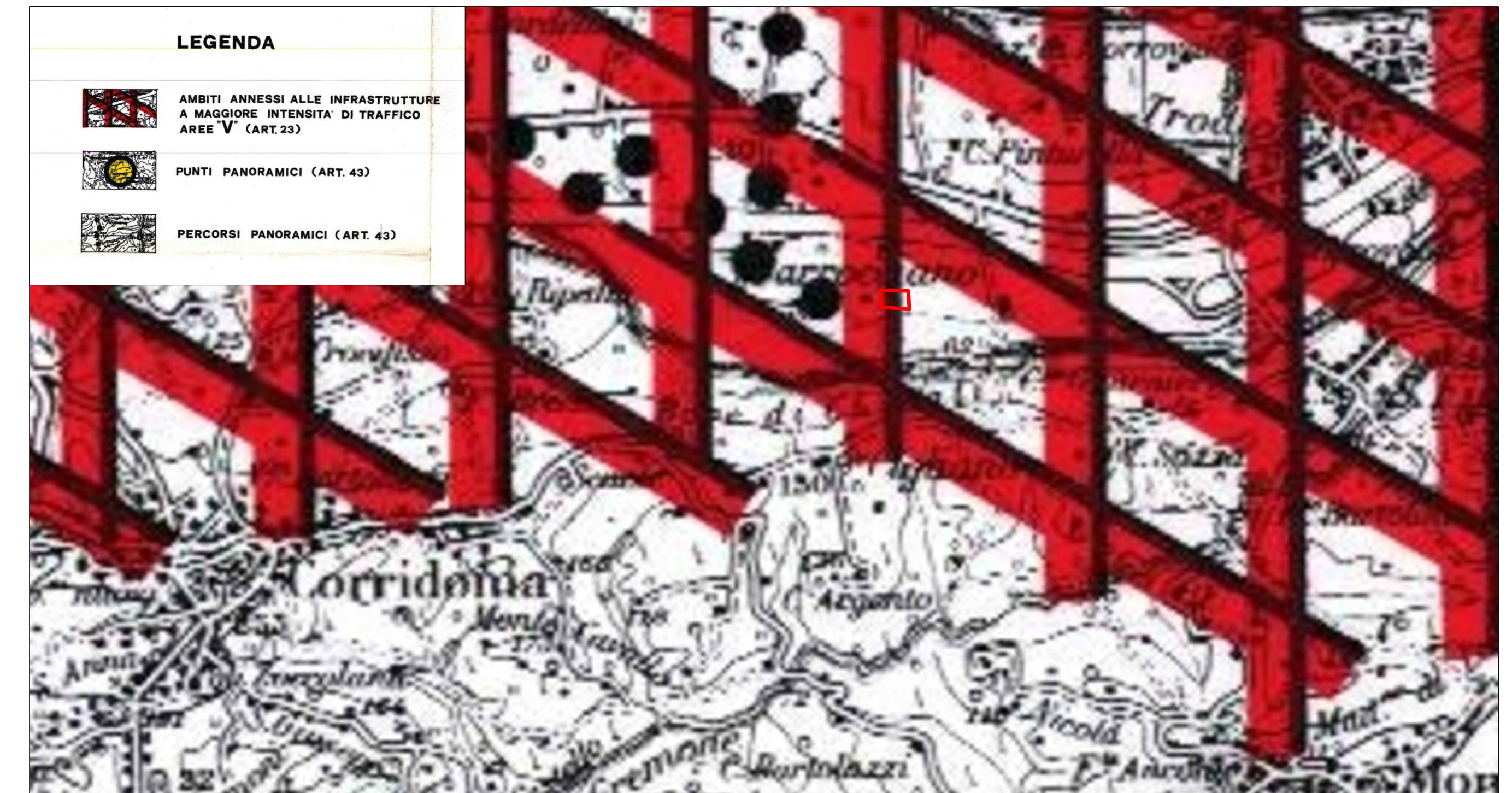
Tav.7) P.P.A.R. vigente, Regione Marche - Sottosistema territoriale generale: Aree di alta percezione visiva (art. 43, Ambiti annessi alle infrastrutture a maggiore intensità di traffico - aree "V")