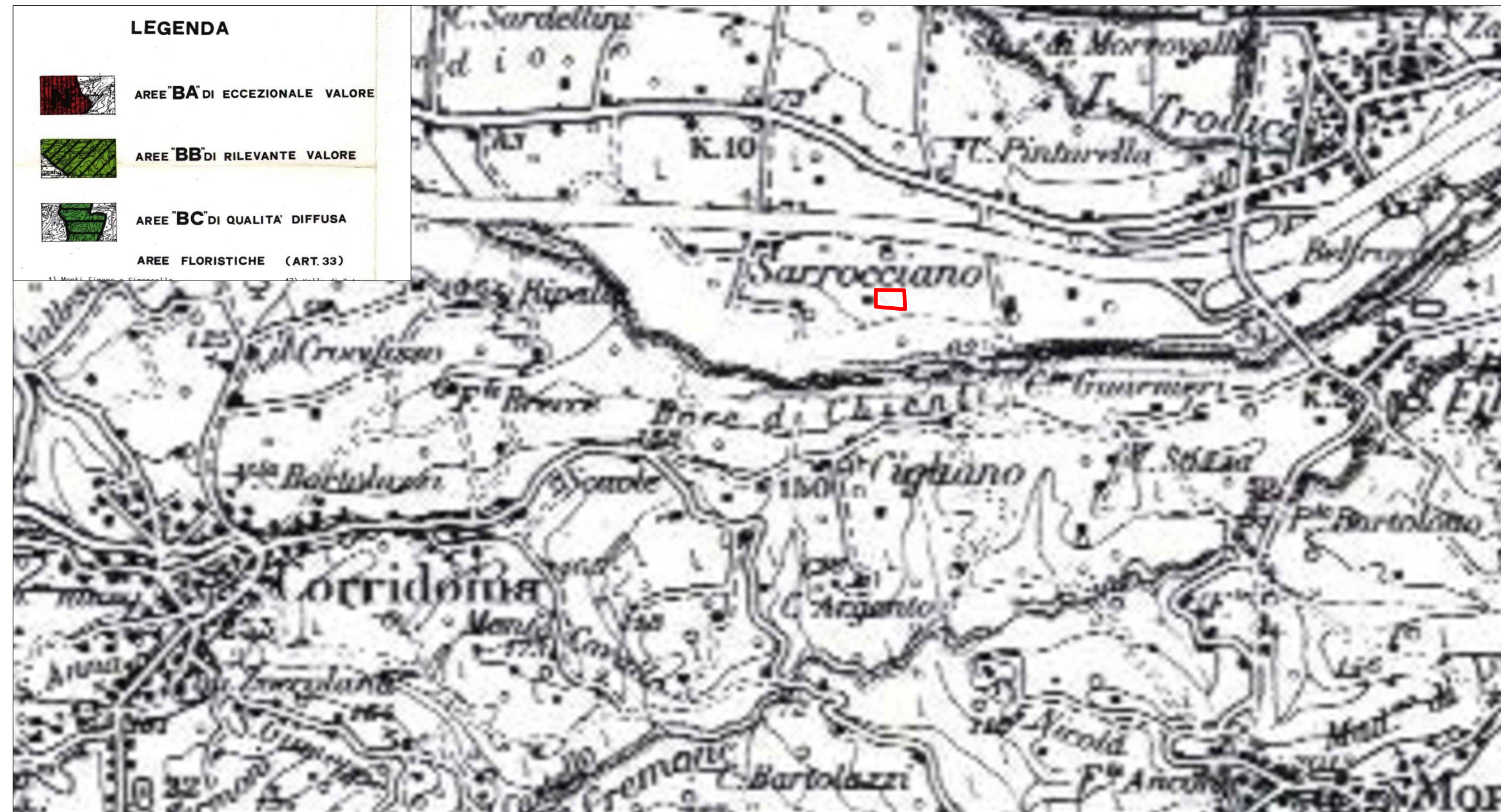
Tav.4) P.P.A.R. vigente, Regione Marche - Sottosistema botanico - vegetazionale: Sottosistemi tematici ed elementi costitutivi del sottosistema botanico-vegetazionale