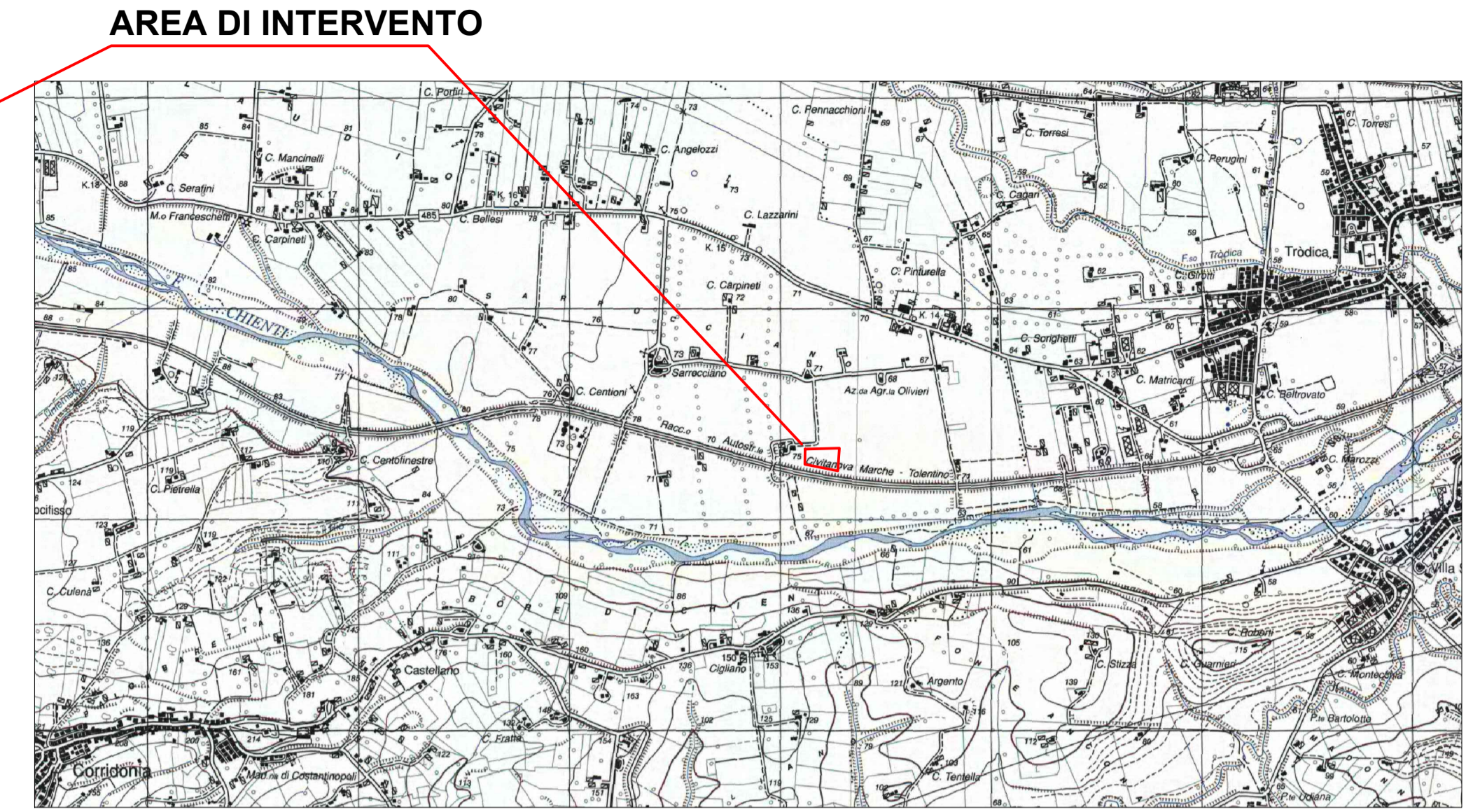
Stralcio CARTA TOPOGRAFICA IGM SCALA 1:25.000 - F° 125 IV N.O. MACERATA Est