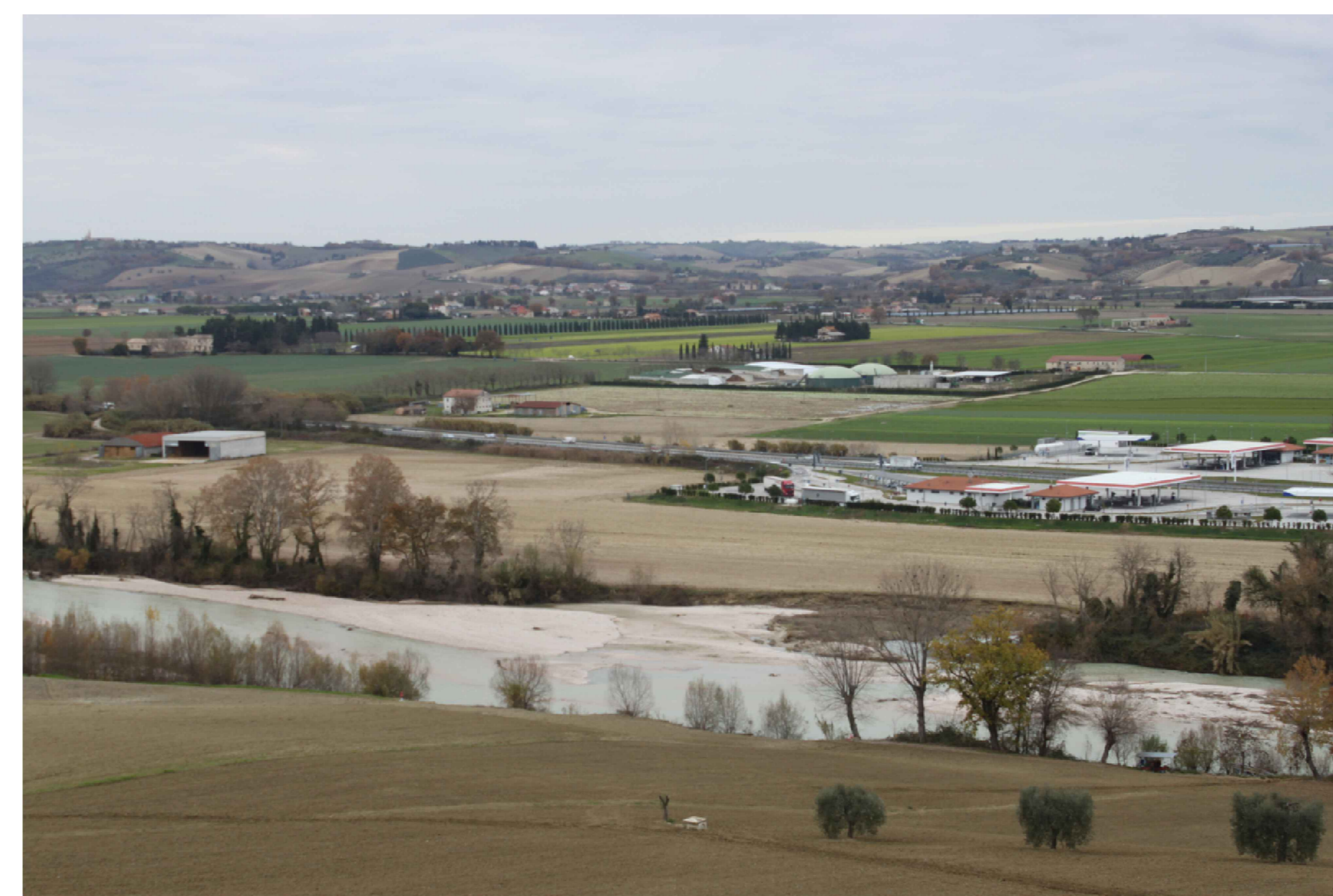
Punto di ripresa P.05