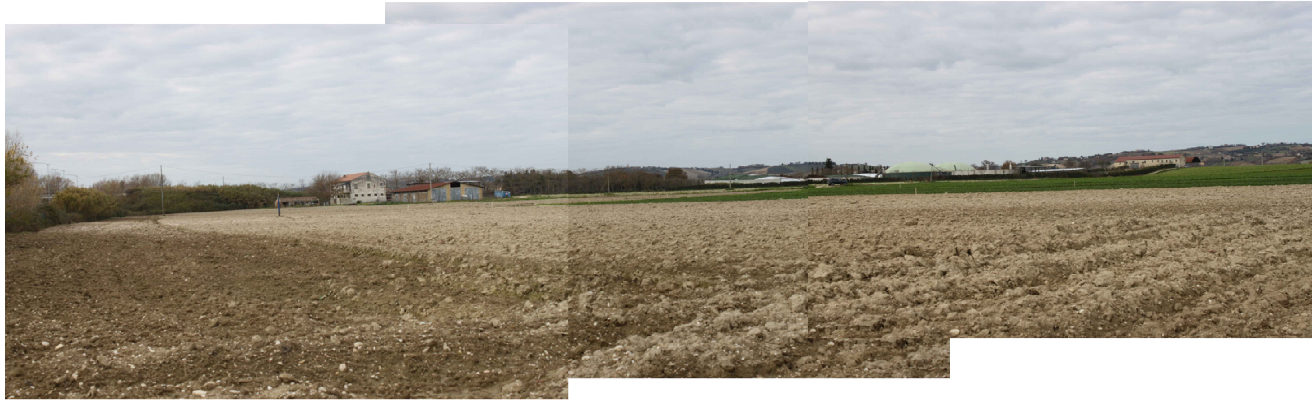
Punto di ripresa P.01