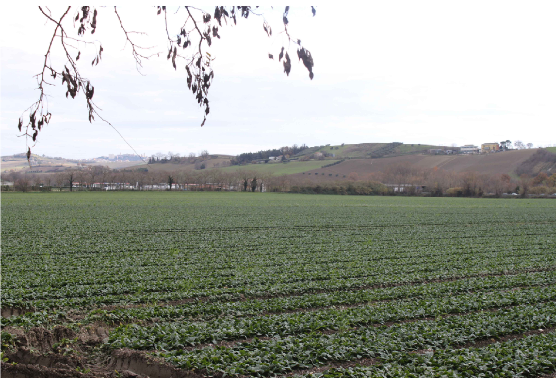
Punto di ripresa P.03