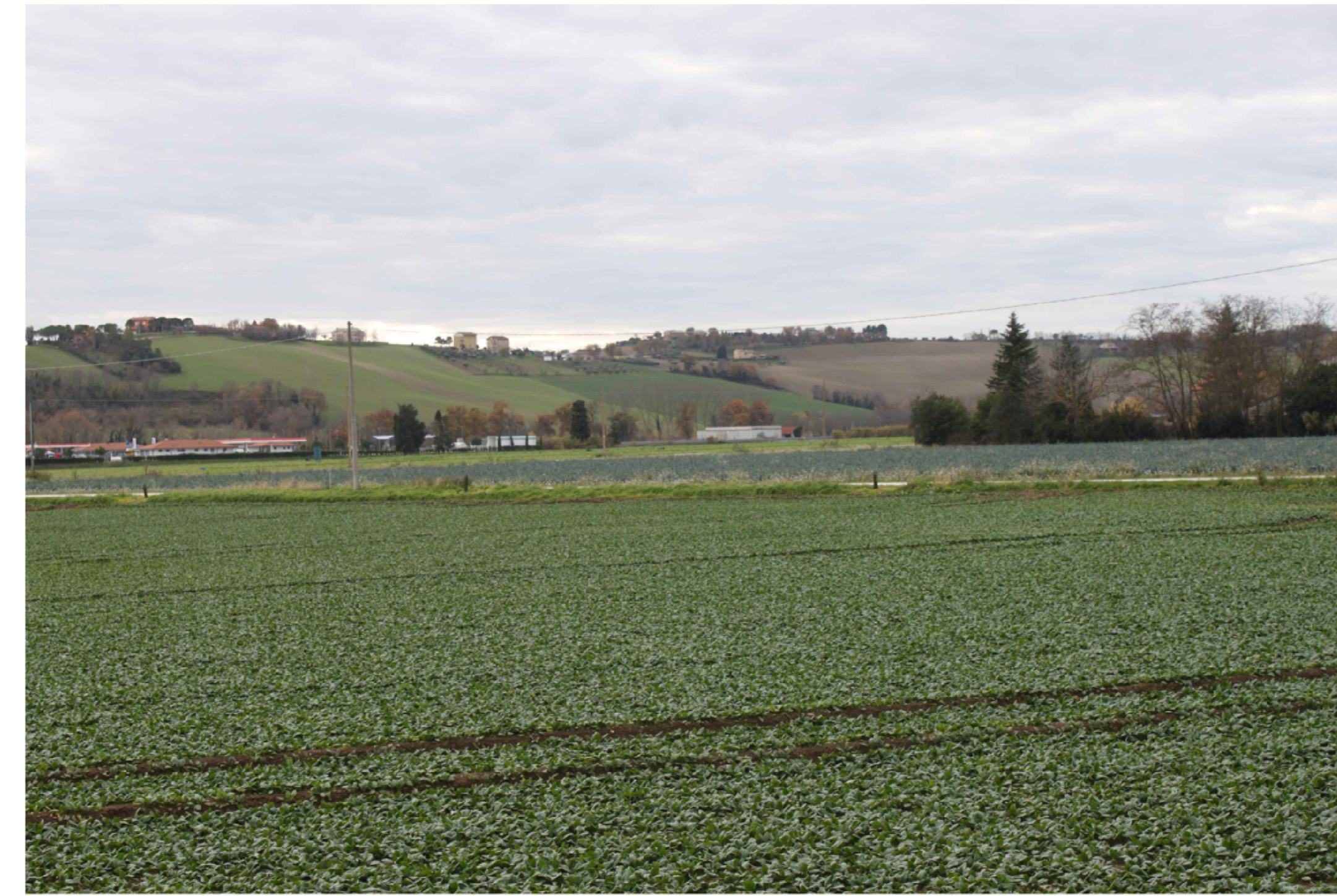
Punto di ripresa P.02