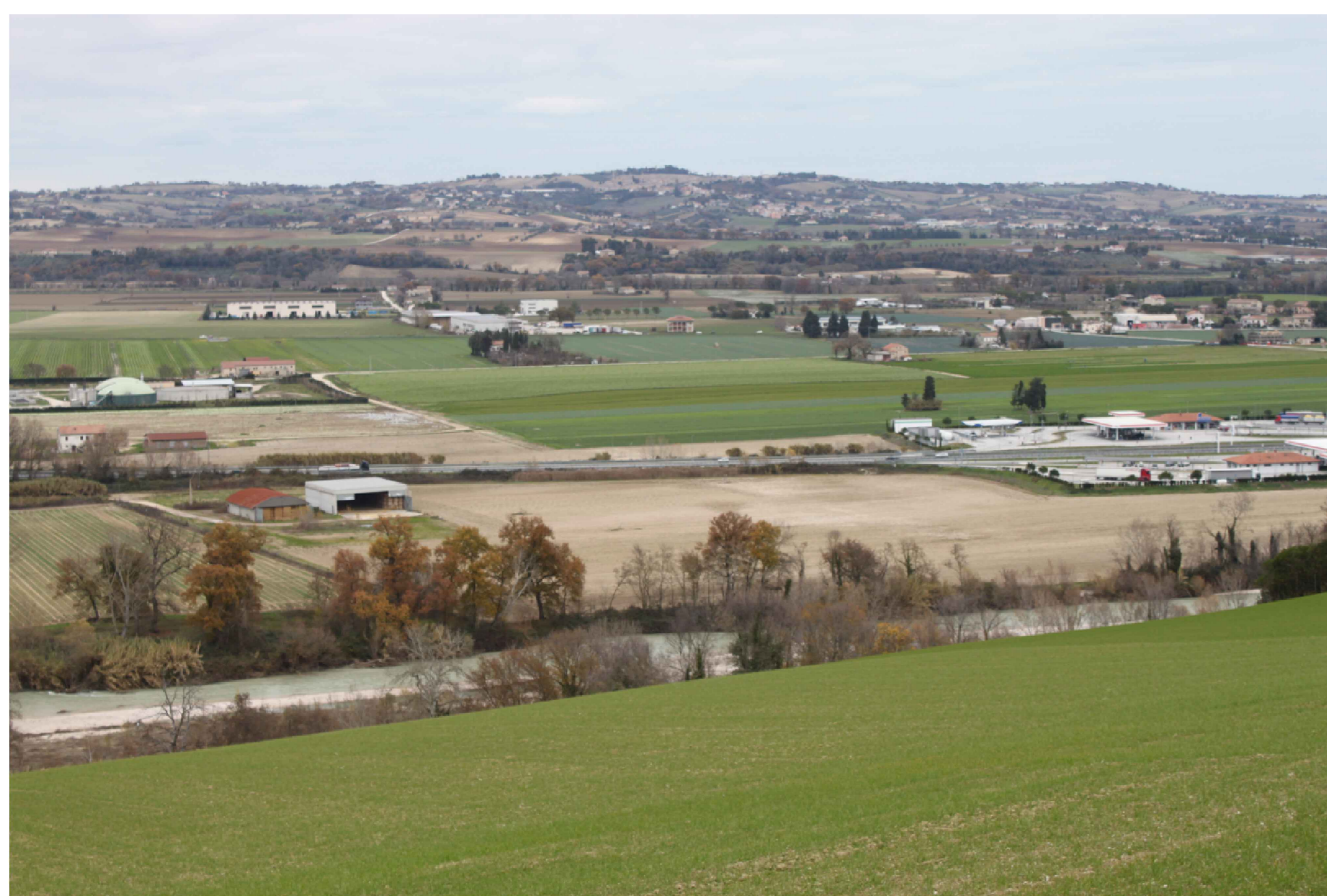
Punto di ripresa P.04