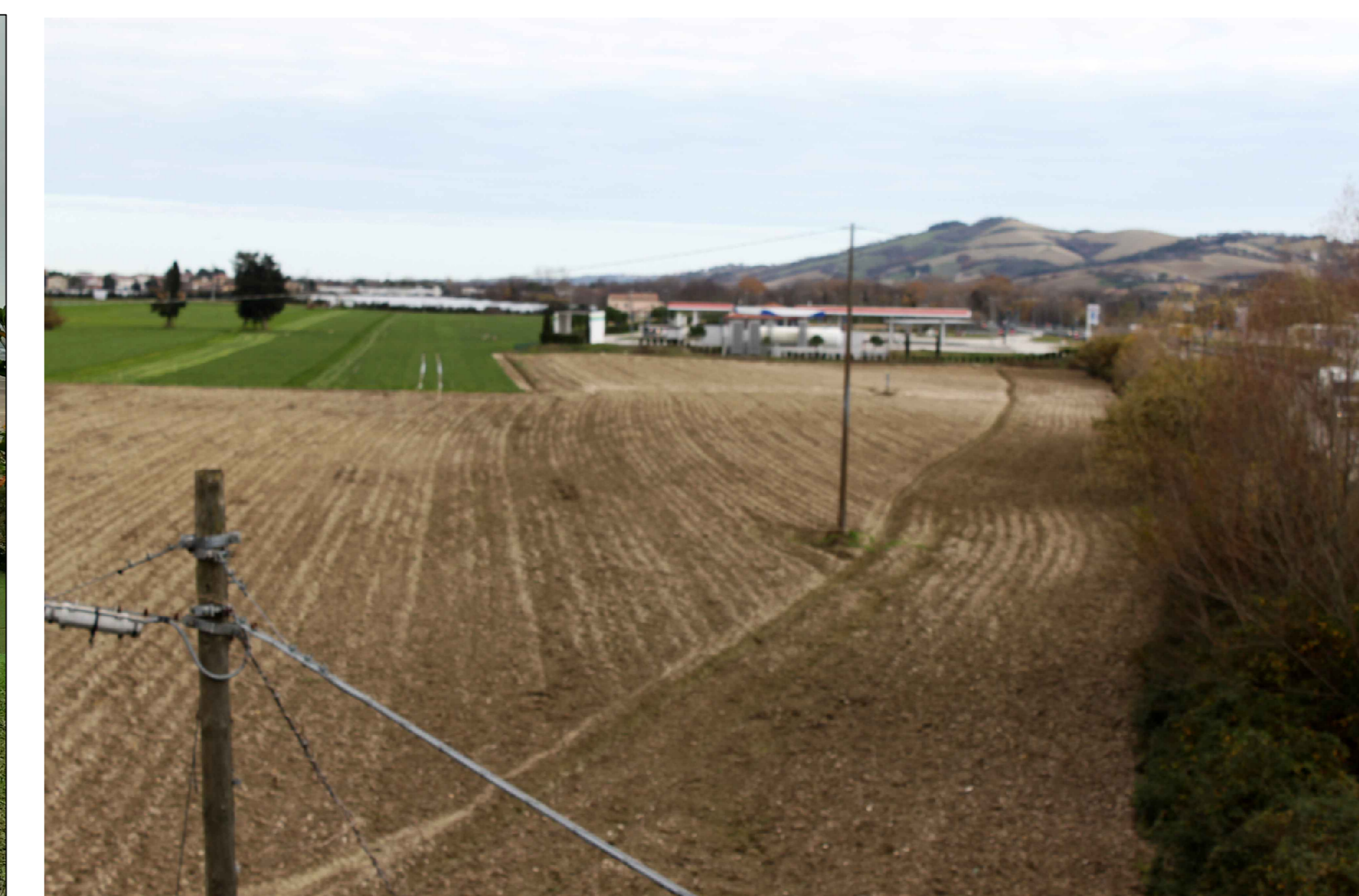
Punto di ripresa P.07