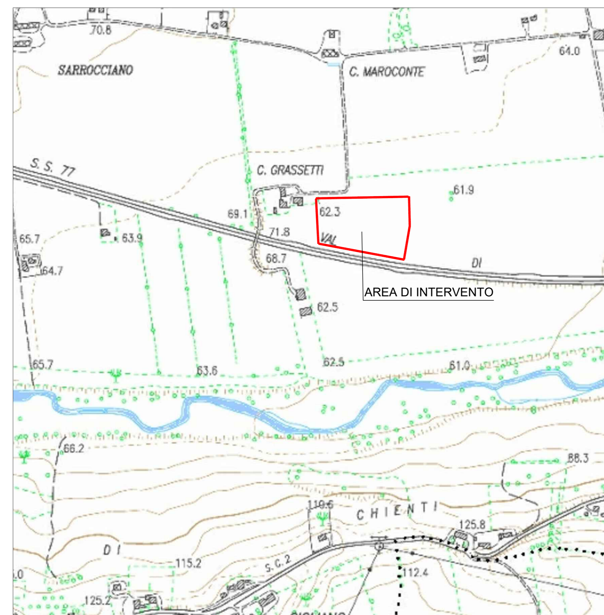
STRALCIO IN SCALA 1:5.000