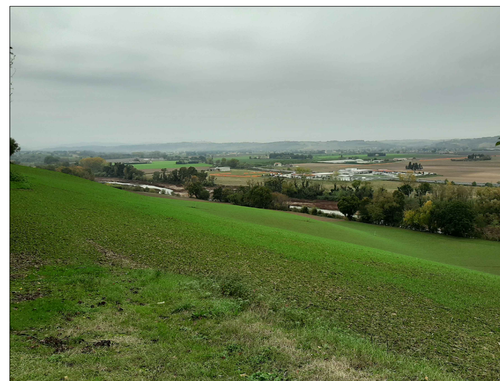
Punto di ripresa P.06