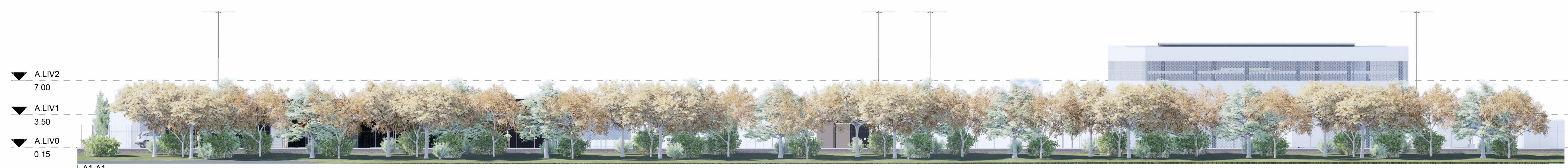
A1-A1 Scala 1 : 200