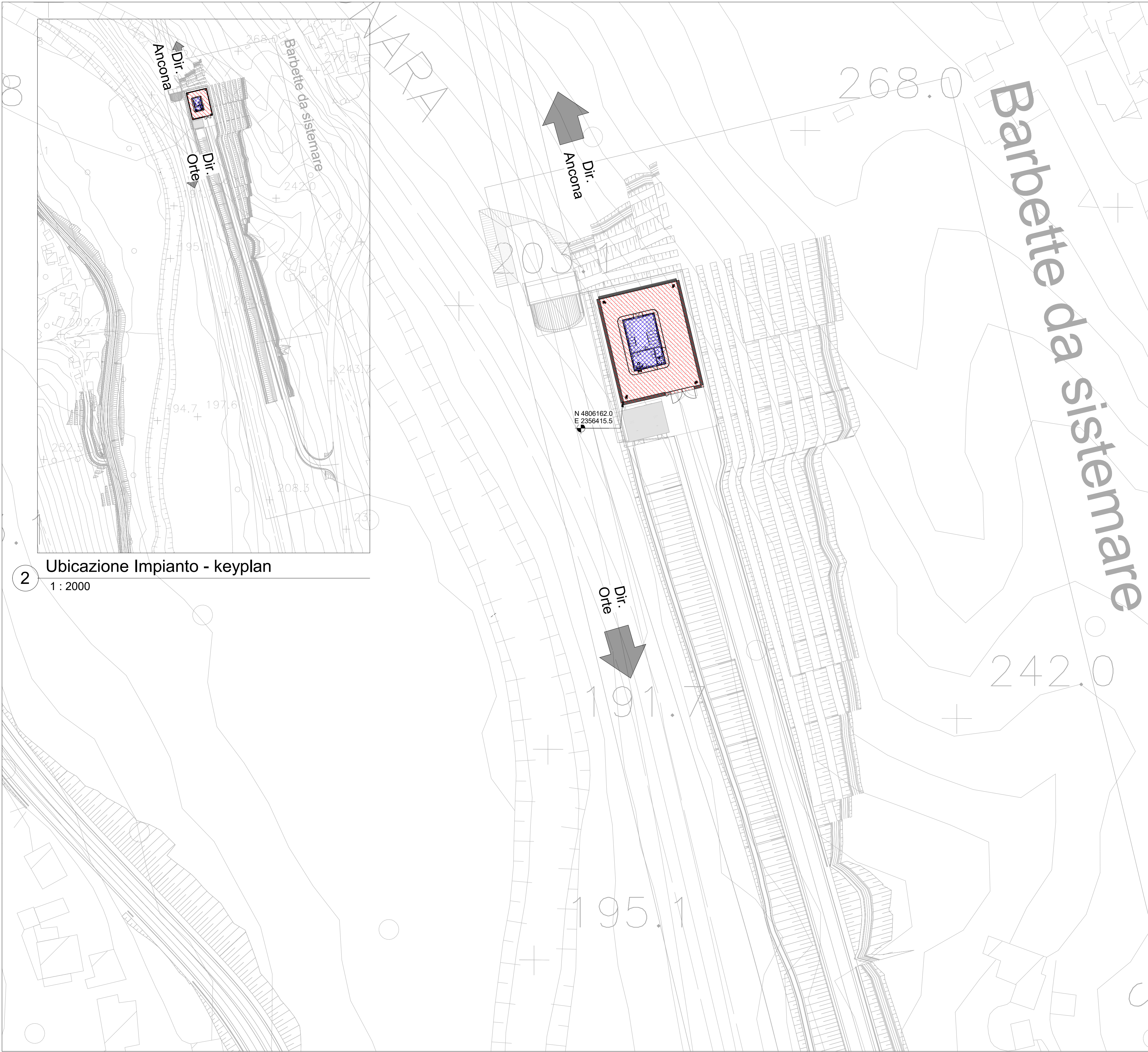
2 Ubicazione Impianto - keyplan 1 : 2000