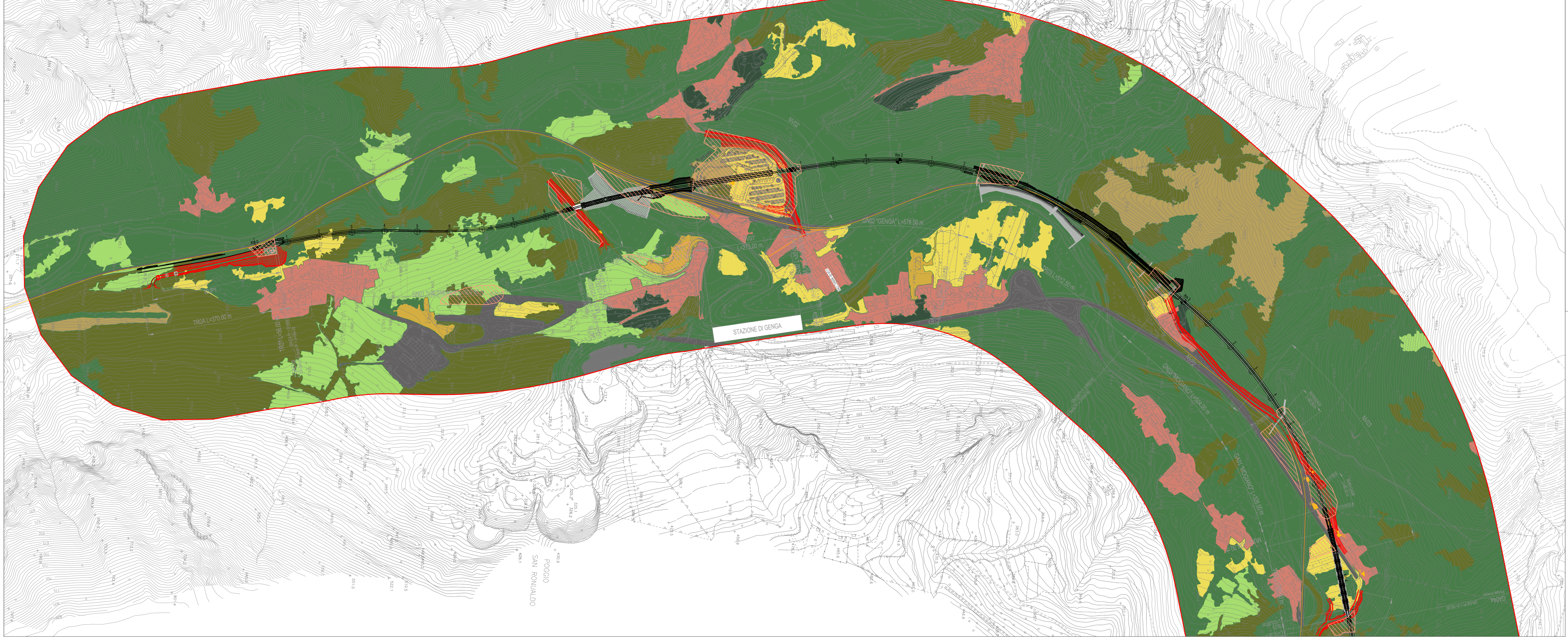
TRATTO A - CARTA DELL'USO DEL SUOLO