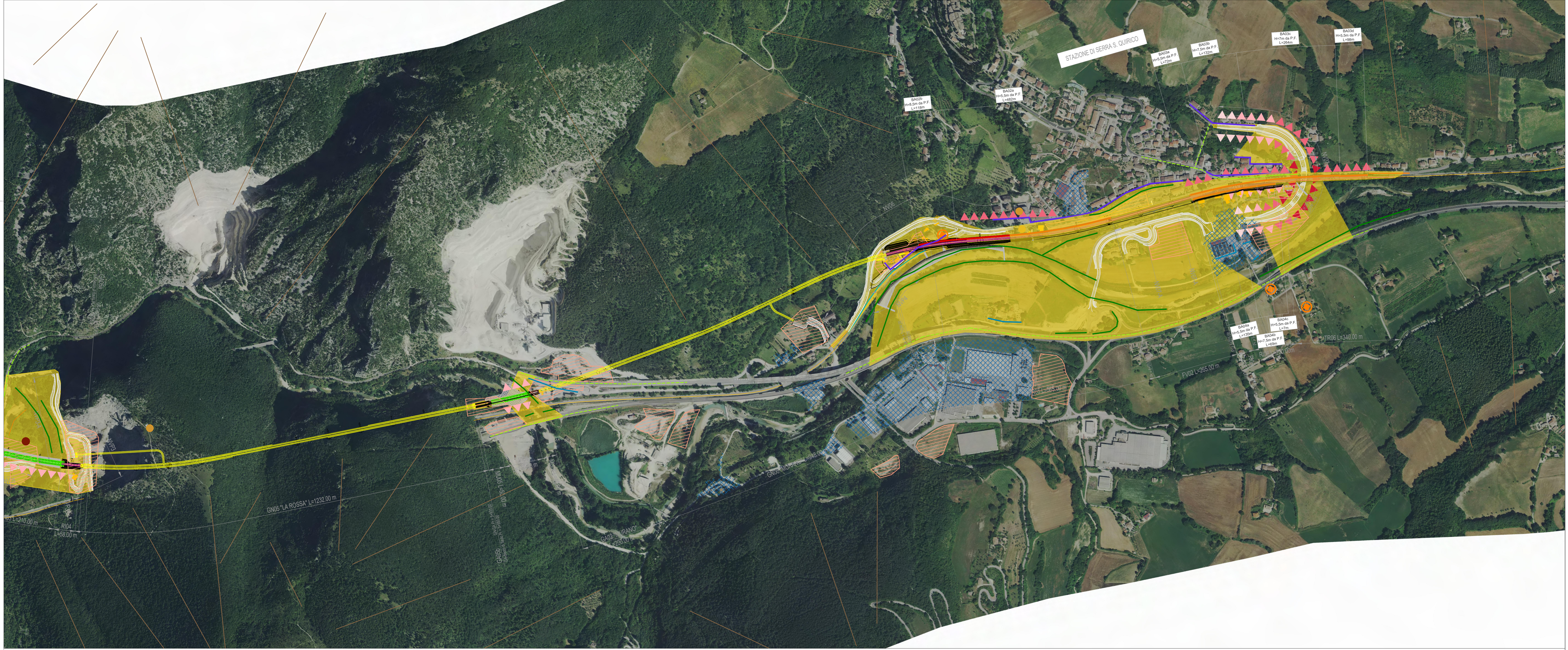
TRATTO B - CARTA DELLA VISUALITA'