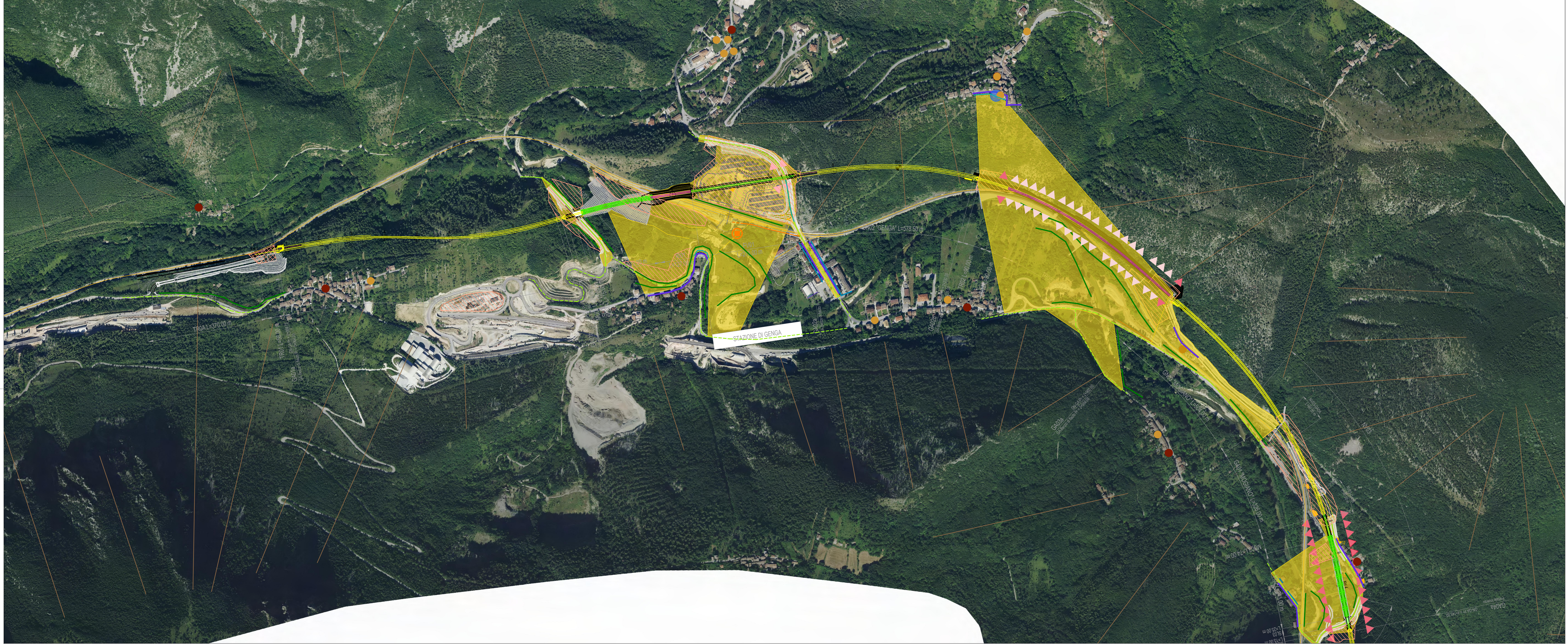
TRATTO A - CARTA DELLA VISUALITA'