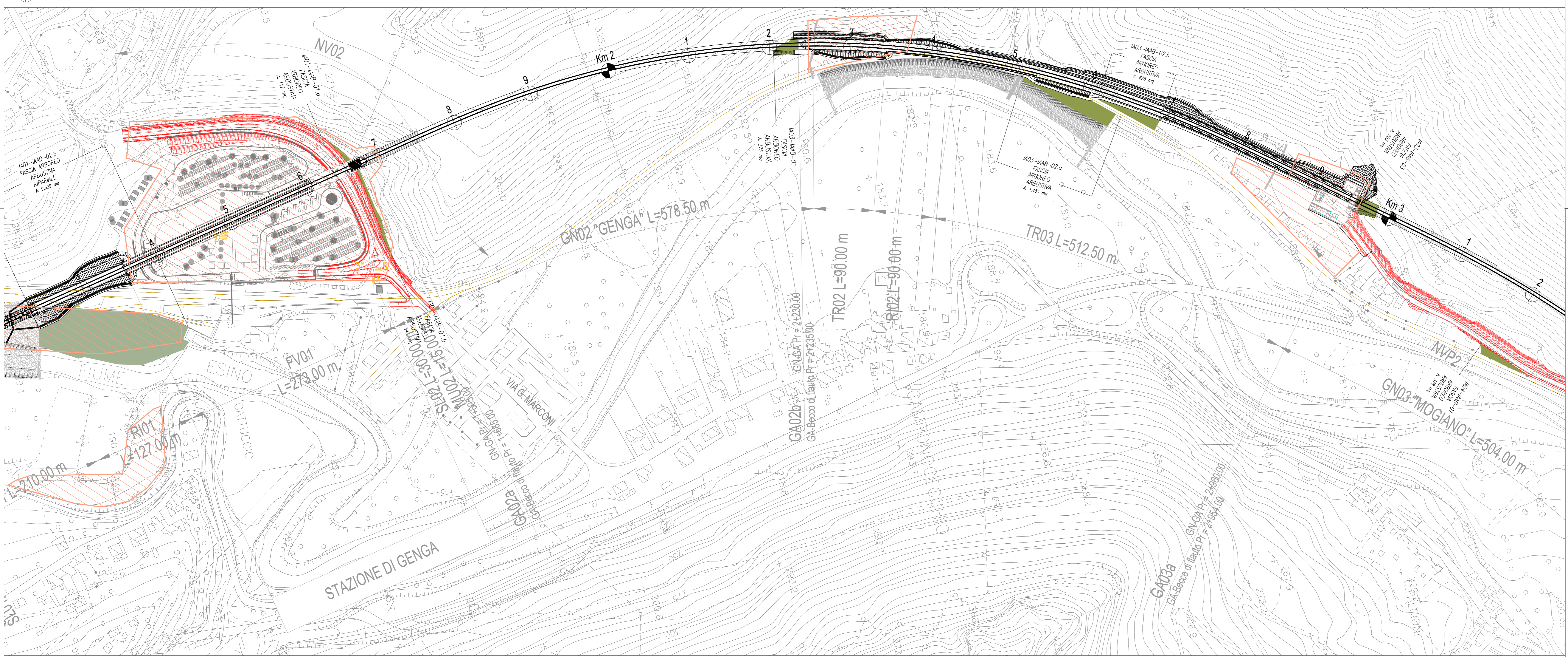
TRATTO A - CARTA DI SINTESI DELLE MISURE DI TUTELA DEL TERRITORIO