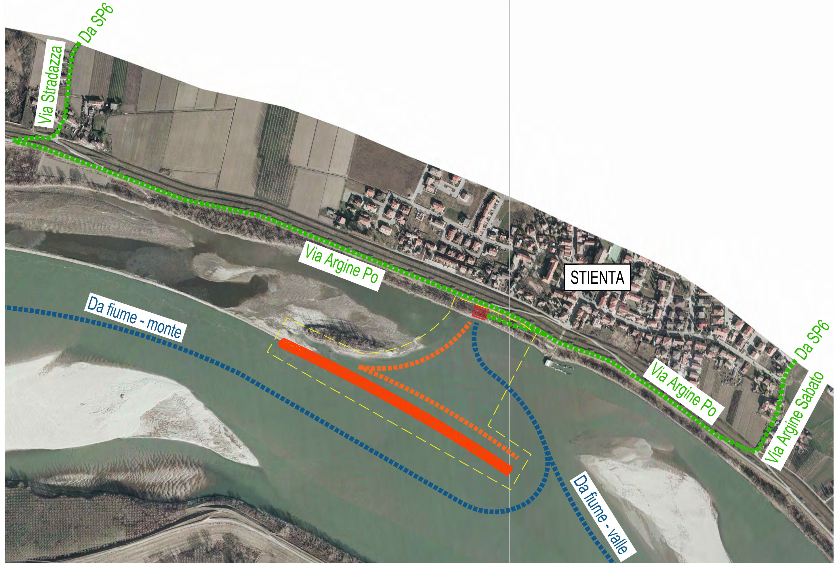
GRUPPO DI INTERVENTO N°13 - PLANIMETRIA DI ACCESSO AL CANTIERE - SCALA 1:5000