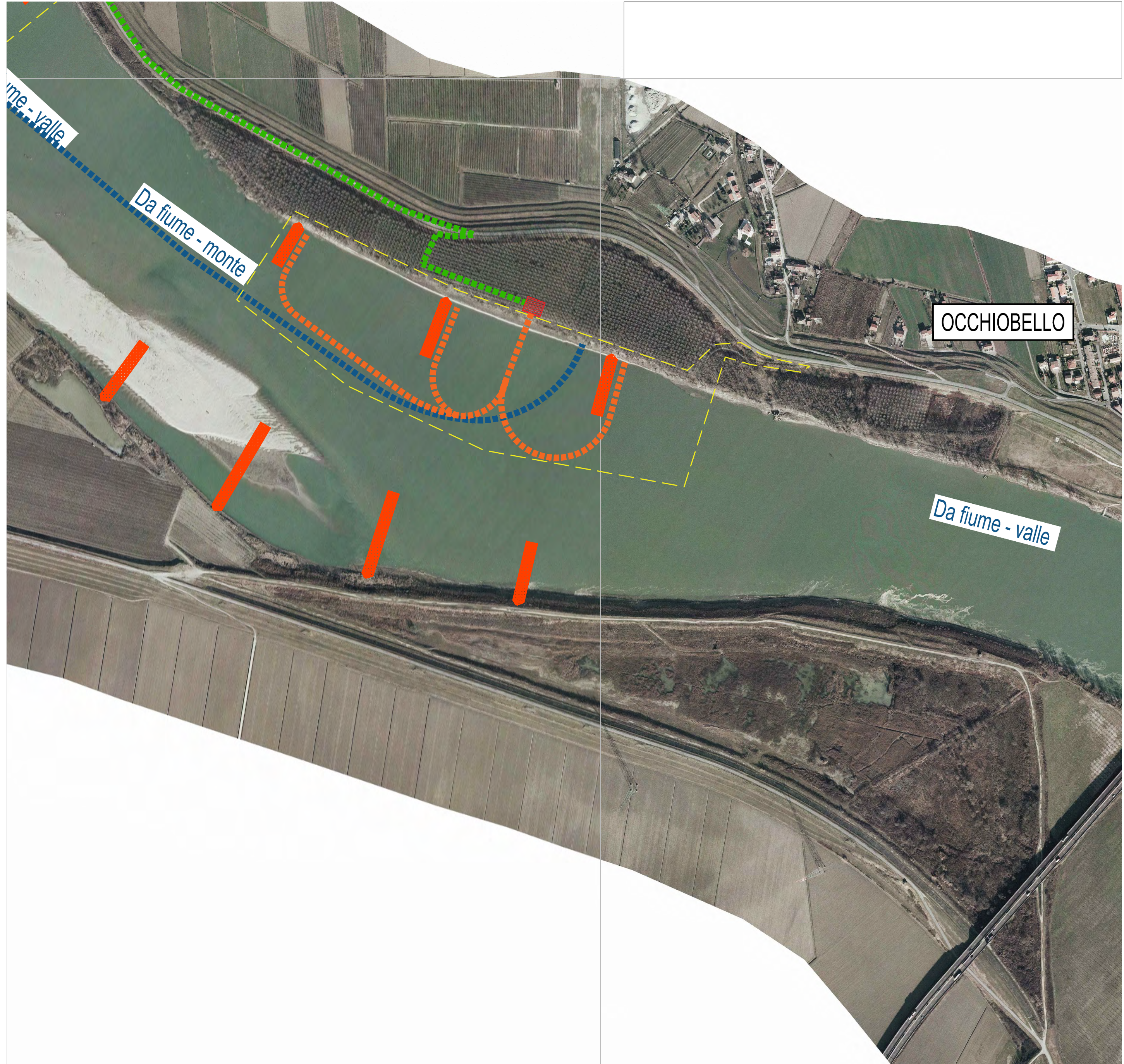
GRUPPO DI INTERVENTO N°15 - SPONDA SINISTRA - PLANIMETRIA DI ACCESSO AL CANTIERE - SCALA 1:5000