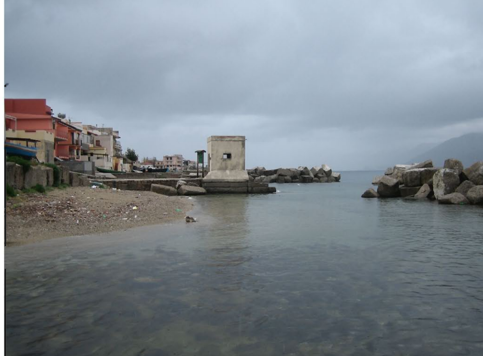
Canale Catuso - stato di fatto