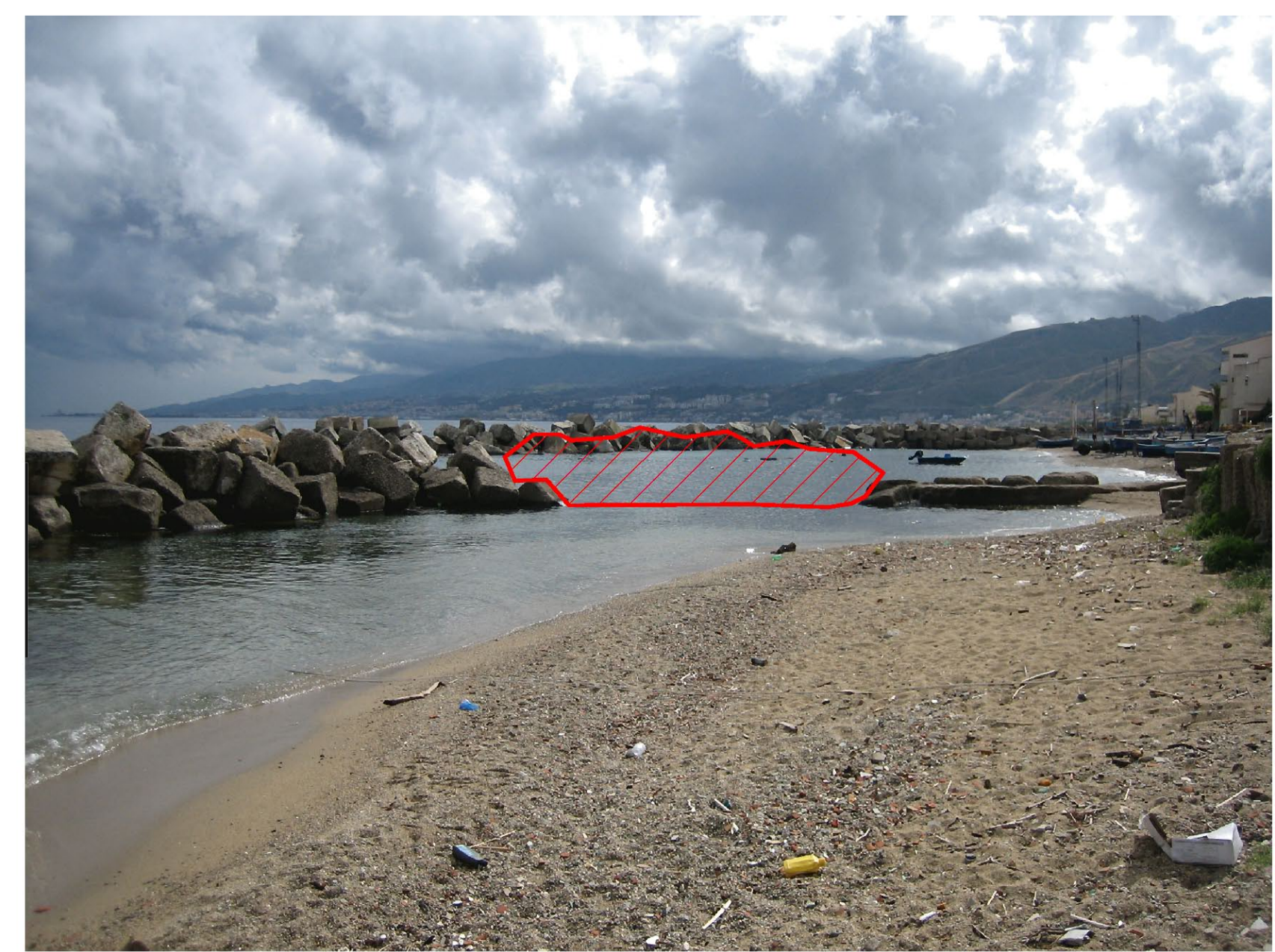
Stato di fatto della zona con localizzazione degli interventi

AREA DI INTERVENTO 2 – FOCE CANALE "DEL CARMINE" VILL. GANZIRRI Modifica dell'orientamento attuale della scogliera di protezione della foce del canale dalle mareggiate provenienti da sud, tramite collocazione di scogli dall'argine destro alla barriera esistente in modo da prevenire l'interrimento della foce.