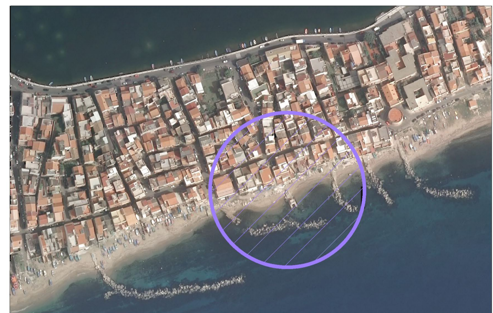
Identificazione dell'area di intervento

AREA DI INTERVENTO 1 – FOCE CANALE "CATUSO" VILL. GANZIRRI Prolungamento verso terra di una scogliera esistente tramite collocazione di scogli prelevati dal pannello in cls posto sull'arenile, creando una barriera protettiva per preservare l'imbocco del canale dalle scioccate, causa di interrimento della foce.