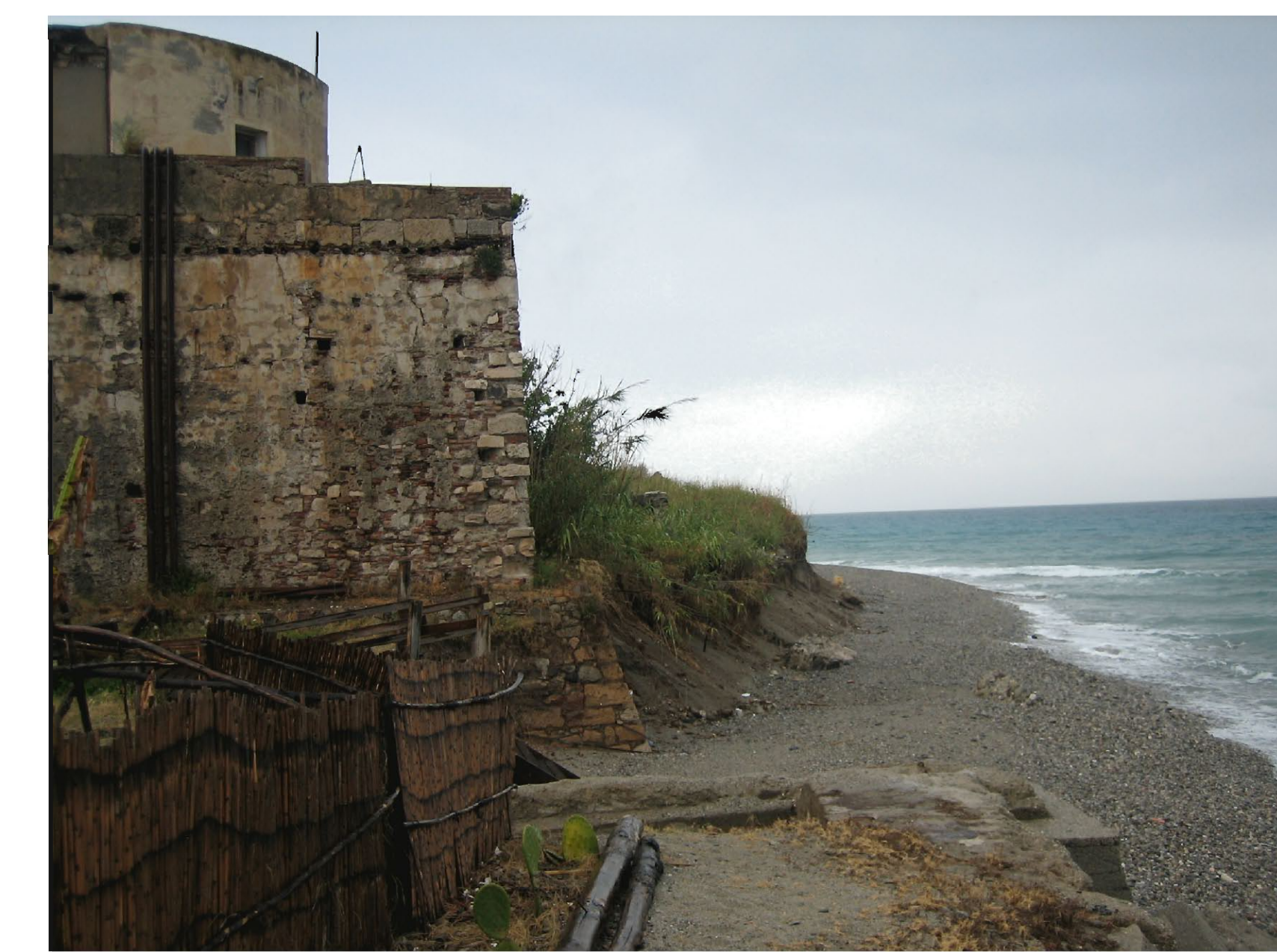
Fortino degli Inglesi – area di possibile riutilizzo delle sabbie