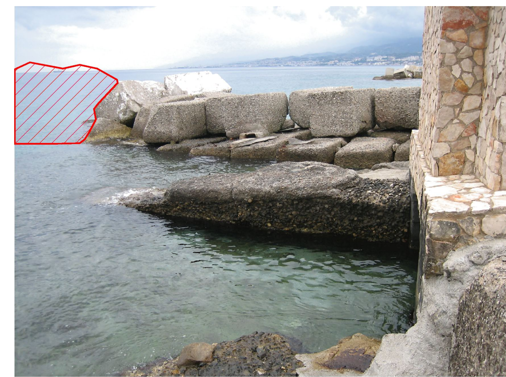
Stato di fatto della zona con localizzazione degli interventi

AREA DI INTERVENTO 4 – FOCE CANALE DEGLI INGLESII VILL. TORRE FARO Salpamento di una scogliera esistente che impedisce il trasporto litoraneo delle sabbie per il ripascimento, e possibilità di utilizzare i cumuli di sabbia sulle sponde del canale per la protezione del tratto di costa in erosione in corrispondenza del Fortino degli Inglesi.