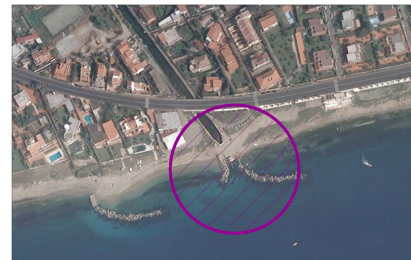
Identificazione dell'area di intervento

AREA DI INTERVENTO 2 – FOCE CANALE "DEL CARMINE" VILL. GANZIRRI Modifica dell'orientamento attuale della scogliera di protezione della foce del canale dalle mareggiate provenienti da sud, tramite collocazione di scogli dall'argine destro alla barriera esistente in modo da prevenire l'interrimento della foce.