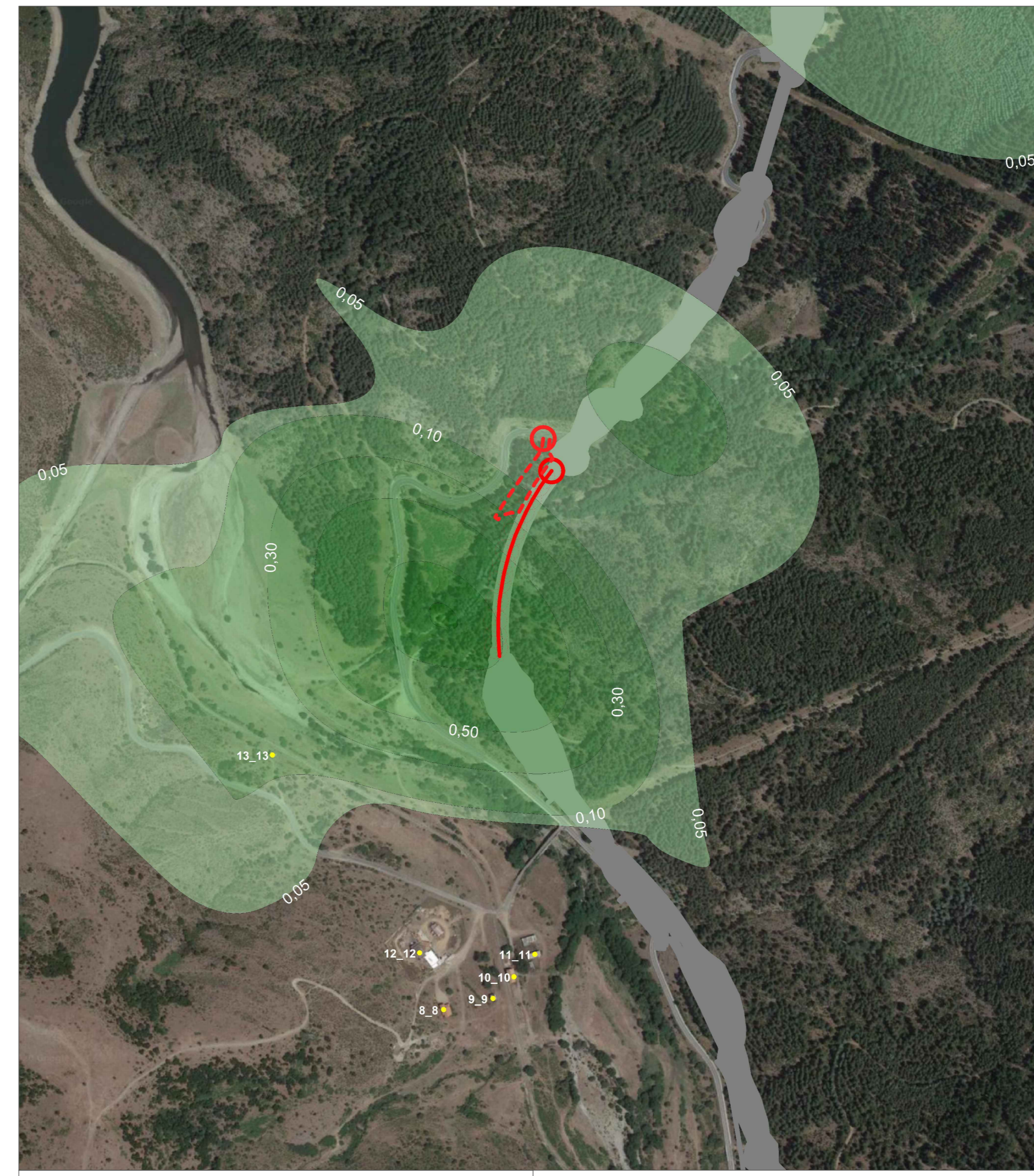
TAV. 19 Dettaglio V03 SCALA 1:5000