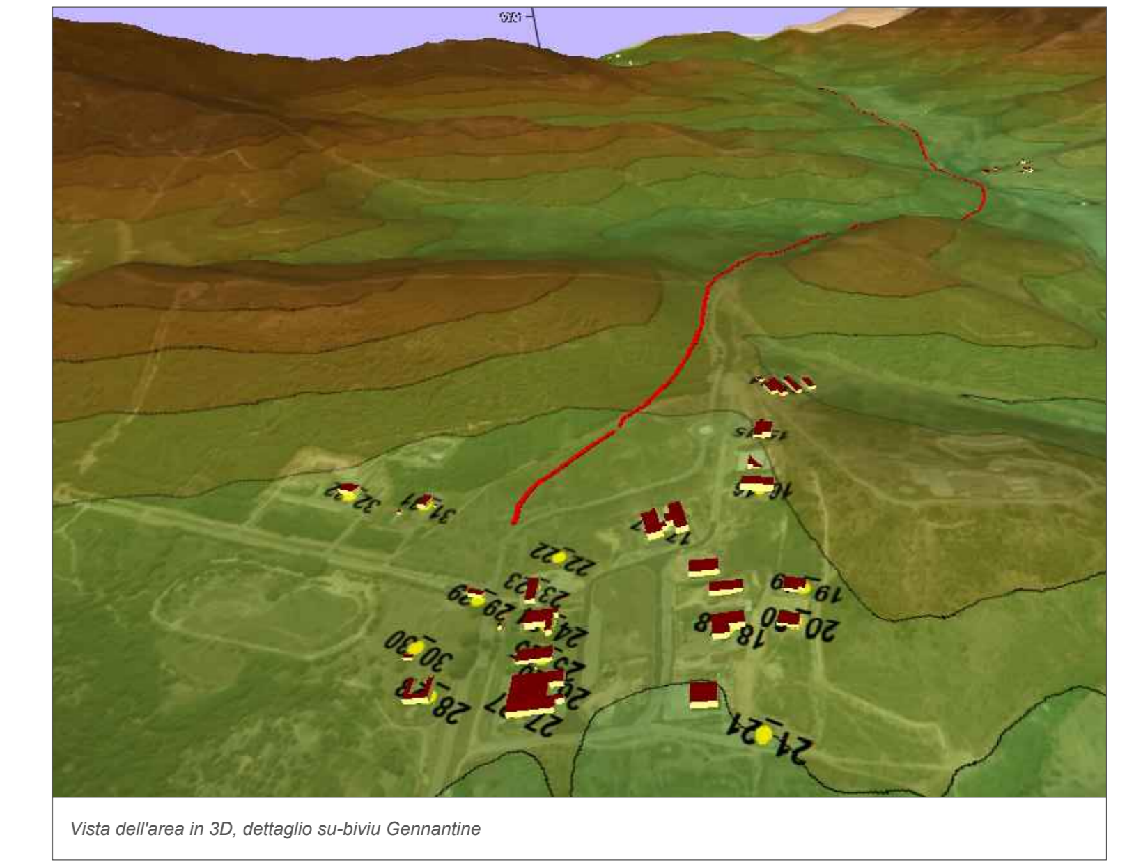
Vista dell'area in 3D, dettaglio su-bivio Gennantine