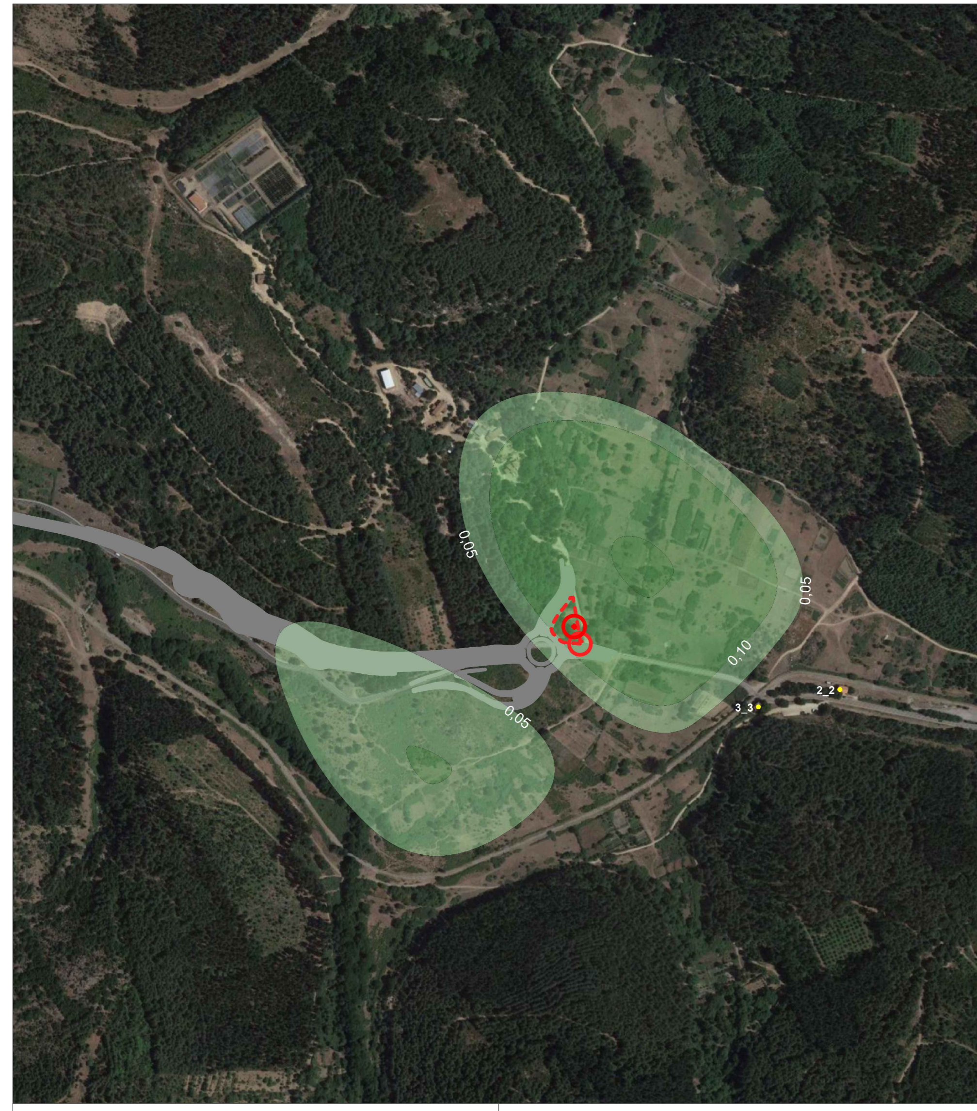
TAV. 19 Dettaglio Cantiere Sud SCALA 1:5000