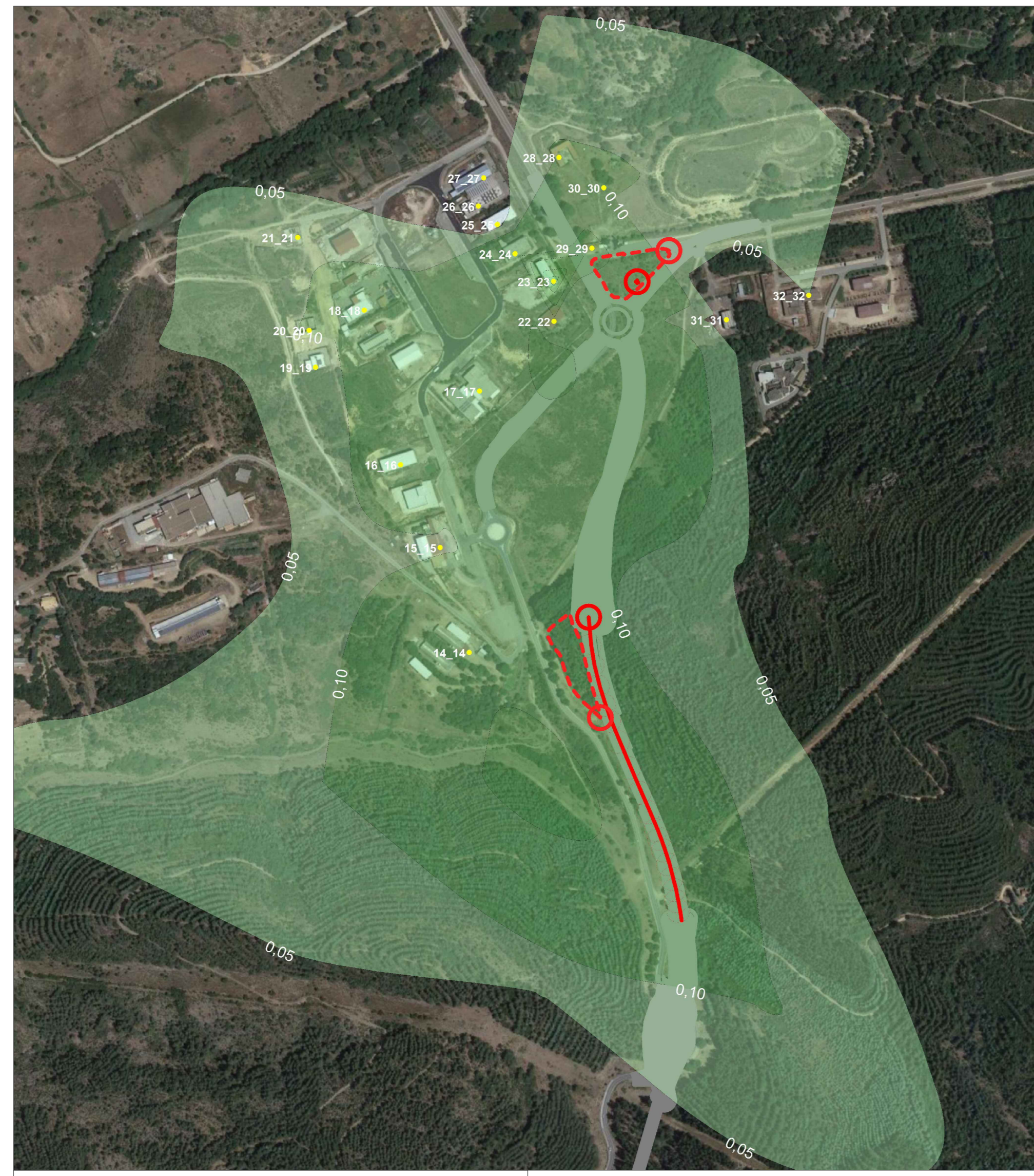
TAV. 19 Dettaglio Cantiere Nord - GA 01 SCALA 1:5000