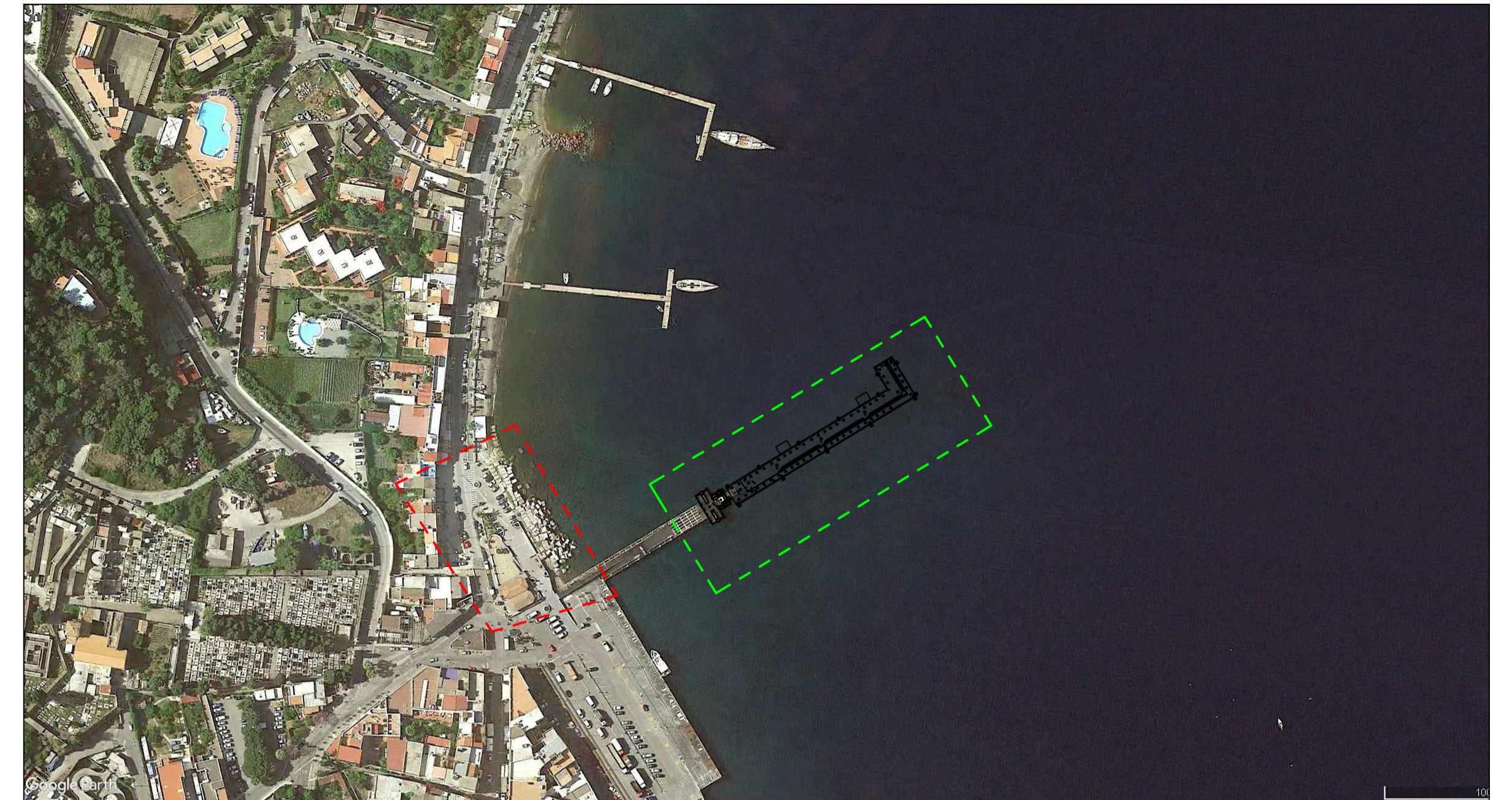
Ortofoto - - - - - Ampliamento del molo in previsione - - - - - Sito di intervento