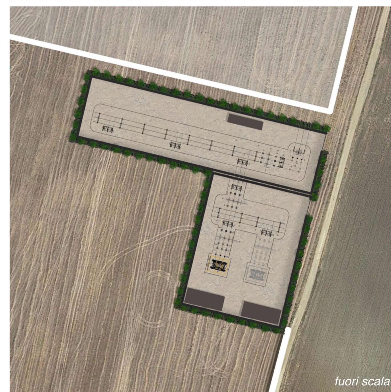
progetto complessivo • keymap