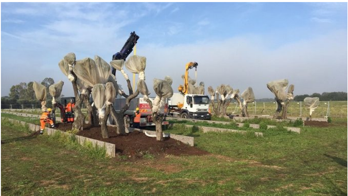
Ulivi espantati dal cantiere TAP e collocati nel sito di conservazione temporanea di Melendugno (LE)