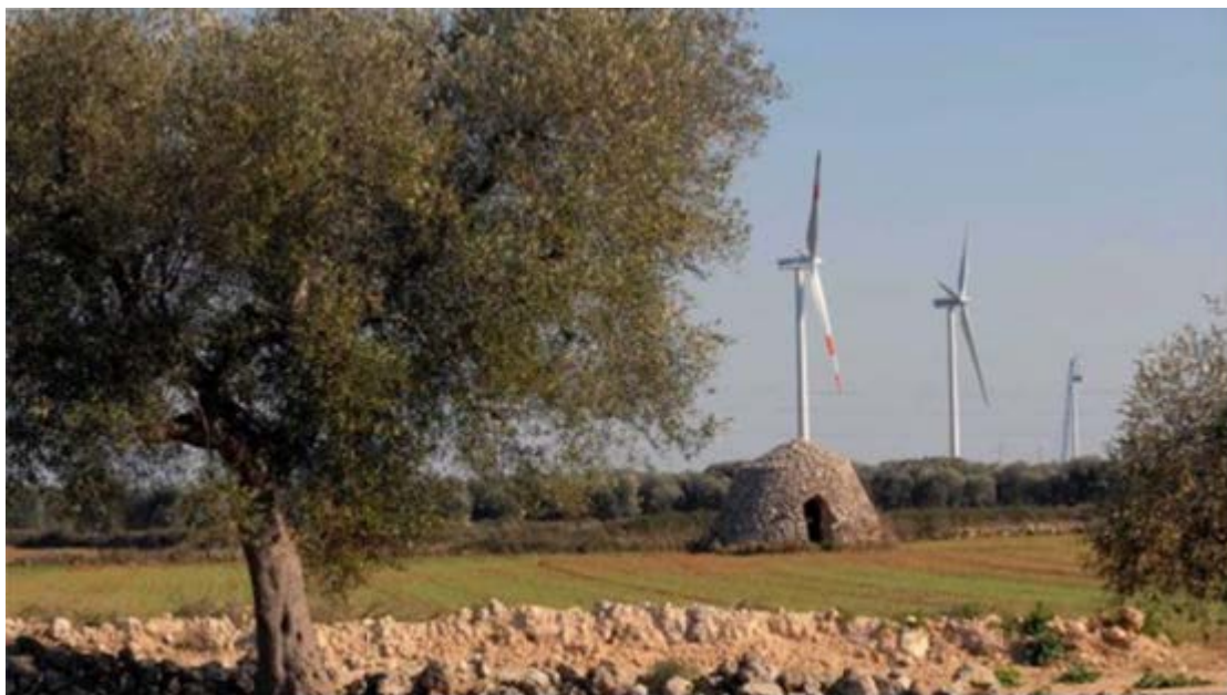
Figura 3 Esempi di parchi eolici in Puglia nel contesto agricolo