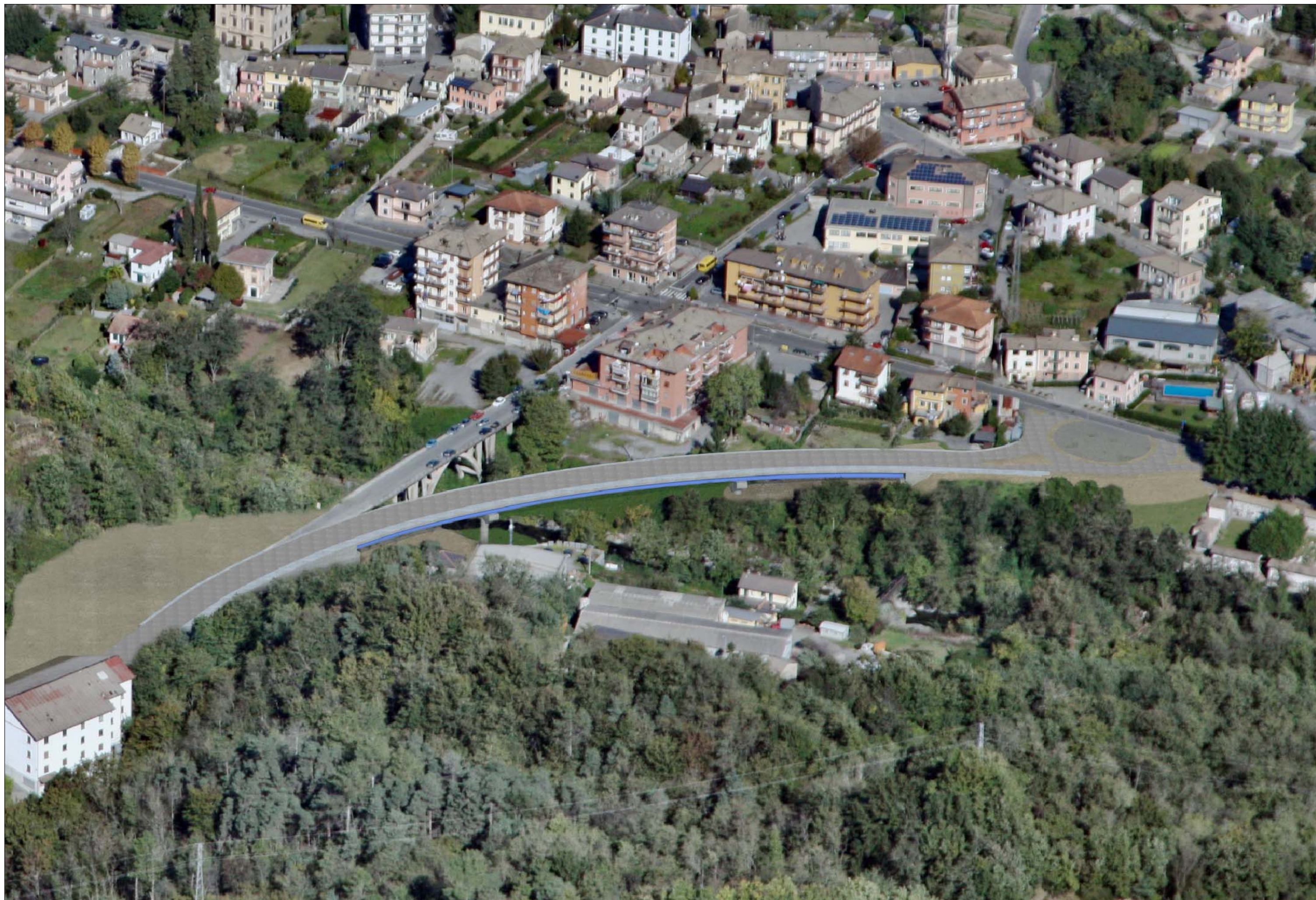
Ponte sul Torrente Lavagna Fase di cantiere - simulazione progettuale