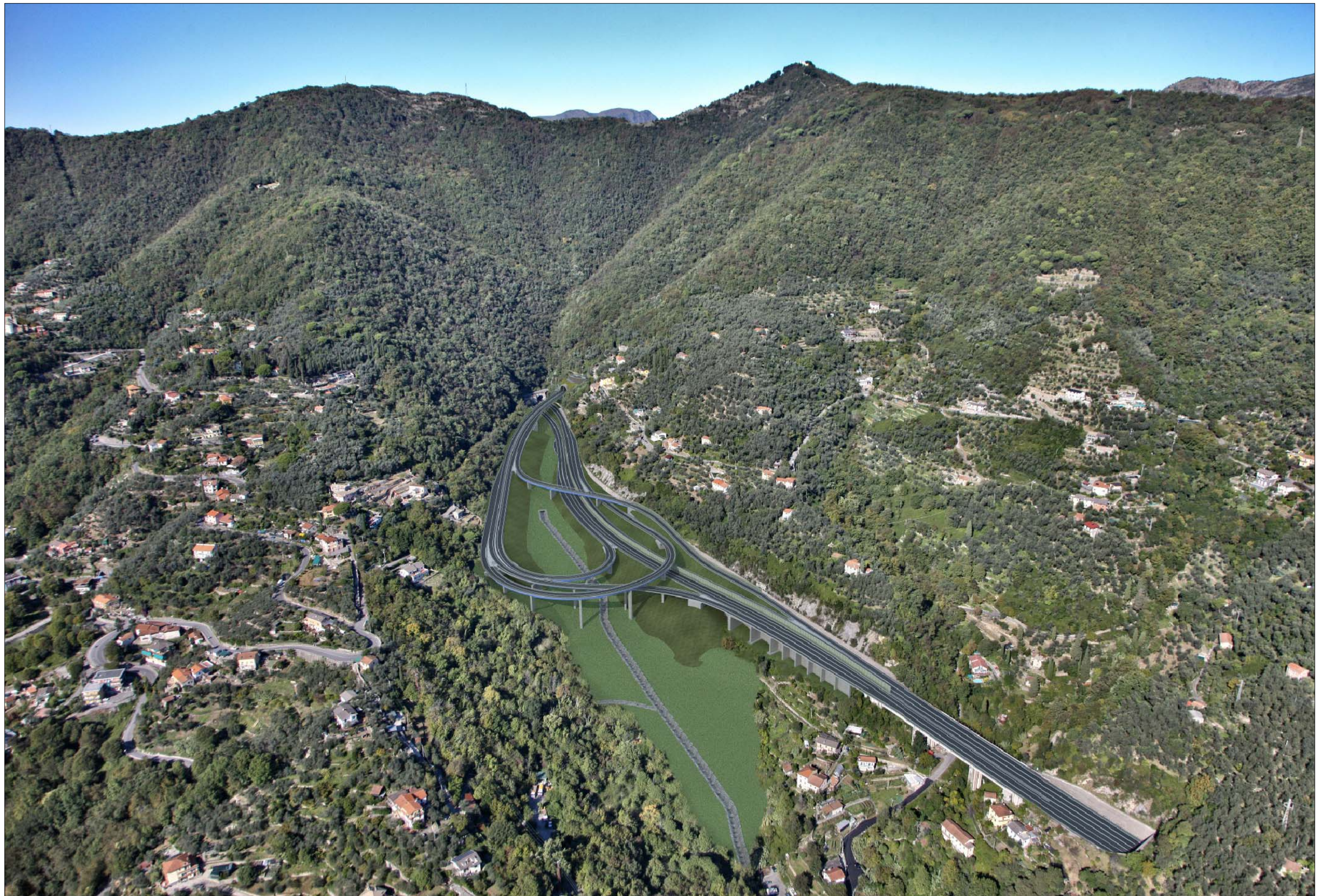
Svincolo in A12 e imbocco Galleria Caravaggio lato Rapallo Completamento della sistemazione definitiva - simulazione progettuale