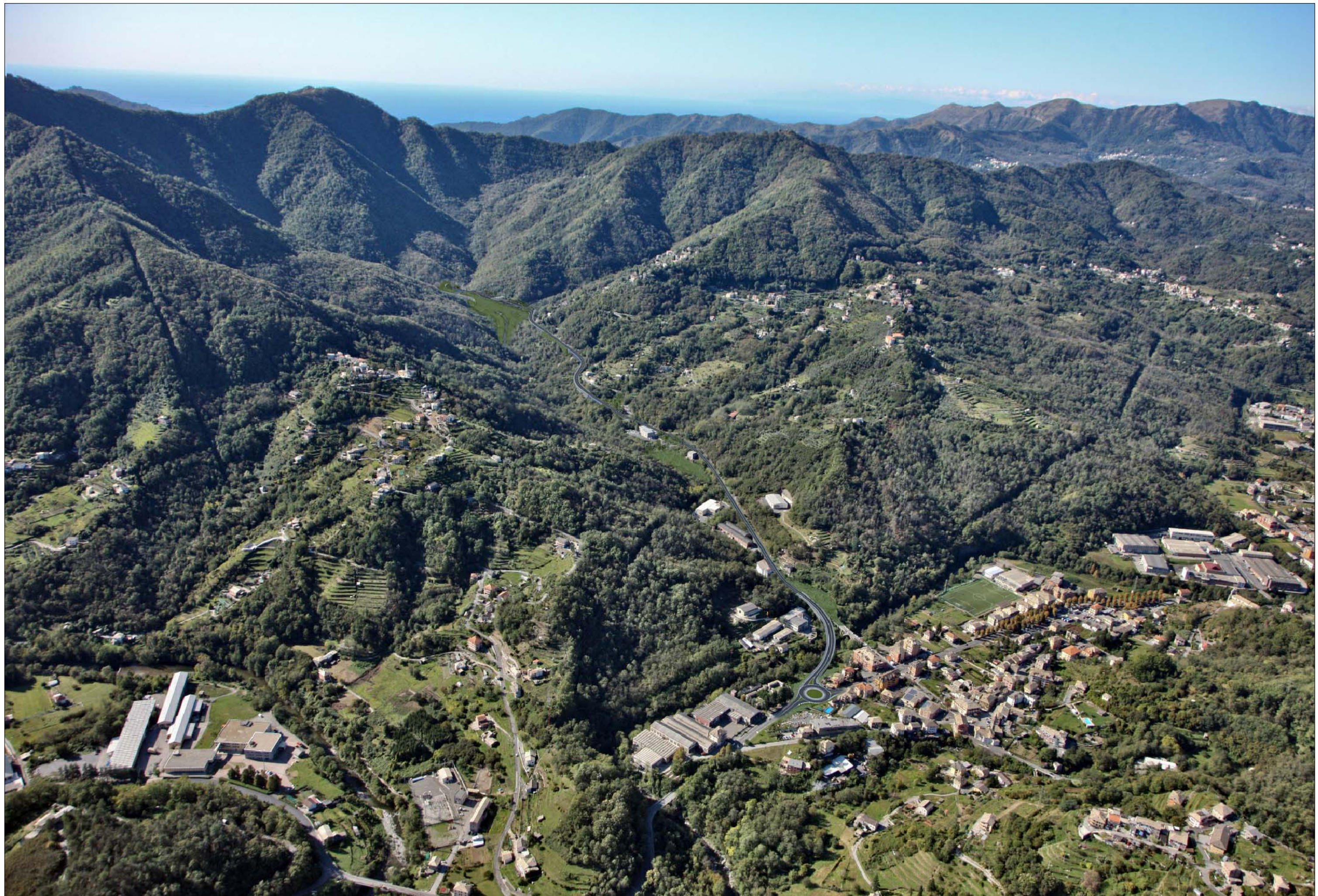
Riqualificazione della S.P.22 e intersezione con S.P. 225 Completamento della sistemazione definitiva - simulazione progettuale