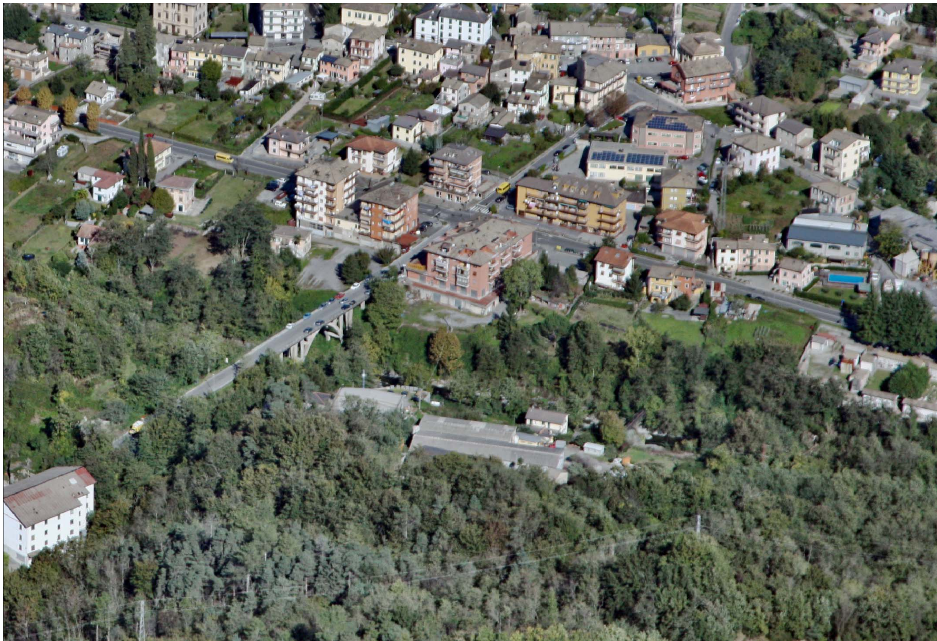
Ponte sul Torrente Lavagna Stato di fatto