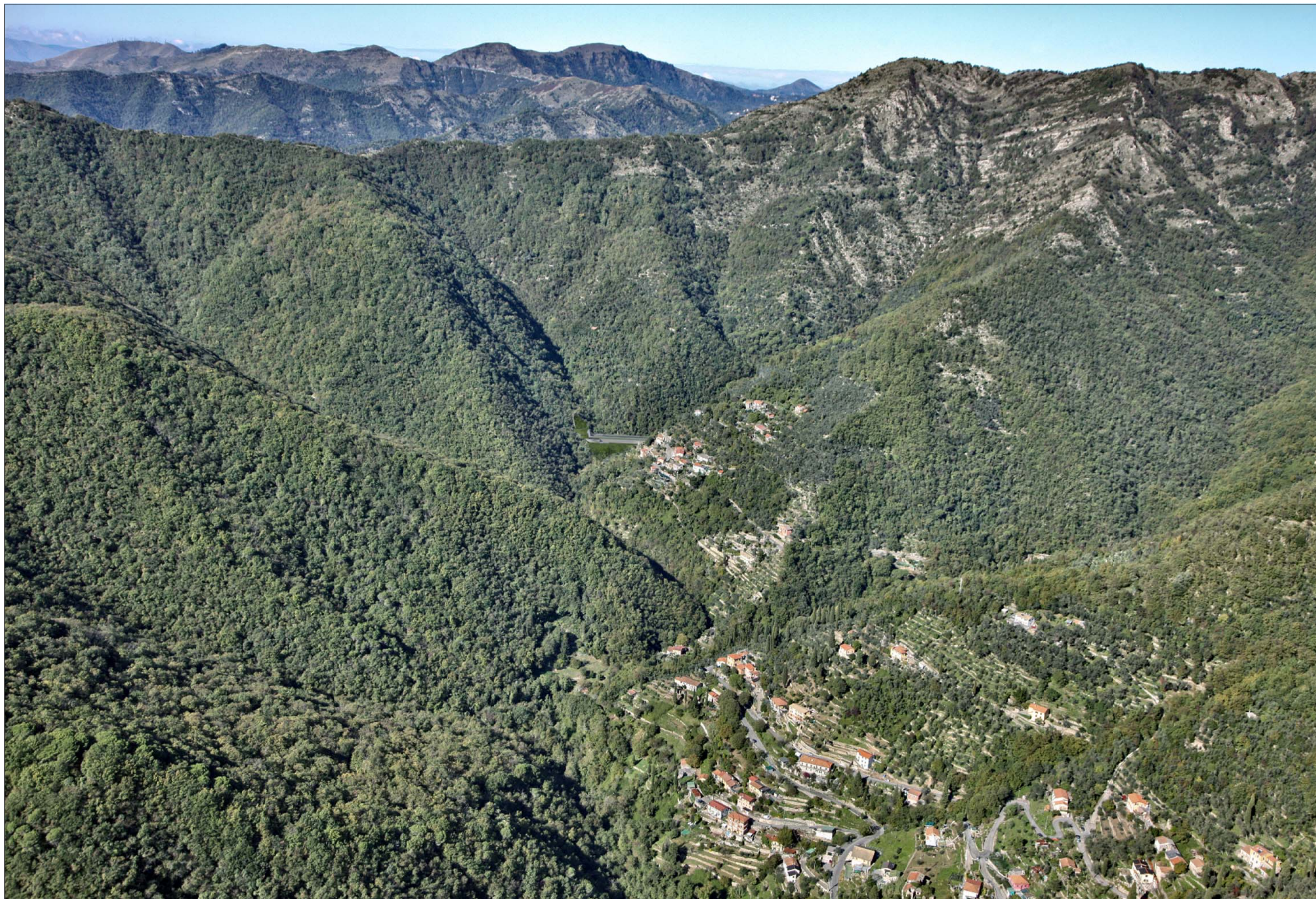
Imbocco Galleria Caravaggio lato Valfontanabuona Completamento della sistemazione definitiva - simulazione progettuale