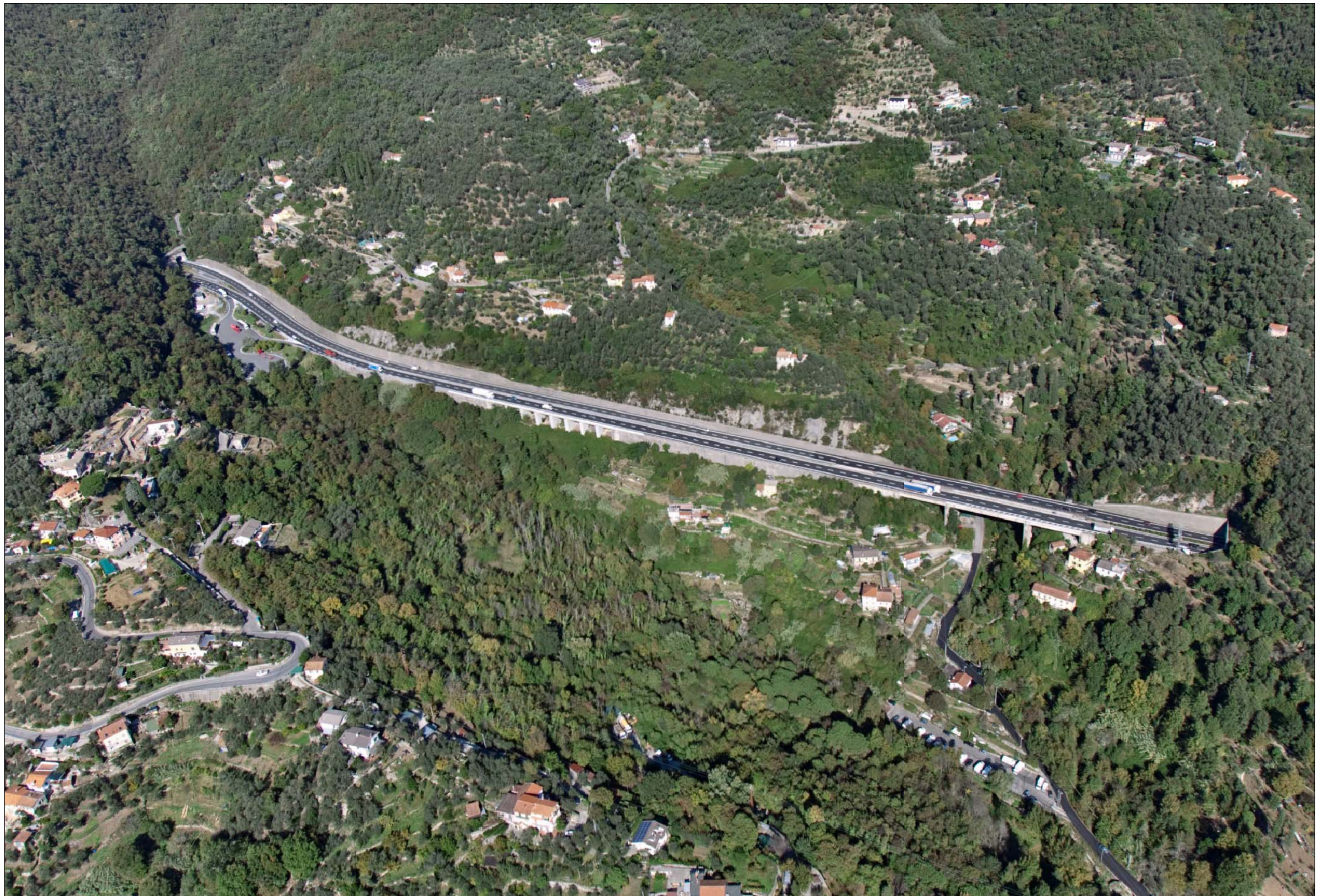
Svincolo in A12 e imbocco Galleria Caravaggio lato Rapallo Stato di fatto