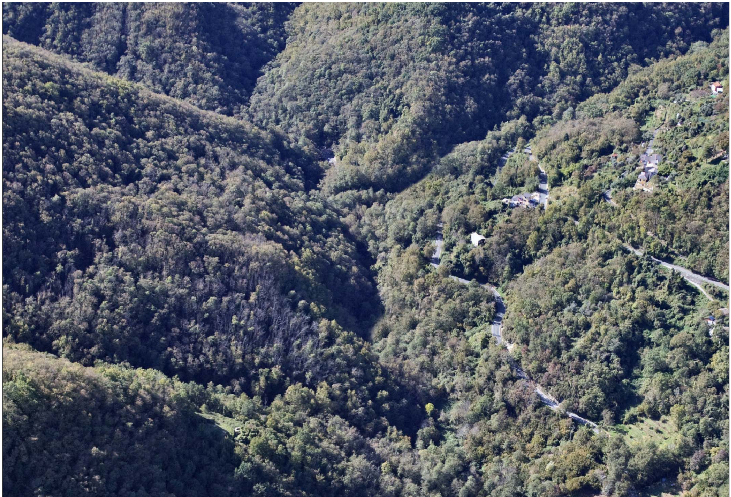
Imbocco Galleria Fontanabuona lato Valfontanabuona - Stazione di esazione Stato di fatto