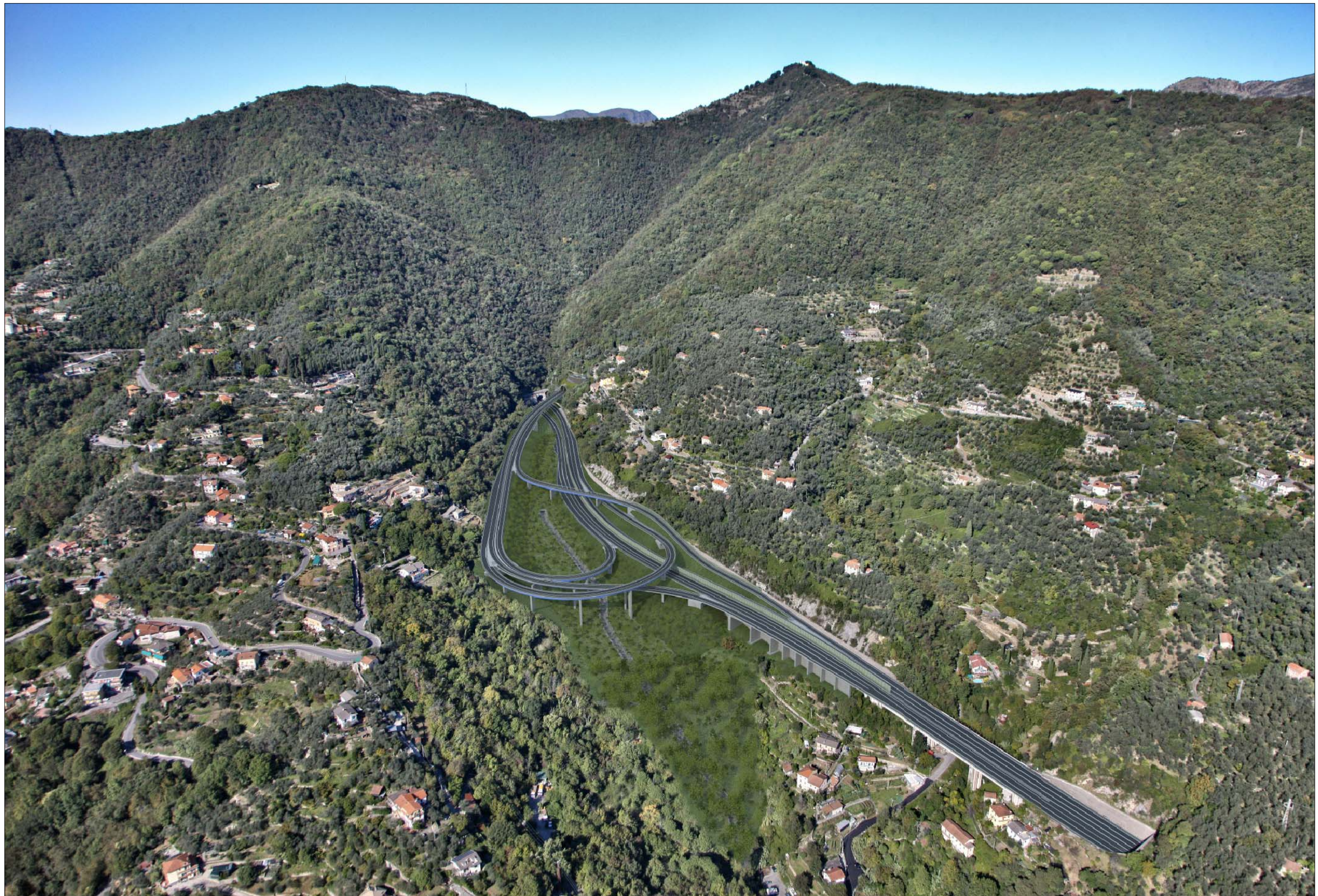
Svincolo in A12 e imbocco Galleria Caravaggio lato Rapallo Crescita della vegetazione di progetto - simulazione progettuale