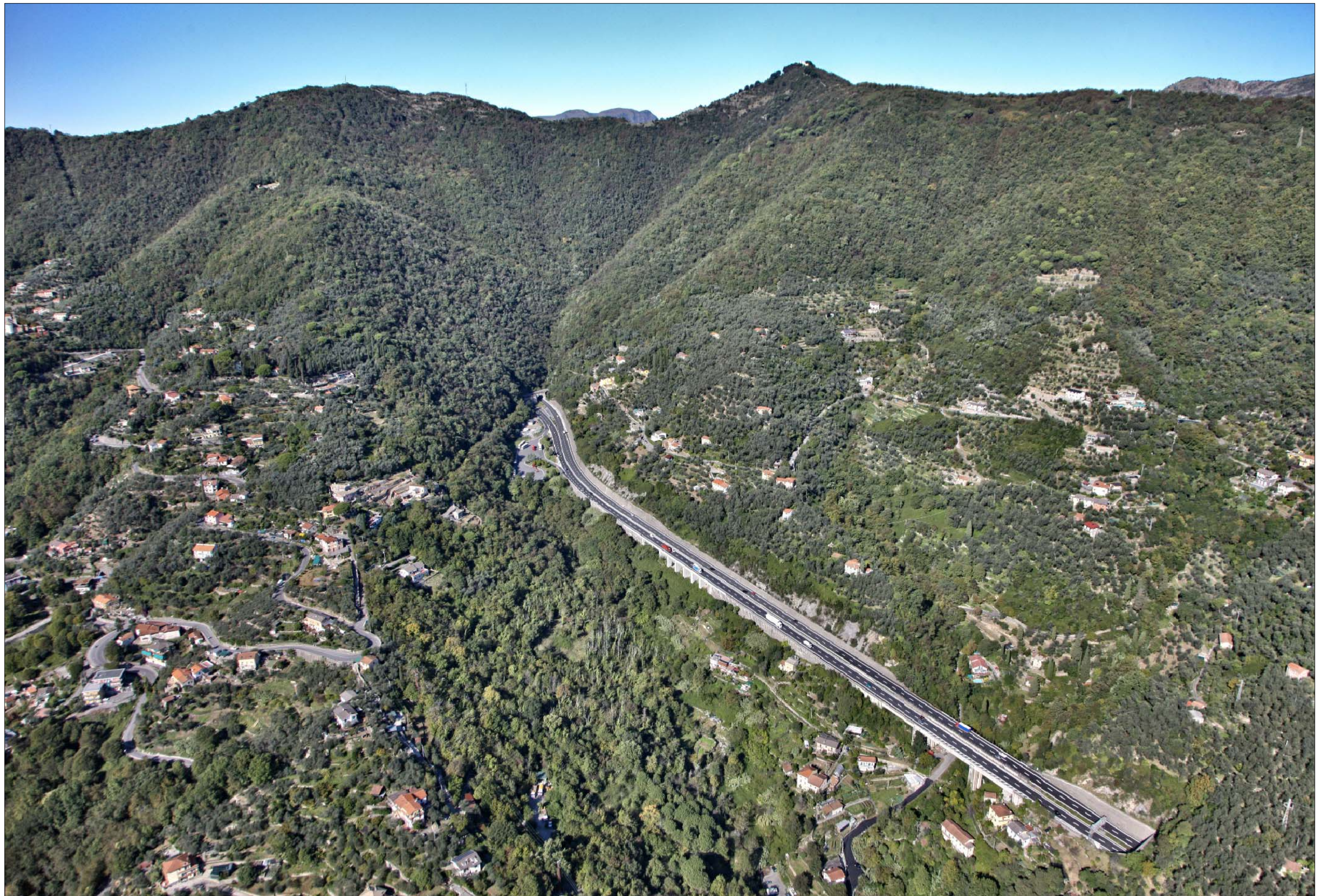
Svincolo in A12 e imbocco Galleria Caravaggio lato Rapallo Stato di fatto