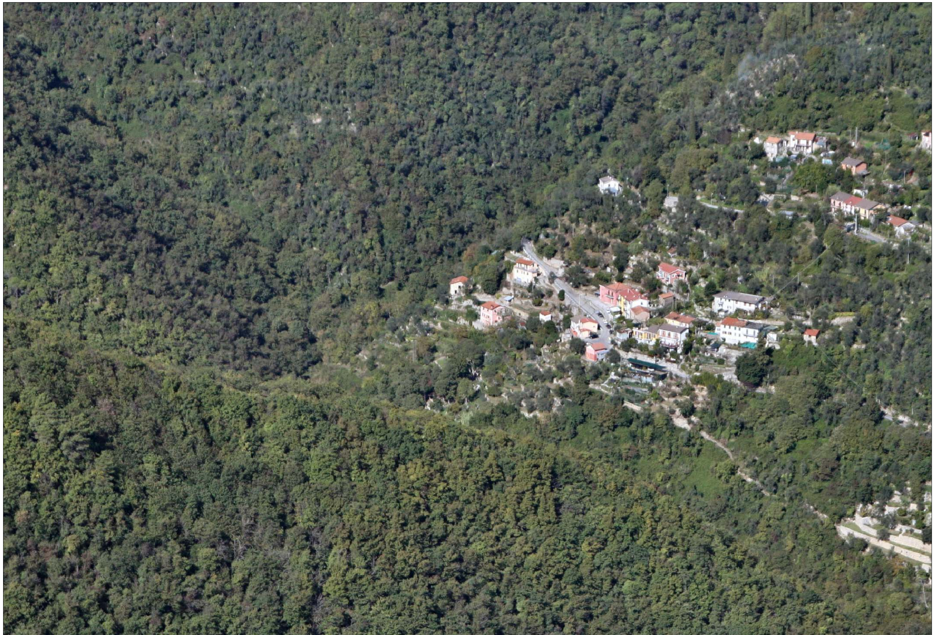
Imbocco Galleria Caravaggio lato Valfontanabuona Stato di fatto