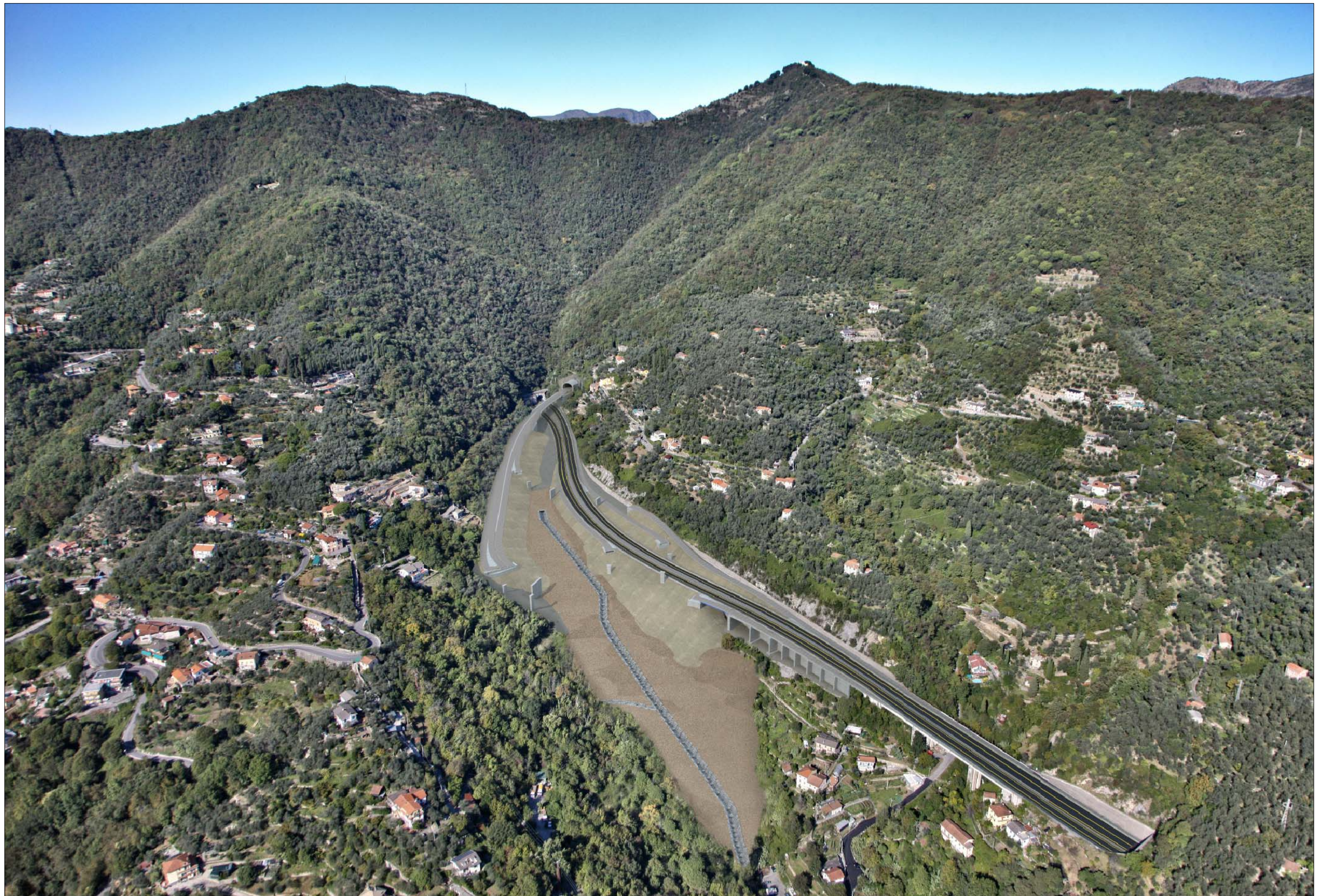
Svincolo in A12 e imbocco Galleria Caravaggio lato Rapallo Fase di cantiere - simulazione progettuale