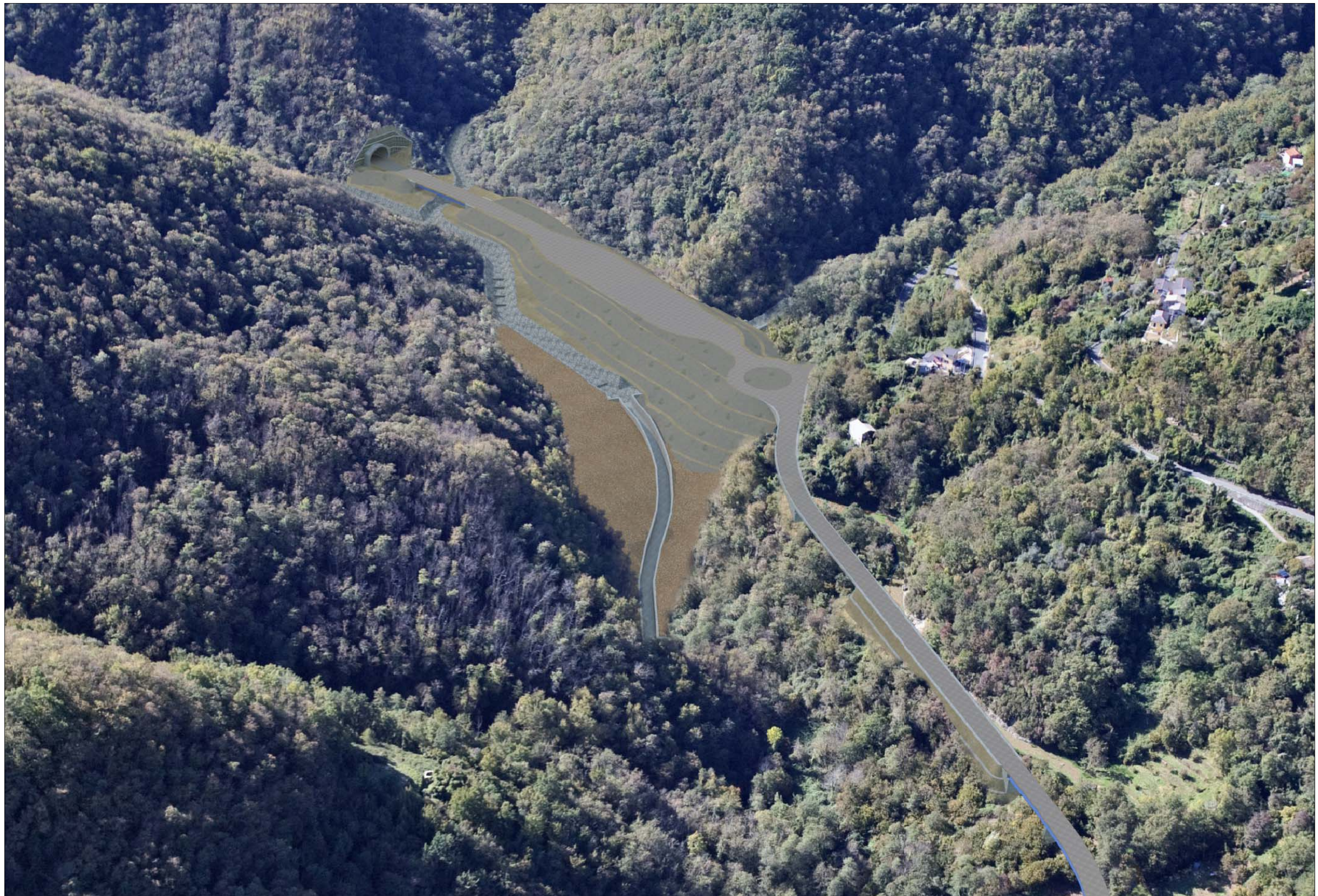
Imbocco Galleria Fontanabuona lato Valfontanabuona - Stazione di esazione Fase di cantiere - simulazione progettuale