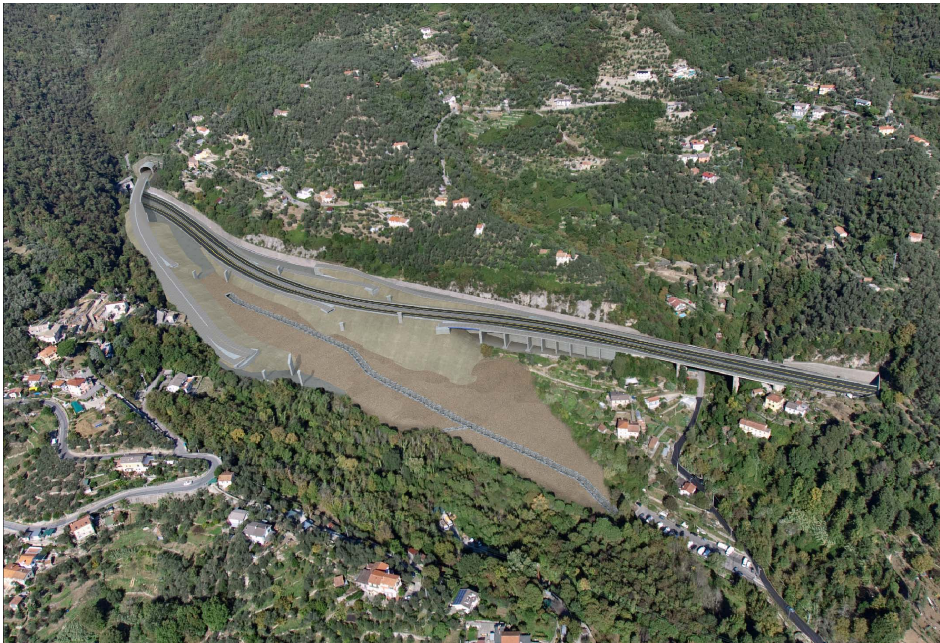
Svincolo in A12 e imbocco Galleria Caravaggio lato Rapallo Fase di cantiere - simulazione progettuale