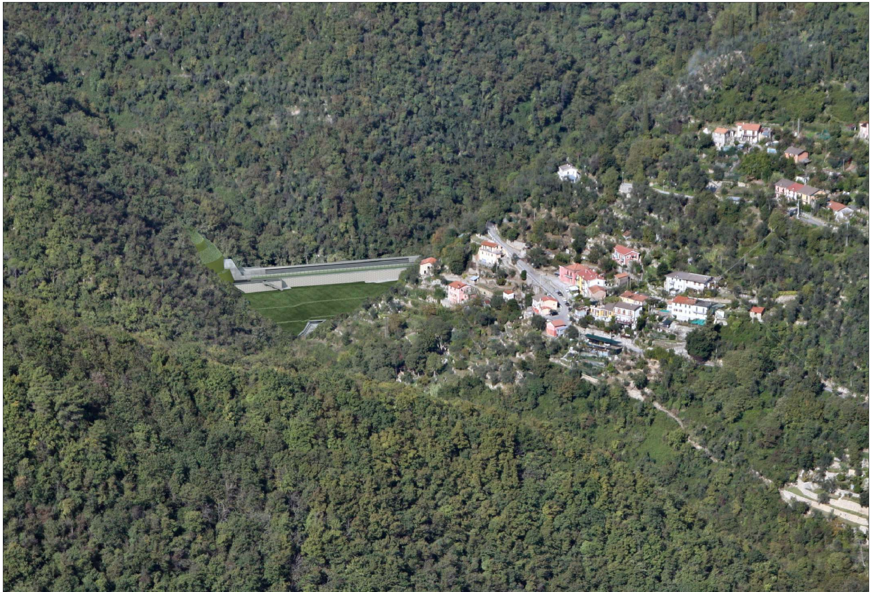
Imbocco Galleria Caravaggio lato Valfontanabuona Completamento della sistemazione definitiva - simulazione progettuale