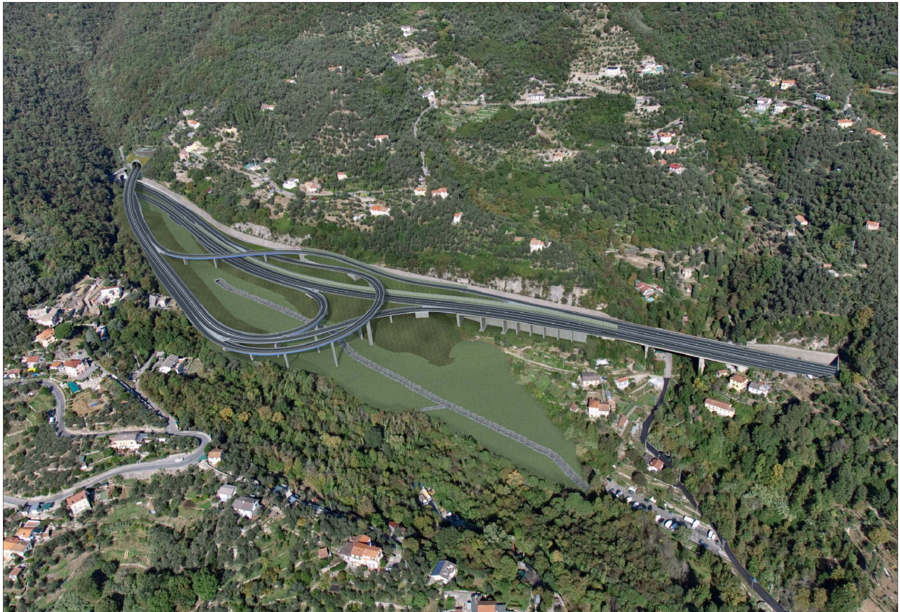
Svincolo in A12 e imbocco Galleria Caravaggio lato Rapallo Completamento della sistemazione definitiva - simulazione progettuale