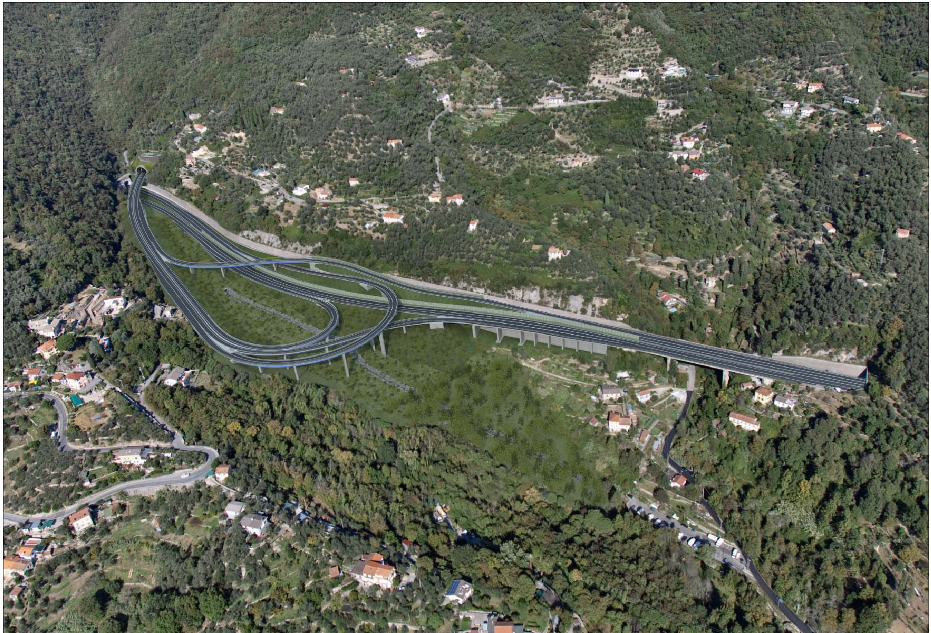
Svincolo in A12 e imbocco Galleria Caravaggio lato Rapallo Crescita della vegetazione di progetto - simulazione progettuale