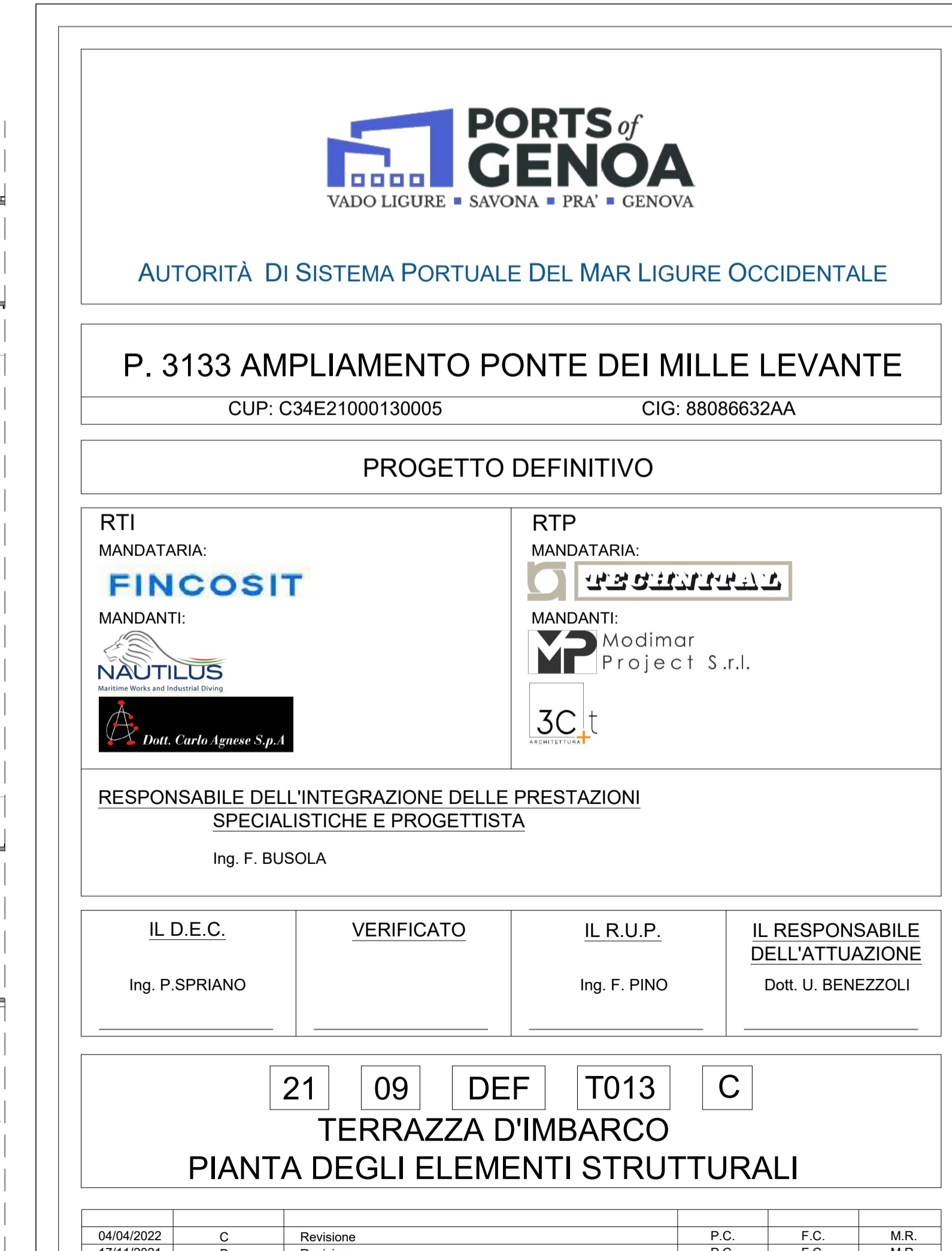
PLANIMETRIA QUOTA IMPALCATO TERRAZZA DI IMBARCO scala 1:500