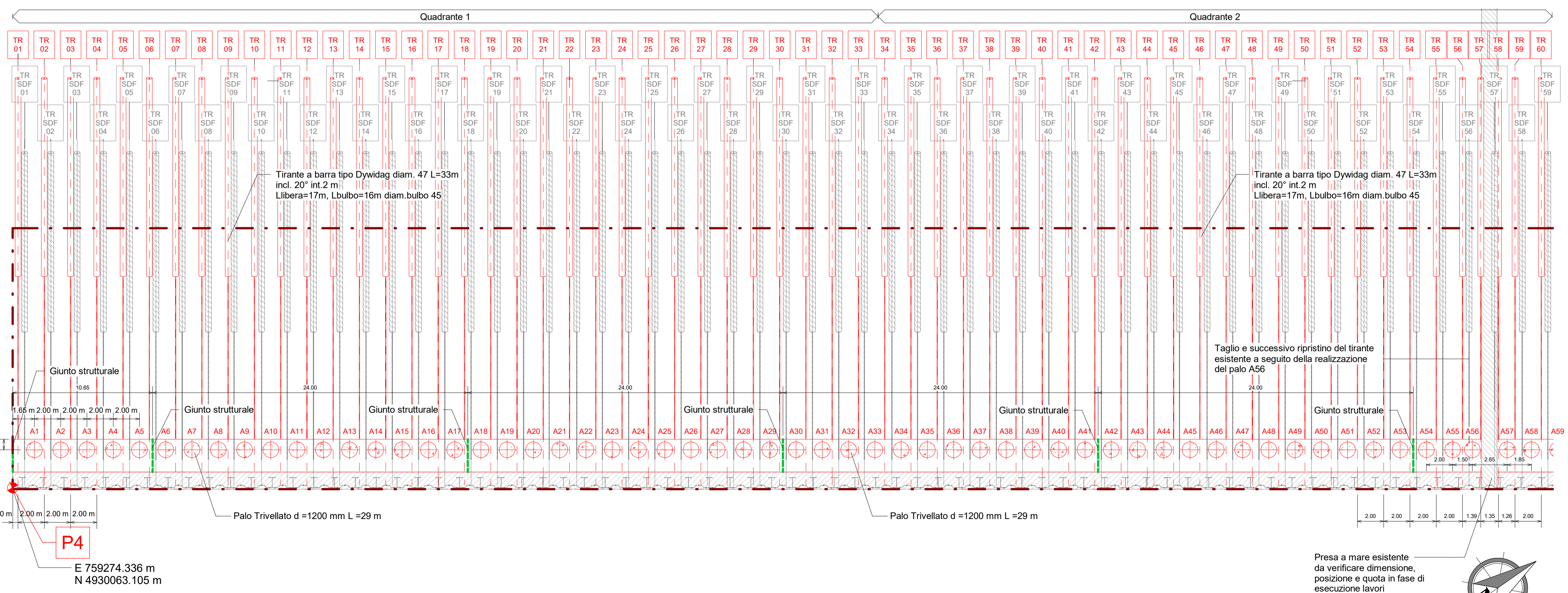
Pianta - Stato di progetto - Quadrante 1-2 - Vista dal basso 1 : 200