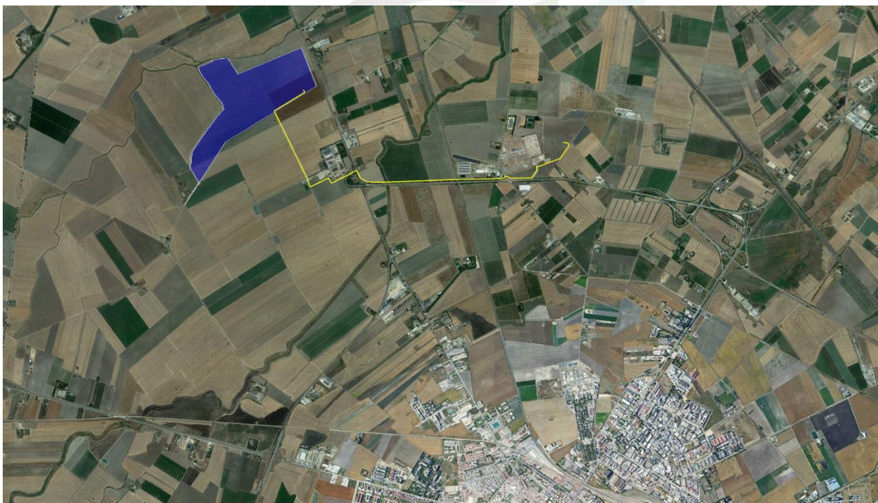
Localizzazione area di intervento, in blu la perimetrazione del sito, in giallo il tracciato della connessione

La superficie adibita all'impianto agrofotovoltaico è di 65,79 ha circa.