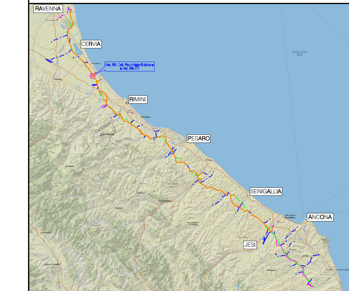
COROGRAFIA Scala 1:500.000

NOTA: Planimetria catastale aggiornata a Ottobre 2019