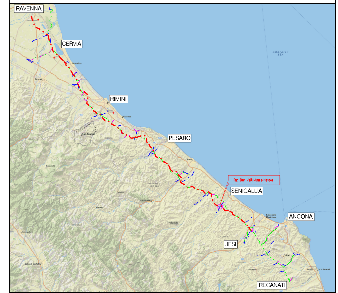
COROGRAFIA Scala 1:500.000

NOTA: Planimetria catastale aggiornata a Ottobre 2019