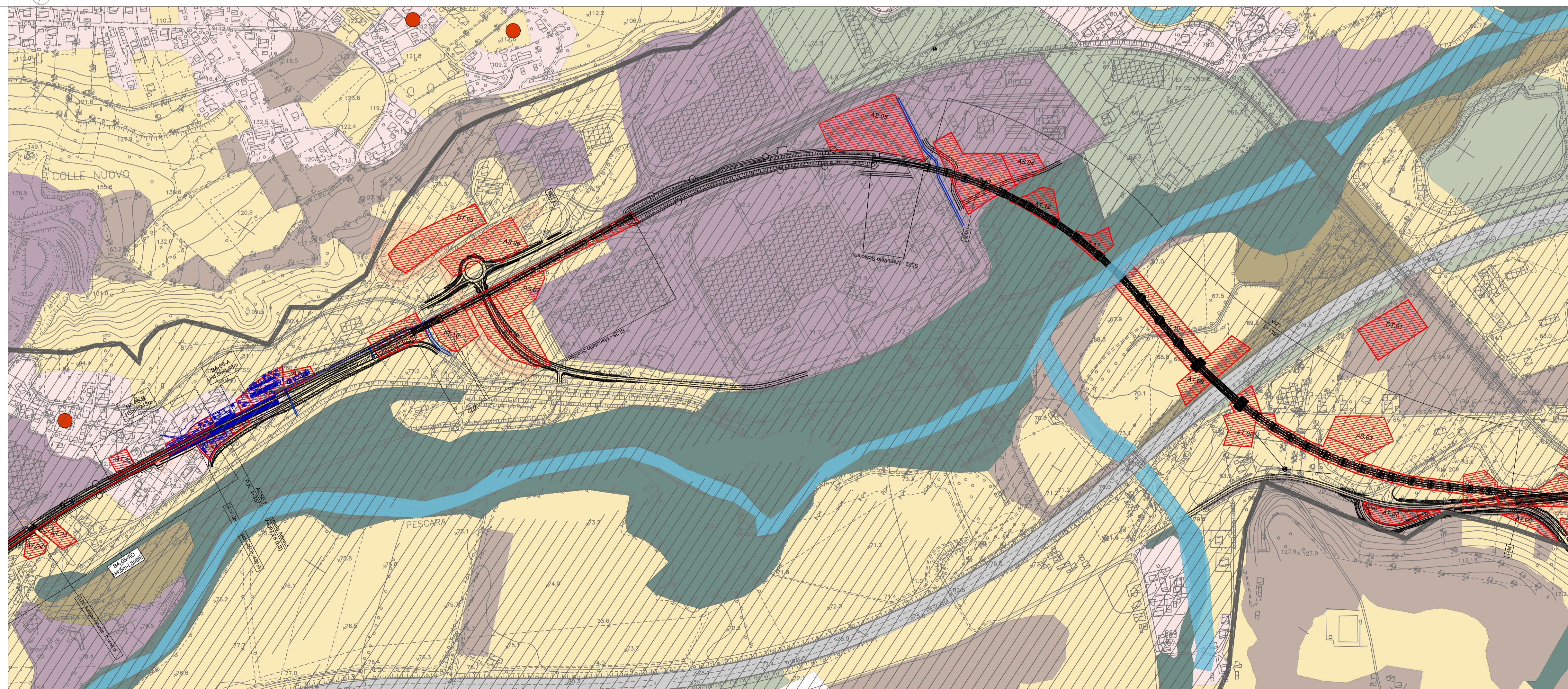
TRATTO B- CARTA DELLA STRUTTURA DEL PAESAGGIO