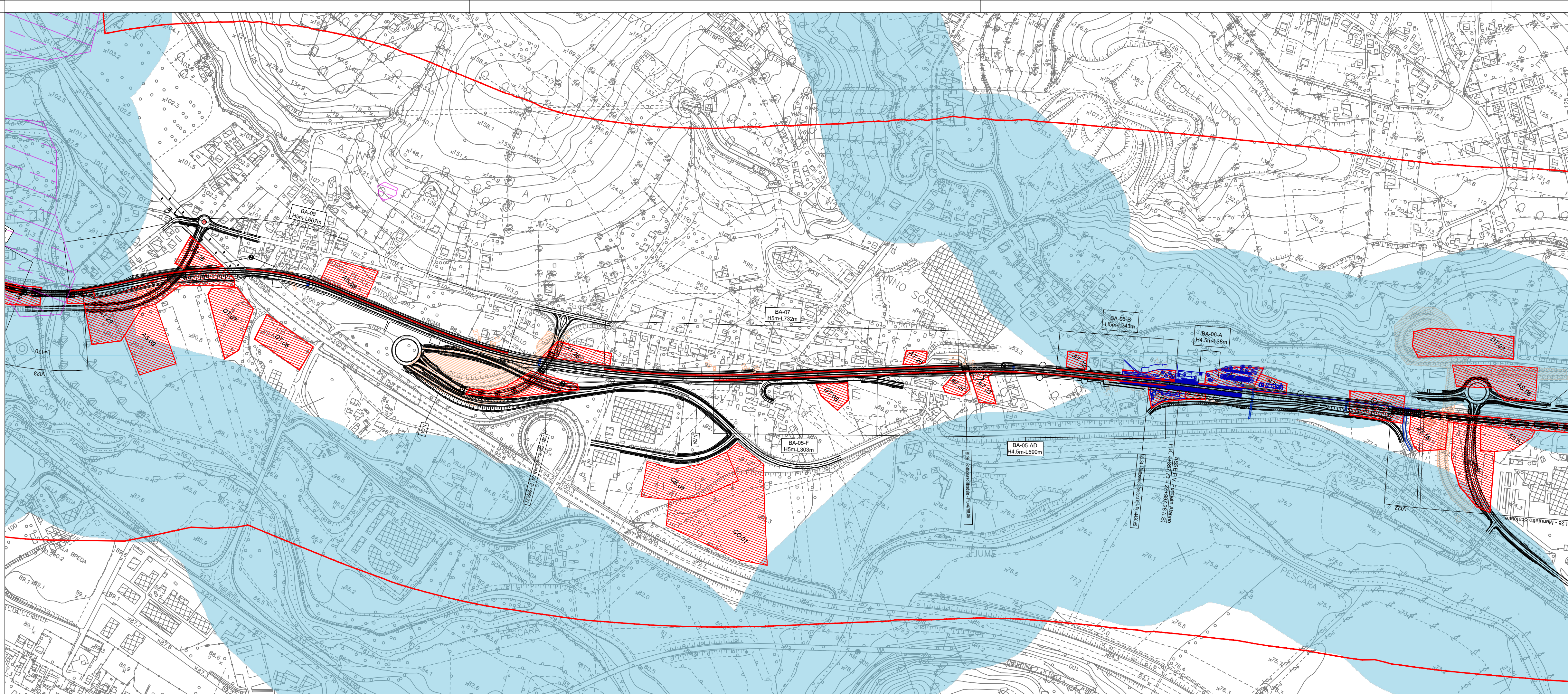
TRATTO C - CARTA DEI VINCOLI E DELLE TUTELE