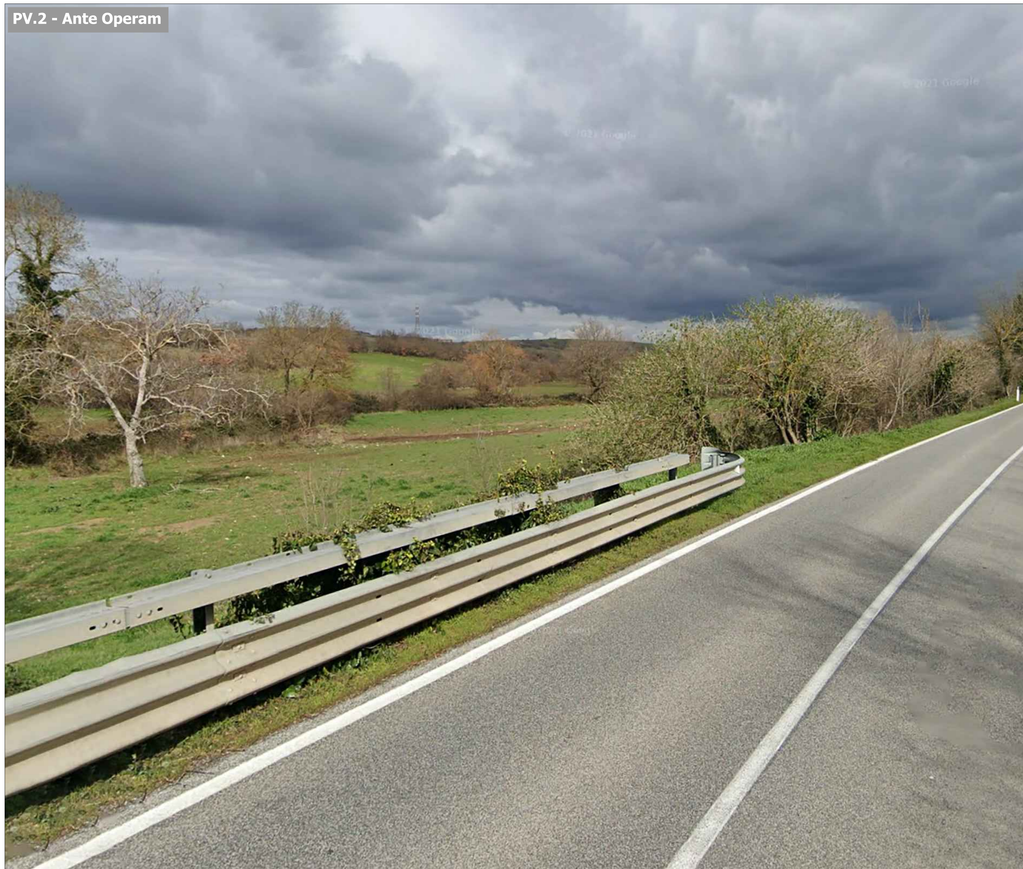
PV.2 - Ante Operam