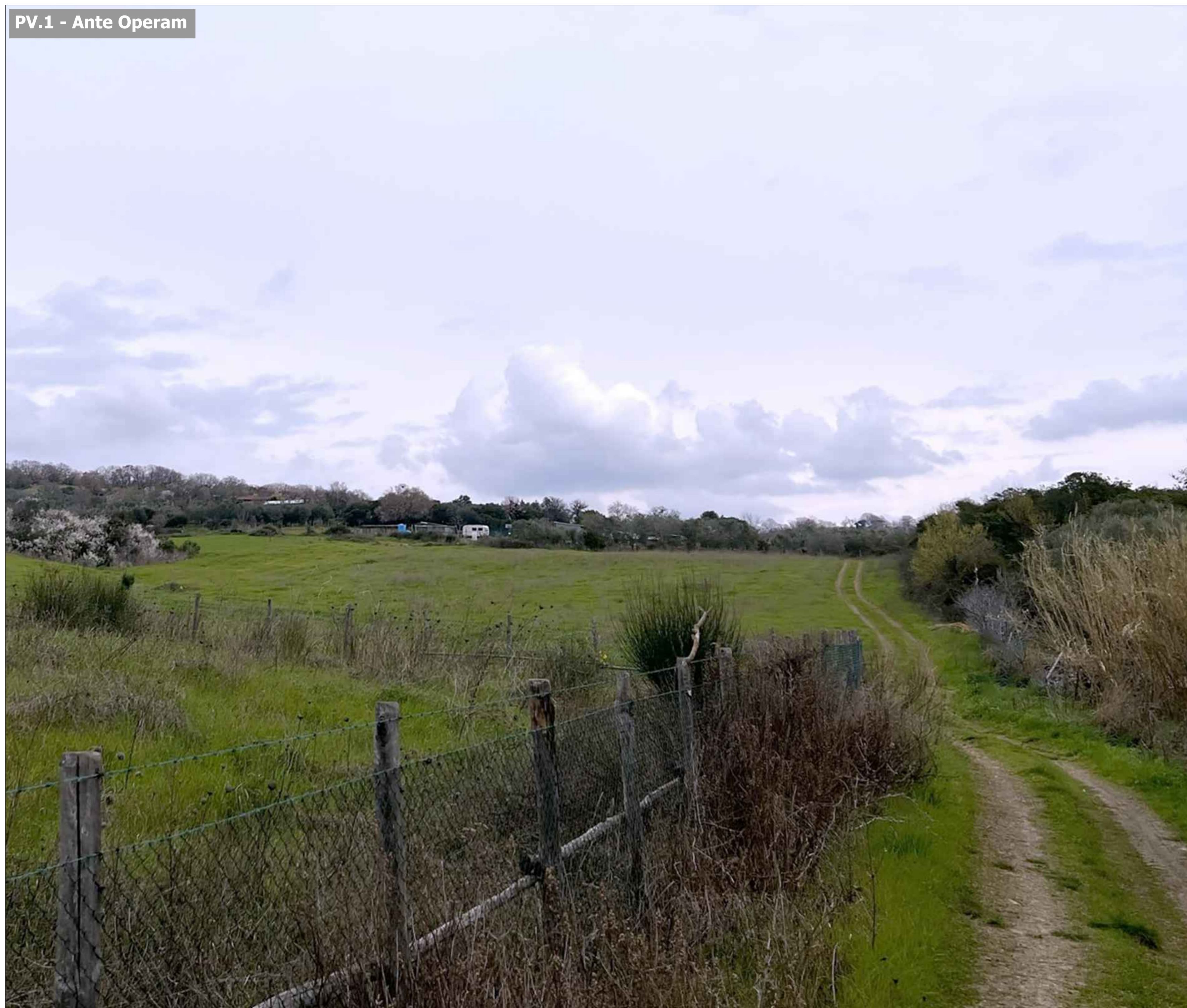
PV.1 - Ante Operam