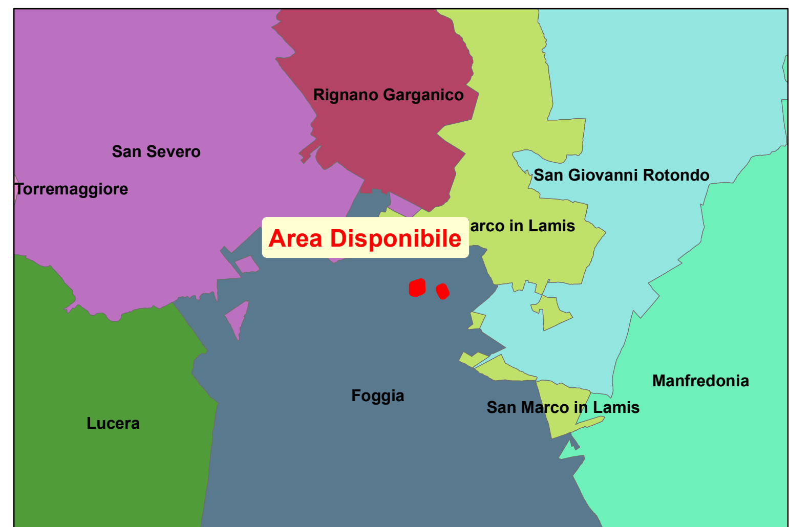
INQUADRAMENTO TERRITORIALE - SCALA 1:200.000