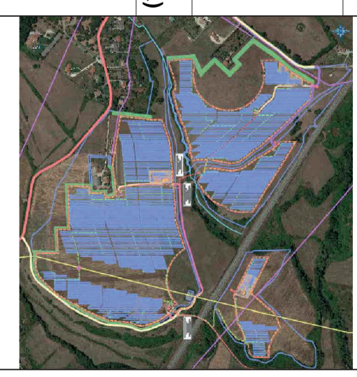
Tavola piano-altimetrica - Stato di fatto

PER I COMUNI DI GAVIGNANO (RM), PALANO (FR) E ANAGNI (FR)