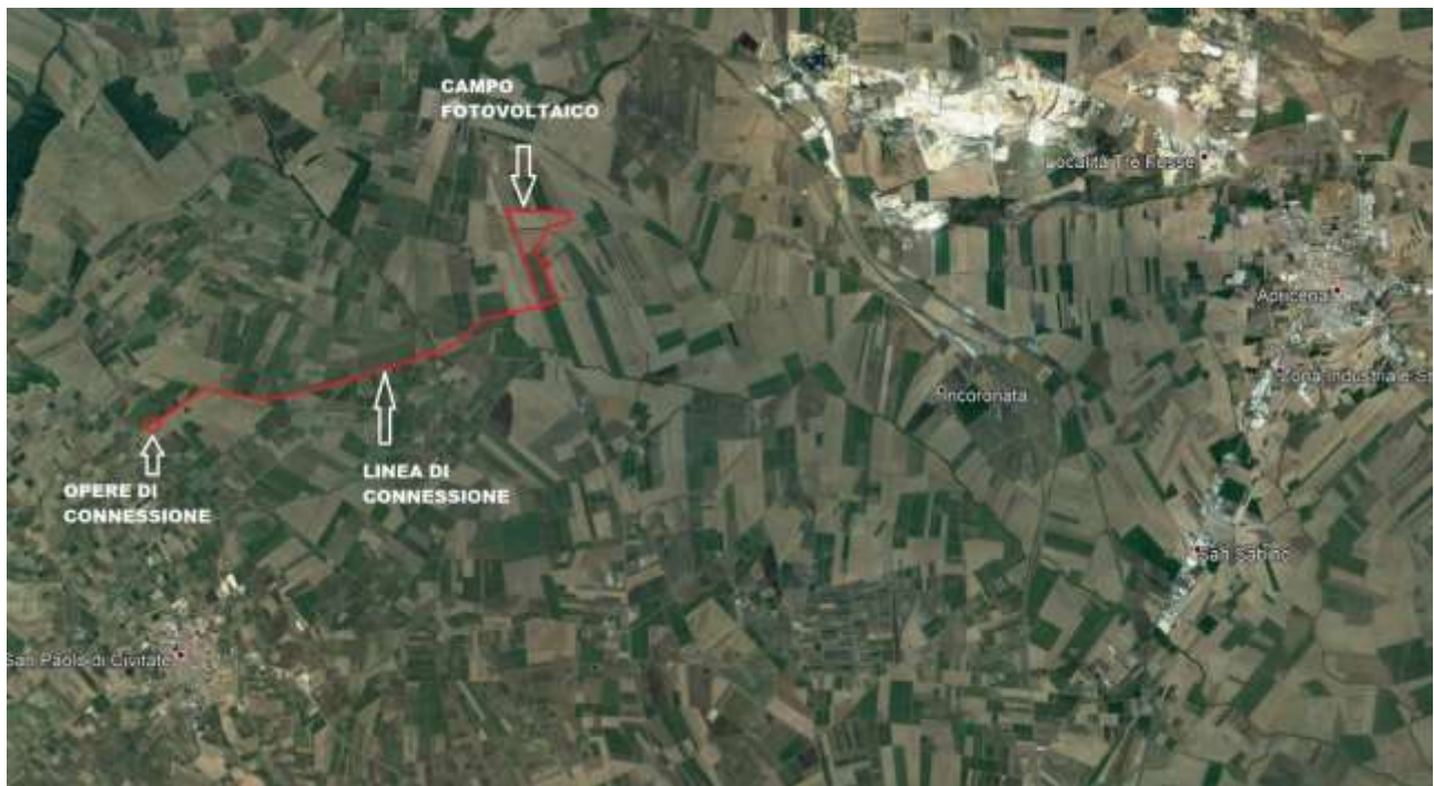
Vista d’insieme dell’impianto con collegamento cavo elettrico interrato