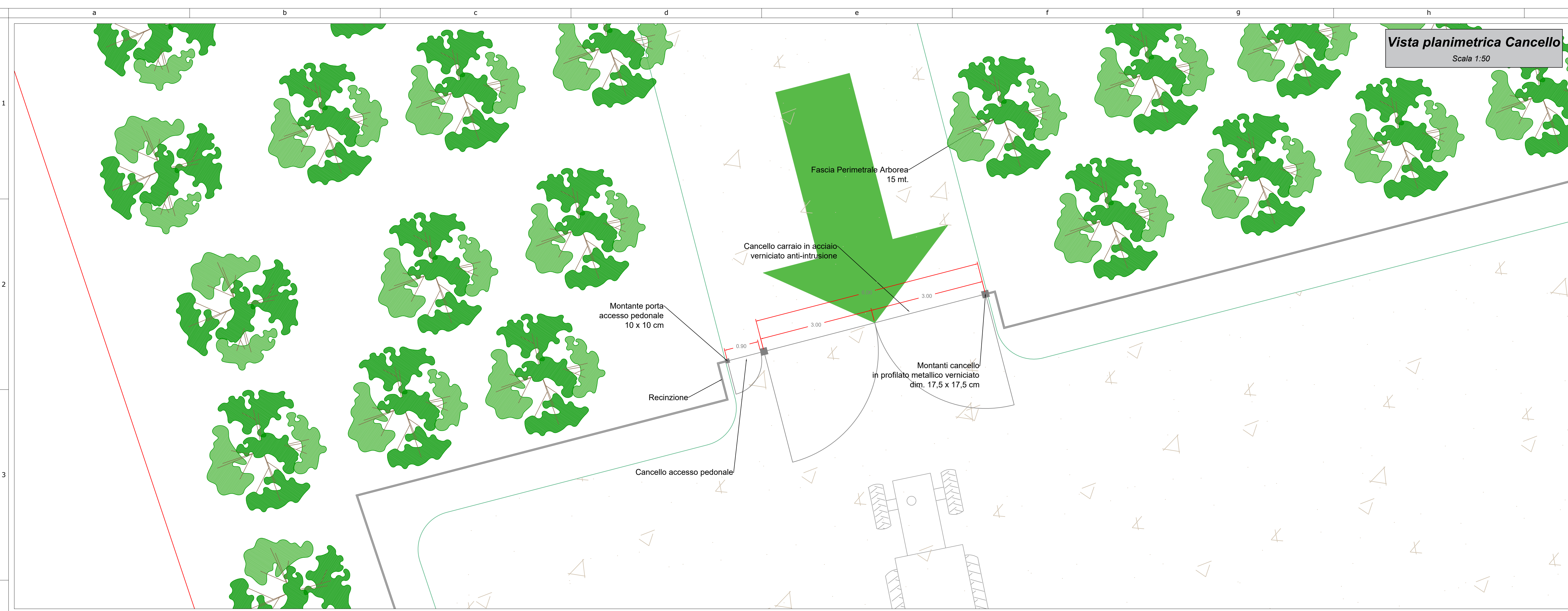
Vista planimetrica Cancelli Scala 1:50