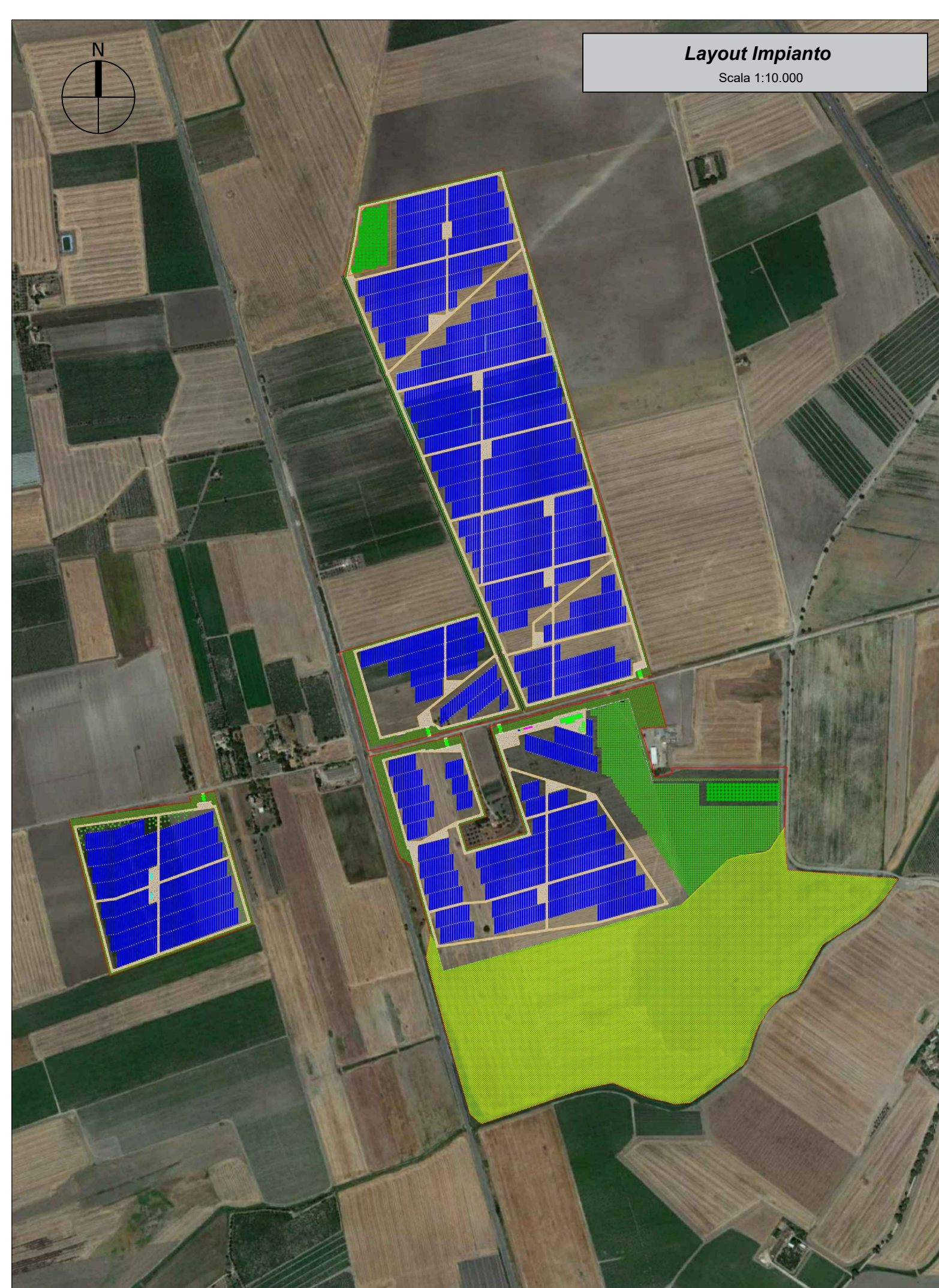
Layout Impianto Scala 1:10.000