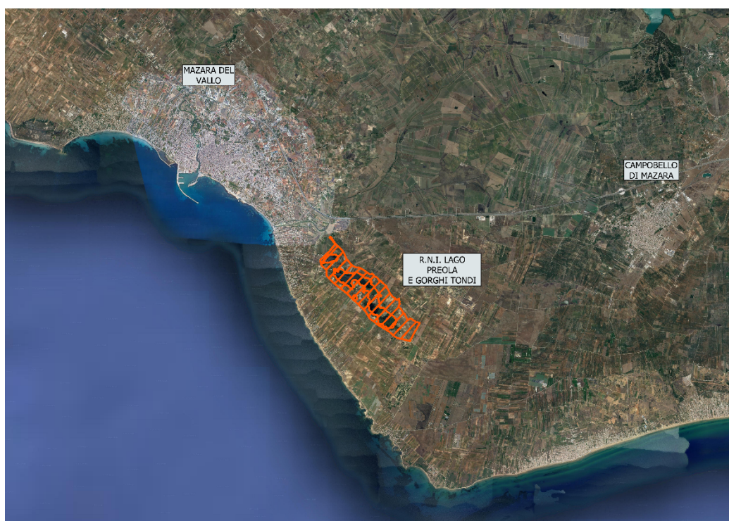
Fig. 2 – Perimetro dell'Area Riserva Regionale ai sensi del D.Lgs. 42/2004 nel quale ricade la R.N.I. "Lago Preola e Gorghi Tondi".

La Riserva Naturale Integrata "Lago Preola e Gorghi Tondi" è un'area protetta ai sensi della Legge regionale n. 98 del 1981 ed è stata istituita con Decreto dell'A.R.T.A. n. 620/44 del 04/11/1998. La Riserva si estende per un'area di 335 ha da Mazara del Vallo a Torretta Granitola. L'area fa parte della Rete Natura 2000 (ITA010031), in qualità di ZSC e ZPS ed è vincolata come zona umida ai sensi D.lgs.42/04. Al suo interno si trovano: gli specchi d'acqua di origine carsica, numerose specie vegetali e faunistiche e l'avifauna migratoria, che la rendono un territorio ricco di biodiversità.