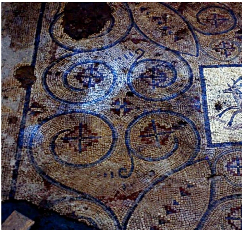
Fig. 1 – Stato attuale dei mosaici della Chiesa di San Nicolò regale.

Attualmente i mosaici versano in stato di abbandono e necessitano di interventi di recupero, pertanto, come da accordi con l'Amministrazione Comunale di Mazara del Vallo, si propongono i seguenti interventi, da effettuarsi anticipatamente rispetto ai lavori di realizzazione del parco eolico "Gazzera":