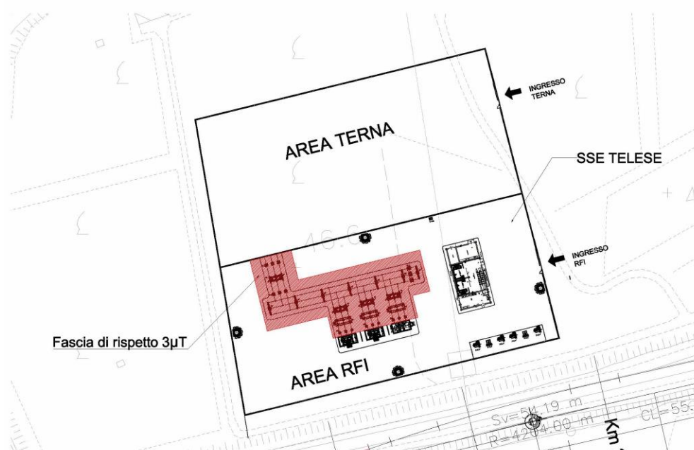
Fig.1 – Fascia di rispetto a 3 \mu\text{T}

La fascia di rispetto imposta dal DPCM 8 luglio 2003, ove l'intensità del campo magnetico assume valori maggiori di 3 \mu\text{T} è ubicata a circa 8,5 m dall'asse del sistema di sbarre, e quindi interamente contenuta entro la recinzione di sottostazione. Ne consegue che, a seguito dell'attivazione della nuova SSE di Telese, la zona oggetto dell'intervento non subirà una generale bonifica dal punto di vista dell'inquinamento elettromagnetico.