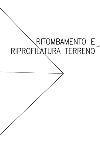
PROFILO LONGITUDINALE SCALA 1:200 FASE DEFINITIVA