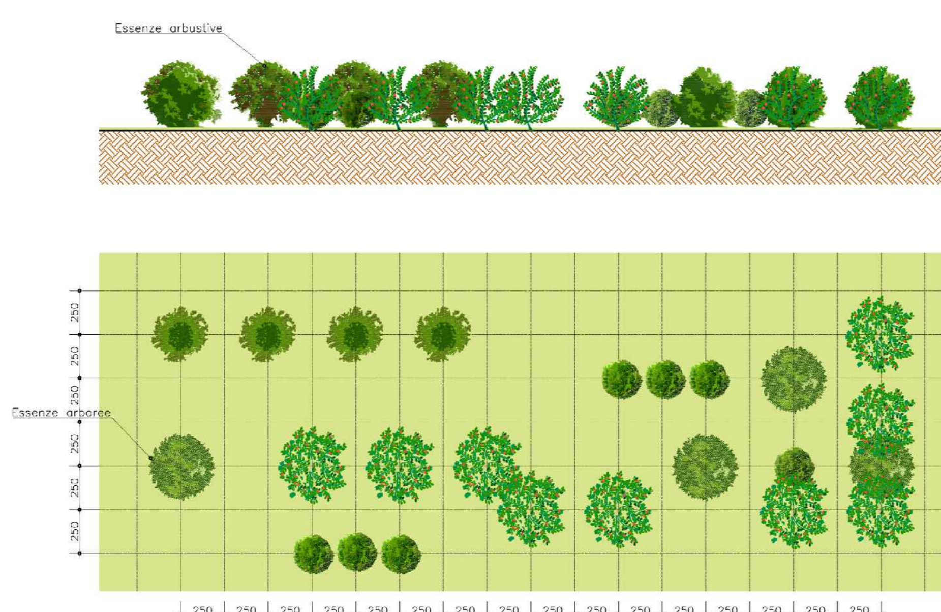
MODULO C - FASCE O MACCHIE ARBUSTIVE Scala 1:200

MODULO A - Siepe Mista piante di altezza compresa tra 0,4m e 0,8m con età minima di 2 anni. Essenze: - Pistacia lentisculus - Rosa sempervivens - Phyllirea latifolia a dimora n°17 arbusti ogni 100 mq