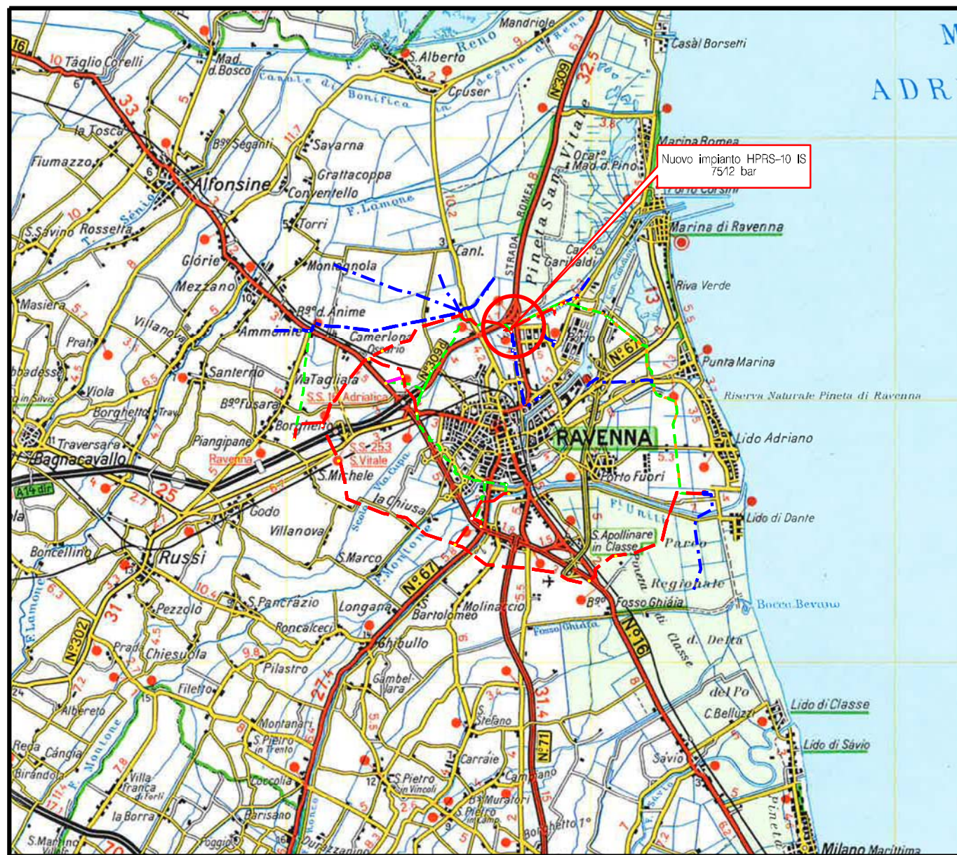
COROGRAFIA Scala 1:200.000